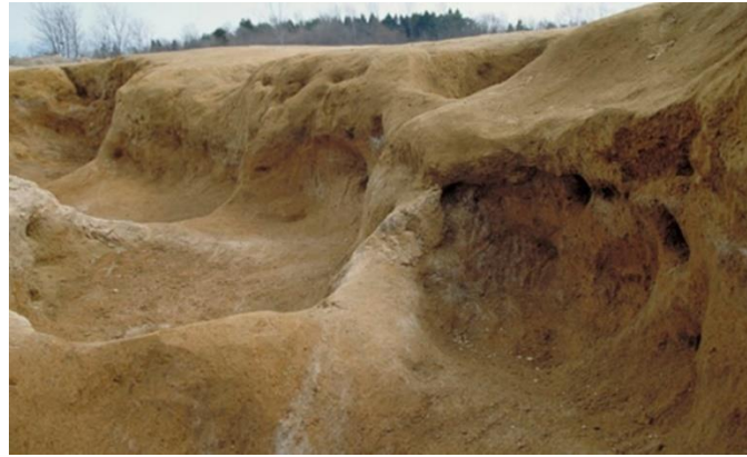
(شكل 24) حفر تعدين الطين- سنای ماروياما

تم العثور على حفر تعدين الطين وهي عبارة عن حفرة تم إنشاؤها لجمع الطين لصنع الأواني الفخارية ويبدو أن الطين الرماد البركاني كان مناسب لصنع الأواني الفخارية. 43 (شكل 24)