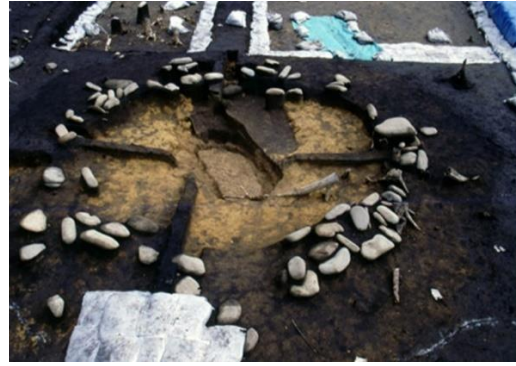
(شكل 9) دوائر حجرية للدفن - سنای