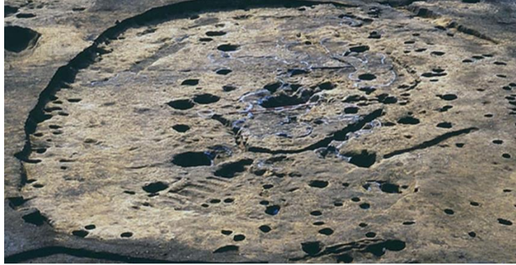
بقايا حفر مسكن يبلغ طوله أكثر من 10م – سناى ماروياما

عاش سكان "سناى ماروياما" في مساكن مشيدة أسفل سطح الأرض، ويقدر عدد الأشخاص اللذين كانوا يعيشون في المسكن الواحد حوالى من 4:5 أشخاص. 29 يطلق على المسكن الذى يزيد طوله عن 10 م حفر المساكن الكبيرة، وعثر على عدد من المساكن الكبيرة حول مركز المستوطنة وتوضح هذه المنطقة كيف تم بناء حفر المساكن خلال فترة جومون المبكرة حوالى 3900 ق.م، ويبلغ طول المبنى تقريباً حوالى 18م. 30 (شكل 3)