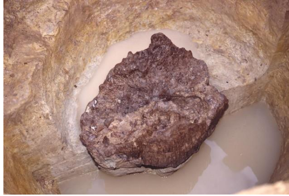
(شكل 8) بقايا عمود الكستناء المستخدم في تشييد البناء- موقع سناى ماروياما http://sannaimaruyama.pref.aomori.jp/english/index.html

تم العثور على بقايا عمود خشبي شيد من خشب الكستناء* وهو عمود خشبي يبلغ قطره حوالي 1م وعثر على بقاياه في حفرة عمود من بقايا مبنى مدعم بأعمدة كبيرة يؤرخ بالنصف الأخير من فترة جومون الوسطي (حوالي 2000 ق.م.) 35 (شكل 8). وكل هذا يشير إلى حجم الأعمال اللازمة لإعداد وقطع ونقل جزع الشجرة مصدر هذا العمود الضخم ونقله من الغابة إلى الموقع.