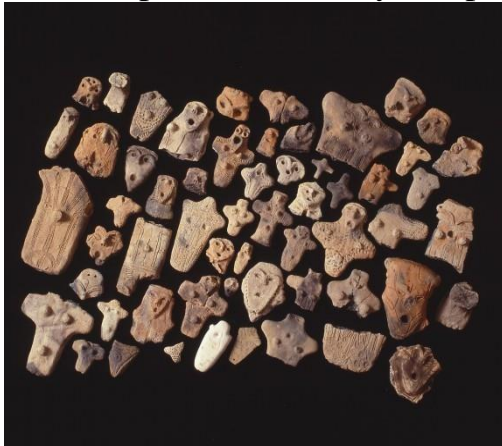
(شكل 17 ب)

https://sannaimaruyama.pref.aomori.jp/english/about/mounds