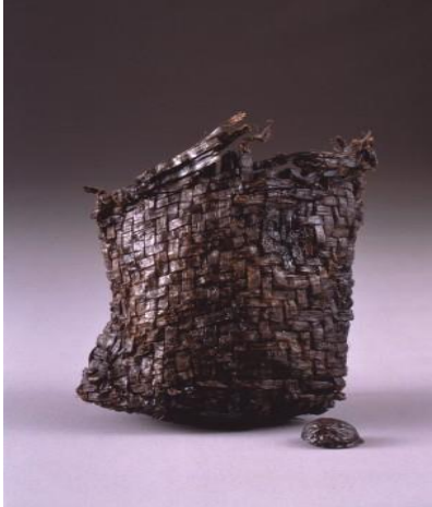
(شكل 14) سله تستخدم للتخزين - موقع سناى ماروياما Aomori-ken Kyoiku Iinkai 1998

عثر على سله صغيره ذات ارتفاع 16سم وتم تصنيعها من قطعة نسيج من لحاء الشجر بالطول والعرض باستخدام تقنية القش (أماليد مجدوله)، وهو المثال الوحيد في اليابان حتى الآن، وتم العثور على بقايا خشب الكستناء بداخل السله. 40 (شكل 14)