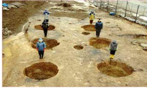
بقايا مساكن مستطيلة الشكل - موقع سنای ماروياما

تم إنشاء المباني المدعمة بأعمدة عن طريق عمل حفر في الأرضيات لدعم الأرضيات والسقف، عثر في الموقع على نمط آخر يسمى ببناء ذات الستة الأعمدة وهو عبارة عن بقايا بناء مدعم بأعمدة ضخمة، عبارة عن ستة ثقوب من الأعمدة تم ترتيبهم على صفين في كل صف ثلاث حفر تم ترتيبهم بدقة، عمق وقطر كل ثقب حوالي 2م، والمسافة بين كل ثقب حوالي 4,2م، والمسكن يأخذ الشكل المستطيل (شكل 6) وكانت الأرض في تلك الفترة مشبعة بالمياه الجوفية لذا فقد تمت معالجة الأعمدة التي تم تشيدها من الأخشاب عن طريق حرقها وتحميمها في الجزء السفلي لحماية الخشب من التآكل. 33