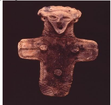
(شكل 17 أ)