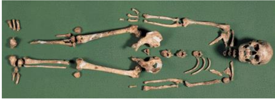
(شكل 2) إنسان ميناتوغاوا – متحف العلوم بطوكيو

تم العثور على أقدم العظام البشرية في كهف "ياماشيتا دايتش" في "أوكيناوا" في عام 1962م، ويعتقد أنها بقايا متحجرة لفتاة تبلغ من العمر حوالي ثماني سنوات وبأستخدام تأريخ الكربون المشع تشير إلى أن يكون عمر تلك العظام حوالي 30,000 ق.م وقد تم تسمية الحفريات "ياماشيتا دوجين" 20 في عام 1967 في "ميناتوغاوا" اكتشفت عظام بشرية متحجرة يرجع تأريخها إلى 16,000 ق.م، وأطلق عليه رجل "ميناتوغاوا" (شكل 2).