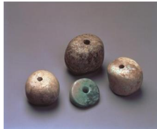
(شكل 18) حلي كبير jade - موقع سنای مارویاما

http://jomon-japan.jp/en/archives/library/1965/