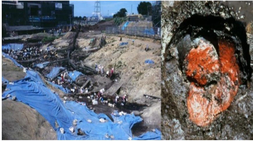
(شكل 19) شمال الوادي - سناى ماروياما

كان شمال الوادي عبارة عن حفرة، وكانت التربة غنية بالرطوبة مما سمح باكتشاف البقايا العضوية في حالة جيدة والتي كانت ستحلل لولا ذلك، مثل بقايا عظام الأسماك (شكل 20) والحيوانات (شكل 21) وأدوات طحن الحجارة (شكل 22) وحبور النباتات (شكل 23) والأواني المطلية بالورنيش والمصنوعات الخشبية والسلال المنسوجة، كشفت هذه البقايا على النظام الغذائي لسكان المستوطنة في تلك الفترة الزمنية. 42