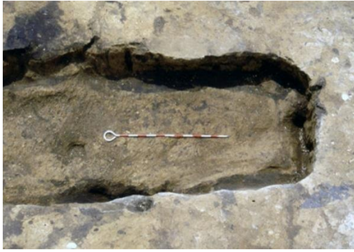
(شكل 10) حفر دفن للبالغين - سنای

تصطف الدوائر الحجرية مع المدافن على المنحدر على طول الطريق الممتد إلى الجنوب، ويبلغ قطر كل حفرة حوالي 4 أمتار (شكل 9)، وتم العثور على مقابر للبالغين في الداخل، دفن الأشخاص البالغين داخل حفر للدفن وكانت تصطف الحفر على جانبي الطريق في مواجهة بعضها البعض (شكل 10) وتم التنقيب عن البقايا الحجرية واليشم المدفونة مع البقايا البشرية في بعض المقابر. 36