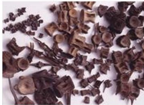
(شكل 20) بقايا عظام أسماك