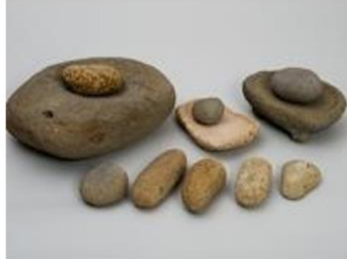
(شكل 22) أدوات طحن