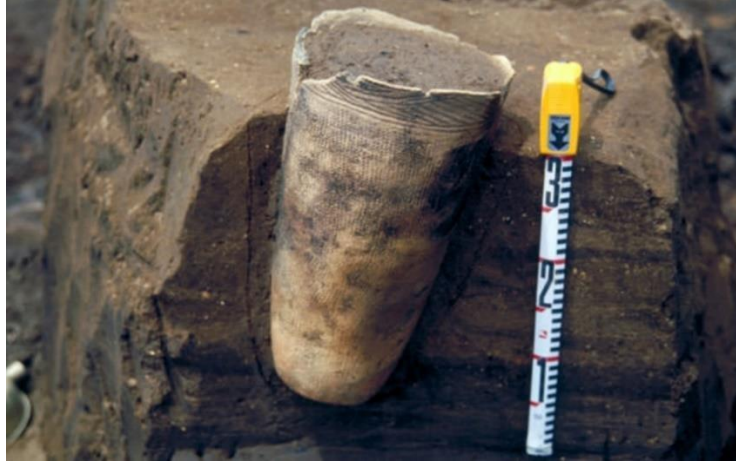
(شكل 11) إناء فخارى لدفن الأطفال – سناى ماروياما

كان يتم دفن الأطفال داخل أواني فخارية وعثر على ما يقرب من 900 مقبرة داخل موقع "سناى ماروياما" وكان يستخدم كتوابيت وكان الإناء الفخاري له فجوة أوثقب وكسر فى الحافة أو القاع وكان مختلف فى الشكل عن الفخار المستخدم فى الطهي، وتم العثور على حجر بحجم قبضة اليد فى الأنية الفخارية 37 (شكل 11)