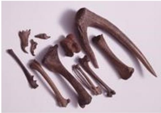
(شكل 21) بقايا عظام حيوانات

https://sannaimaruyama.pref.aomori.jp/english/about/north-valley