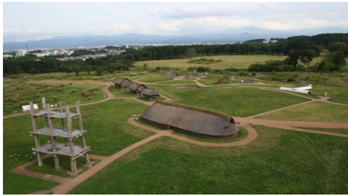
(شكل 25) صورته جوية لموقع سناى ماروياما

▪ وتم وضع خطط حفظ والادارة التى تم تنطوريها بشكل فردى.