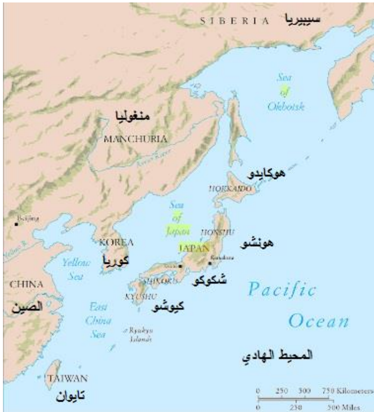
(خريطة 1) توضح حدود اليابان مع أهم الجزر

Philip J. Adler , Randall L. Pouwels 2014