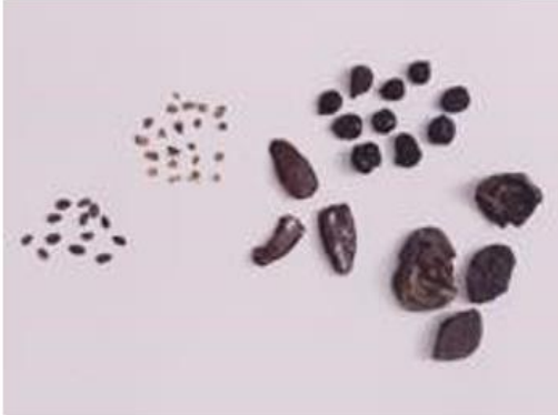
(شكل 23) بذور النباتات