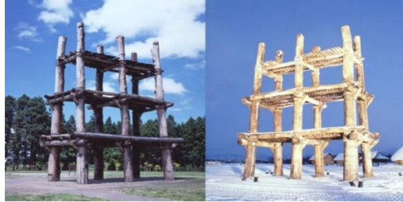
إعادة تصور لمساكن مستطيلة الشكل - موقع سنای ماروياما

أعيد بناء هذا المسكن بارتفاع 14,7 متر كمبنى مكون من 3 طوابق بعرض 4,2م عن طريق تقدير حجمها بأكملها استنادًا إلى نتائج أعمال التنقيب وتحليل الضغط على الأتربة في أسفل حفر الأعمدة التي تم تطبيقها على الأرض في الجزء السفلي من فتحات العمود، ولم يتم إعادة بناء السقف لوجود العديد من النظريات المحتملة فيما يتعلق به الشكل 34 (شكل 7)