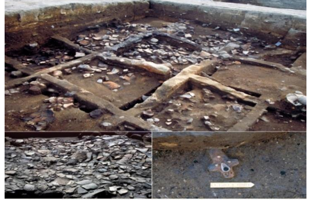
(شكل 16) التلة الجنوبية - موقع سنای مارویاما