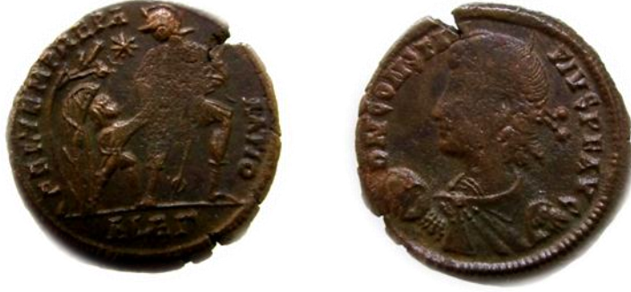
عملة رقم ٣

عملة للامبراطور قنسطانس الاول