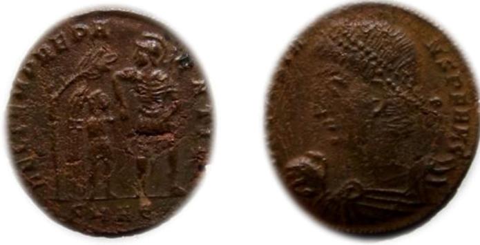
عملة رقم ٦

عملة للإمبراطور قنسطنطيوس الثاني