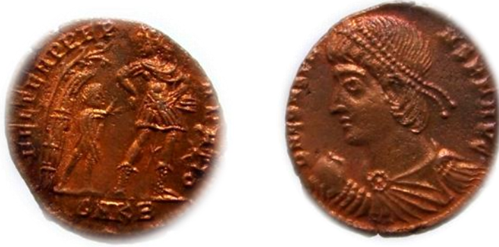
عملة رقم ٢

عملة للإمبراطور قنسطانس الأول