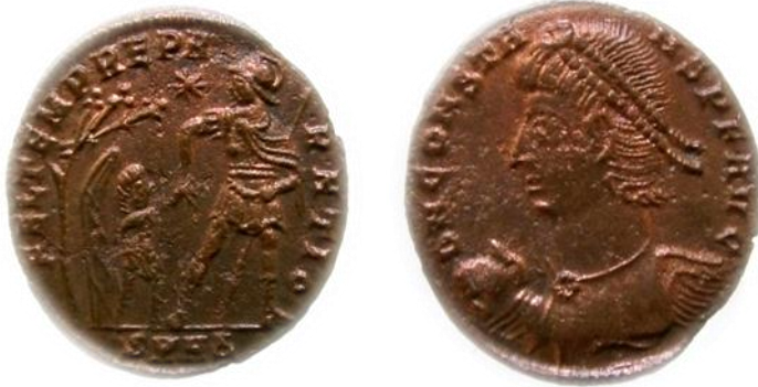
عملة رقم ٤

عملة للامبراطور قنسطانس الاول