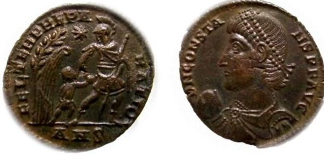
عملة رقم ١

عملة للإمبراطور قنسطانس الأول