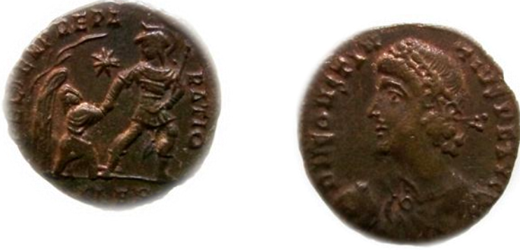
عملة رقم ٥

عملة للإمبراطور قنسطنطيوس الثاني