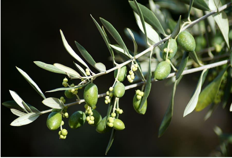
شكل رقم ١ شجرة الزيتون