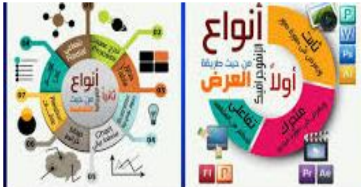
شكل تخطيطي يوضح أنواع الإنفوجرافيك التعليمي

٣- الإنفوجرافيك التفاعلي "Infographic Interactive" هو ذلك النوع من الإنفوجرافيك الذي يحقق مزيد من التفاعلية ويسمح بمزيد من المشاركة مع المتعلم، حيث يسمح له باكتشاف البيانات بنفسه مما يجعله علي اتصال مع التصميم