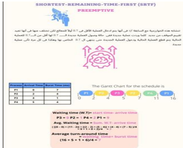
شكل (٥) شاشات من الإنفوجرافيك المتحرك ببيئة التعلم الإلكتروني

قامت الباحثة بمقابلة الطلبة وتعريفهم بطريقة العمل بأن عملية التعلم ستتم من خلال نمطى الإنفوجرافيك المتحرك والتفاعلى ببيئة التعلم التكيفية ولن تتم بالطريقة التقليدية وتم تصنيفهم (لمرتفعى / منخفضى) السعة العقلية وفقاً لاختبار الأشكال المتقاطعة "لبسكاليونى" وتم تسليمهم كلمة المرور واسم المستخدم الخاص بكل طالب وكذلك عنوان بيئة التعلم المتاحة عبر الويب وهو http://Adaptive4all.com وسيتم اختيارهم وتسجيلهم عشوائياً للدخول لأحد المقررين حيث أن الطالب المسجل فى المقرر الأول وهو تصميم مهارات نظم تشغيل الحاسب الألى من خلال نمط الإنفوجرافيك المتحرك فى بيئة التعلم الإلكترونية موودل لا يستطيع الدخول للمقرر الثانى وهو تصميم مهارات نظم تشغيل الحاسب الألى من خلال نمط الإنفوجرافيك التفاعلى عبر الموودل والعكس صحيح فالمقرر بهم واحد والأنشطة والمهام