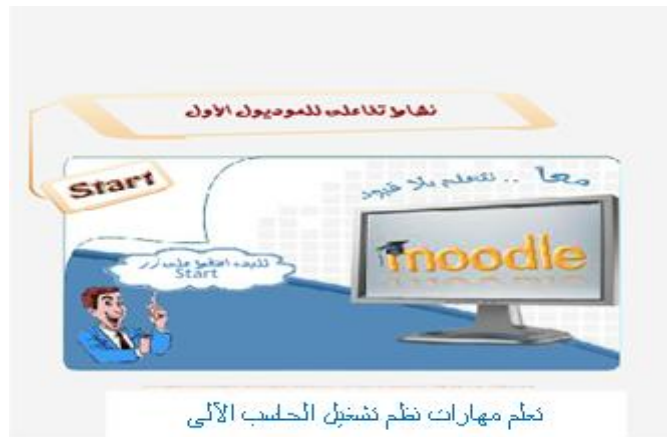
شكل (٤) يوضح النشاط التفاعلى للموديول الأول عبر بيئة التعلم الإلكتروني

مدخلات هذه العملية هي الأهداف التعليمية التي سبق تحديدها، ويتم فيها اختيار خبرة أو مجموعة خبرات تعليمية لكل هدف من أنماط الخبرات التعليمية، واعتمدت الباحثة أثناء تطبيق نمطى الإنفوجرافيك المتحرك والتفاعلى بيئة التعلم التكيفية على مجموعات التشارك أثناء تنفيذ الأنشطة والمهام التعليمية المتضمنة داخل الموديولات