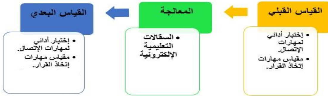
شكل (١): التصميم التجريبي للبحث

■ التصميم التجريبي للبحث: استخدام التصميم التجريبي ذو المجموعة التجريبية الواحدة، ذات القياس القبلي/البعدي "Pretest-Posttest Design"، وذلك كما هو موضح بالشكل الآتي: