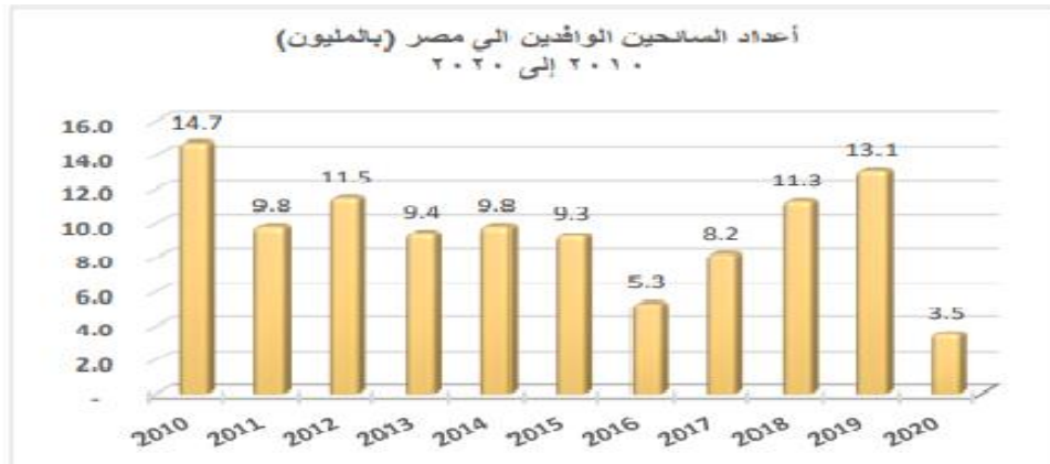
شكل رقم (١) السياحة المصرية قبل وأثناء وأثناء أزمة كورونا

واصلت السياحة المصرية نجاحاتها خلال شهري يناير وفبراير عام ٢٠٢٠، إلا أنه في شهر مارس تفشت جائحة فيروس كورونا في العالم، وتبع ذلك اجراءات قامت بها اغلب دول العالم مثل تعليق حركة الطيران الدولي في جميع المطارات المصرية في ١٩ مارس ٢٠٢٠، لتتوقف بذلك الحركة السياحية تماماً في البلاد، مما أدى إلى هبوط معدلات الحركة السياحية إلى مستويات غير مسبوقة في تاريخ القطاع السياحي المصري، حيث وصل الي أقل توافد في أعداد السائحين بنحو ٣,٥ مليون سائح فقط. ويعتبر ٢٠٢٠ عام اعلي انخفاض للطلب السياحي علي مصر نتيجة فيروس كورونا المستجد-covid-19" (الاتحاد المصري للغرف السياحية، ٢٠٢١؛ Egypt tourism Revenues, 2021؛ Country report Egypt, 2021. موضح ذلك بالشكل رقم (١) وكذلك الجدول رقم (١) والجدول رقم (٢).