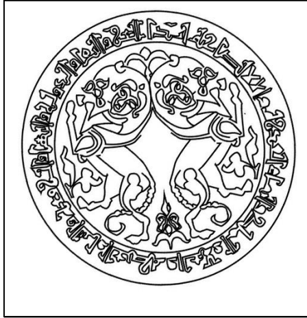
شكل (١) ظهر المرأة لوحة (١)، عمل الباحث