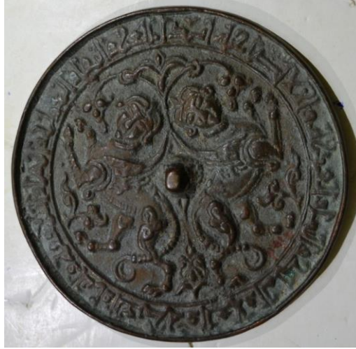
لوحة (١) ظهر مرآة من البرونز، إيران القرن (١٢ هـ / ١٢ م)، متحف الفن الإسلامي بالقاهرة، برقم سجل ٣٩١٥، تنشر لأول مرة.