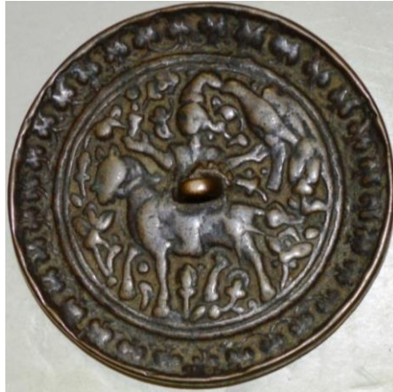
لوحة (٤) ظهر مرآة من البرونز، إيران القرن (١٢/هـ ١٢م)، متحف الفن الإسلامي بالقاهرة، برقم سجل ١٥٣٣٨، تنشر لأول مرة.