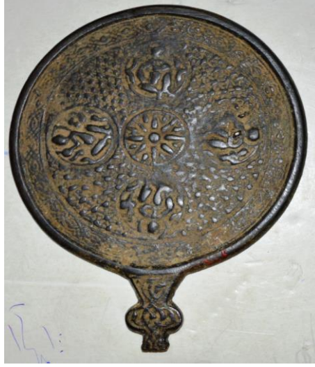
لوحة (٣) ظهر مرآة من البرونز، إيران القرن (١٣/هـ ١٣م)، متحف الفن الإسلامي بالقاهرة، برقم سجل ١٥٣٣٢، تنشر لأول مرة.