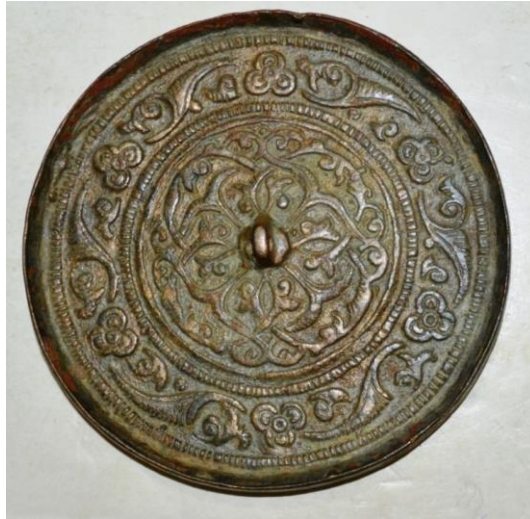
لوحة (٢) ظهر مرآة من البرونز، مصر القرن (١٣ هـ / ١٣ م)، متحف الفن الإسلامي بالقاهرة، برقم سجل ١٥٣٢٨، تنشر لأول مرة.