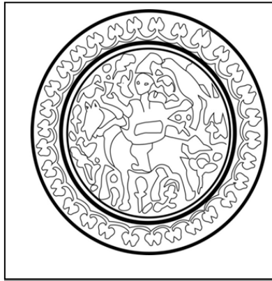
شكل (٤) ظهر المرأة لوحه (٤)، عمل الباحث