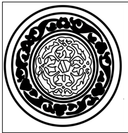
شكل (٢) ظهر المرأة لوحة (٢)، عمل الباحث