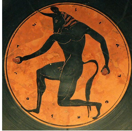
شكل (1) مخلوق المينوتور ، متحف إسبانيا الوطني للآثار .

https://www.theoi.com/Gallery/T34.4.html