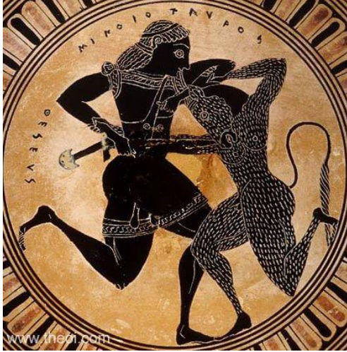
شكل (2) البطل ثيسوس يحارب المينوتور، خزفية من القرن السادس قبل الميلاد.

https://www.theoi.com/Gallery/T34.4.html