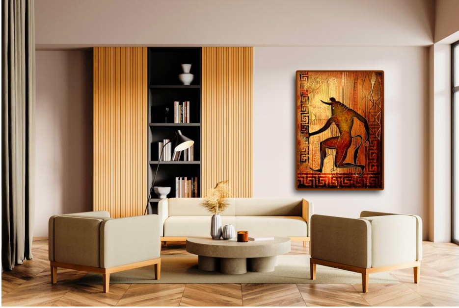
شكل (12) توضح نموذج تخيلي للتصميم كמעلاقة في إحدى غرف المعيشة.