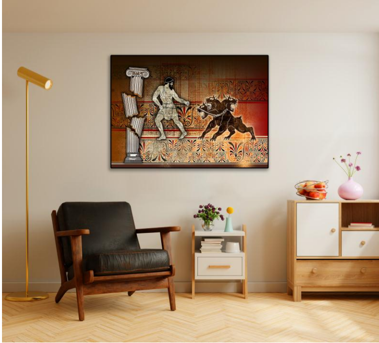
شكل (20) توضح نموذج تخيلي للتصميم كمعلقة في احدى غرف المعيشة.