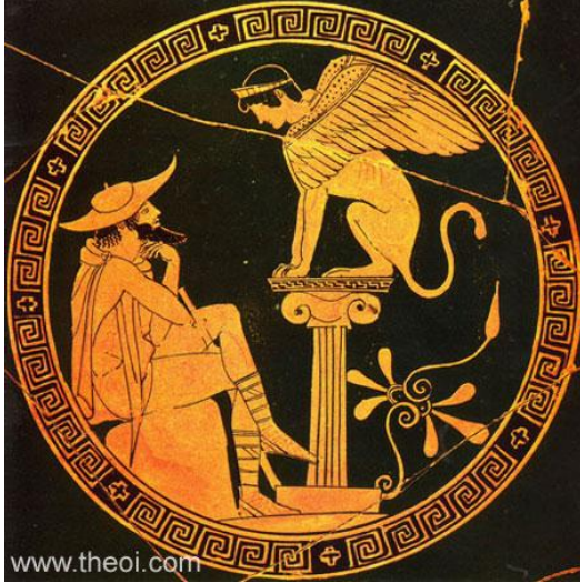
شكل (4) أوديب وهو يحل لغز السفينكس ، القرن الخامس قبل الميلاد ، متحف Gregorian Etruscan . https://www.theoi.com/Gallery/M18.2.html

لسفنكس اليوناني في الميثولوجيا الأغريقية رأس و رقبة امرأة ، وجناحا طير ، وجذع الأسد وقوائمه. وكانت قد أرسلته هيرا إلهة الأرض ليهدد مدينة طيبة ويجلب الوباء عليها عقابا للمدينة على تصرفات ملكها لايوس ، وقضى عليها البطل أوديب. شكلي (3 و 4) (كامل، 2003 م ، ص110) ، (سلامة ، 1988م ، ص33)