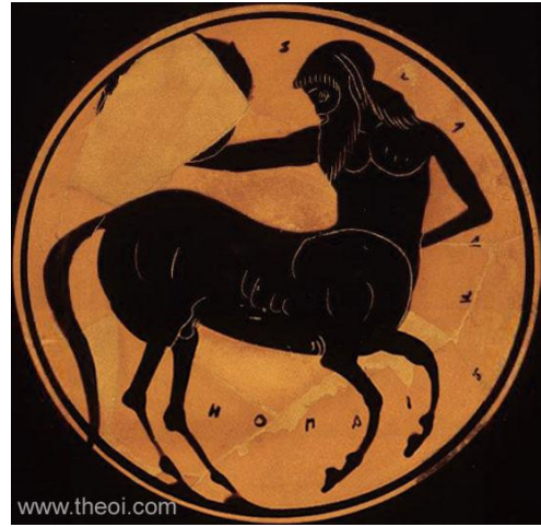
شكل (7) القنطور، رسم دائري على فخار إغريقي يعود إلى القرن السادس قبل الميلاد ، متحف توليدو للفنون

https://www.theoi.com/Gallery/O12.9.html