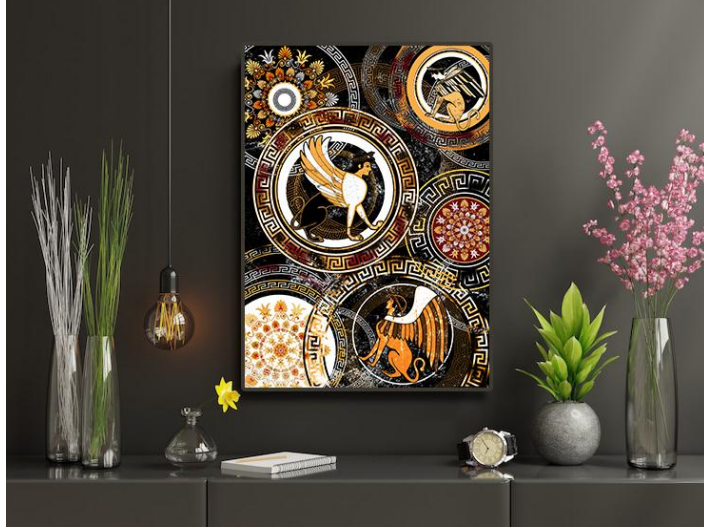
شكل (14) توضح نموذج تخيلي للتصميم كمعلقة في إحدى الغرف كا جزء من الديكور الداخلى فوق الطاولة.