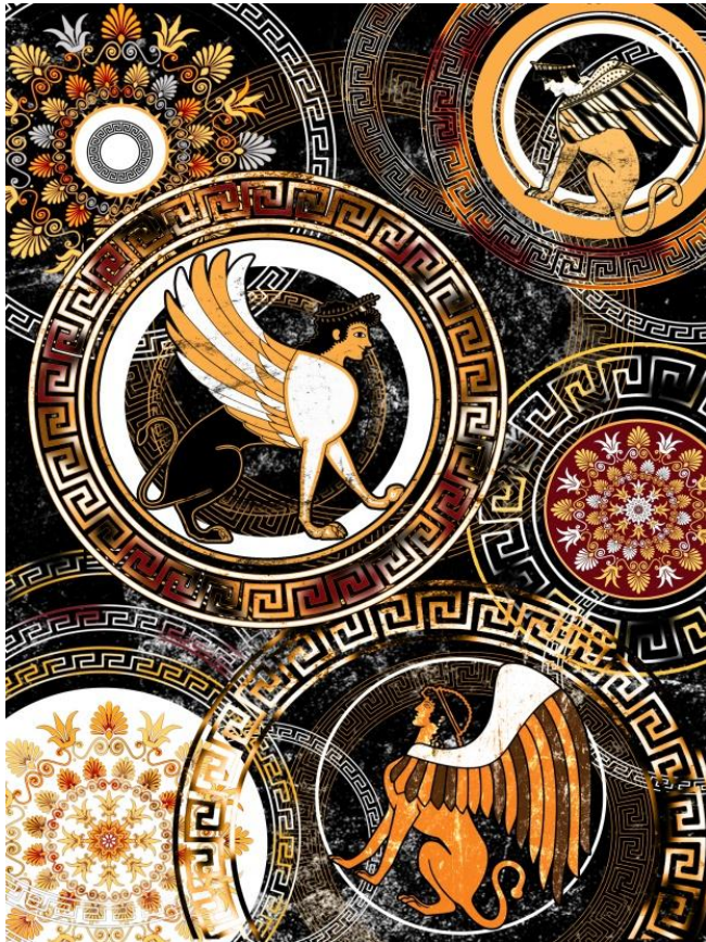
شكل (13) الفكرة التصميمية رقم (2)