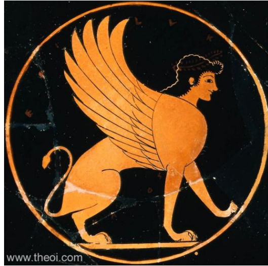
شكل (3) سفينكس داخل اطار دائري ، القرن السادس قبل الميلاد ، متحف الفنون الجميلة في بوسطن . https://www.theoi.com/Gallery/M18.1.html