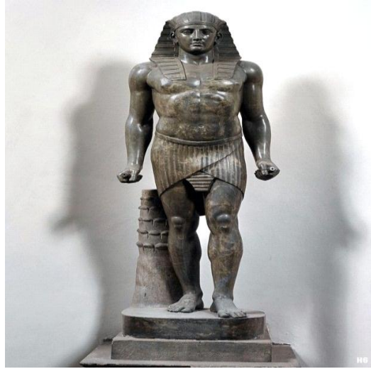
صورة رقم(٣)تمثال لأنتينوس أوزيريس من البرونز الأسود،مرتدياً النمس الملكي والنقبة الملكية ويمسك بيده أختام ملكية.

https://commons.wikimedia.org/wiki/File:Antinous_Osiris_Louvre.jpg