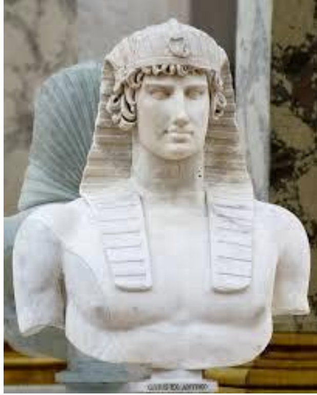
صورة رقم (٢) تمثل نصفي لأنتينوس أوزيريس مرتدياً النمس الملكي يتقدمه حية الكوبرا رمز للقوة والسلطة.