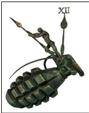
شكل رقم (١١) . نجم القيسى , اللاعنف , برونز , ٢٠٢٢ , ٤٥*١٨*٢٩ سم , العراق

حاول الفنان فى هذا العمل تقديم رؤية تشكيلية وجمالية من خلال الإستفادة من القيم البصرية لشكل الساعة والقنبلة مع الجسد الأدمى فى تلاعب مع الفراغ المحيط فنجده تجسيده للقنبلة قد إتخذ كمعادل موضوعي للعنف فى التكوين , فهناك شخص يسعى لإيقاف لحظة الانفجار المروّع من خلال منع أميال الساعة أن تتلاقى لكي لا تحدث الكارثة , ومن يتمن بطبيعة مفردات ووحدات التكوين سيجد الأبعاد الدرامية متجسدة من خلال قوة وصلابة الجذب لعقارب الساعة هادفاً من ذلك خلق مناظرة إستفزازية تمتأت بتعميق البروزات الحادة فى الشكل التى تثير القلق فى موضوع نبذ العنف , وتأتى عقارب الساعة فى خطوط قاطعة للفراغ لتحدث ديناميكية فى الحركة تنتج بين الكتل والفراغات.