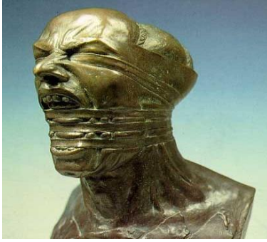
(5) شكل رقم

سامى محمد ، الشلل والمقاومة ، ١٩٨٠ ، برونز ، ١٣٥*٦٤*٣٩سم ، الكويت ، المركز الوطنى للتقافة والفنون