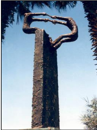
(9) شكل رقم

محمد العلاوي ، الإختيار الصعب ، ١٩٩٣ ، بوليستر ، ٣٦*٢٣*١٠٠ سم ، متحف كلية الفنون الجميلة ، مصر