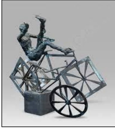
شكل رقم (12)

نجم القيسى ، نقطة تحول ، برونز ، ٢٠١٤ ، معرض جماعي ، العراق ، ٤٠*٤٢*٢٧سم