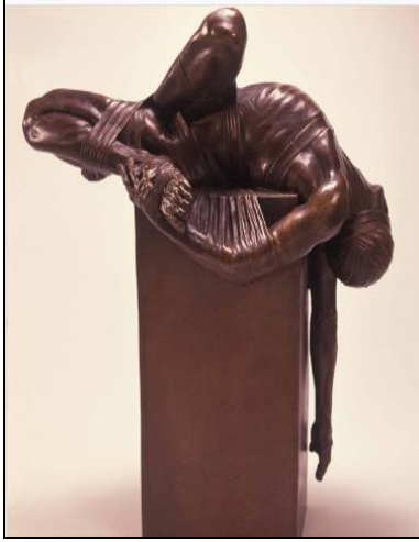
شكل رقم سامى محمد ، برونز ، ١٩٨٣ ، صبرة وشتيلة ، ٦٨ * ٢٥ * ٥٨ سم ، الكويت ( 4 )