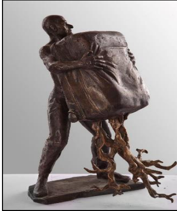
شكل رقم (7)

لبارز للأبنية والمساجد في أعلى التكوين , فيظهر توزيع درجات الضوء بإيقاع سريع متلاحق , كما ينبثق تنوع الخطوط ما بين الرأسية والأفقية والمنحنية ليعطينا مجموعة من الأحاسيس المركبة المكونة لوحدة العمل .