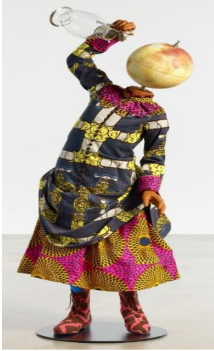
(8) شكل رقم

Water ، طفل الماء SHONIBARE بنكا شونيبار التمثال من خامة الفايبر الزجاجي مع ، 2020 ، Kid ، نسيج قطني مطبوع بالشمع الهولندي ، كرة أرضية ، نحاس ، لوح أساسي فولاذي ، إبريق ماء عتيق ؛ ١٣٤ x ٥٧ x ٥٠ سم ؛ معرض جيمس كوهان، الولايات المتحدة الأمريكية