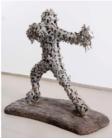
(15) شكل رقم

يقدم النحات أحمد كنعان في أعماله النحتية جوانب متنوعة من حالات إنسانية إستلهاماً من صراعات التهجير واللجوء وما