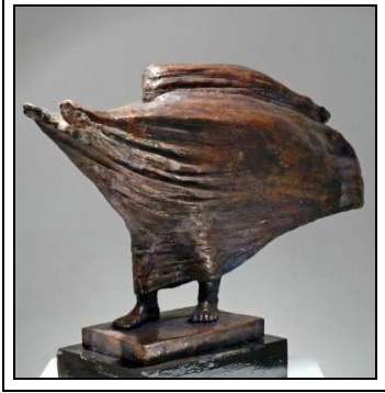
شكل رقم (10)

العلوى من القلة الذين تهتز جوارحهم لأى هاجس يهدد الوطن , فهو صاحب قضية إستثمر خياله الغزير فى تلك المنحوتة التى تعبر عن مأساة الأحداث السياسية بمصر خصوصاً فى الفترة التى تسبق ثورة ٢٥ يناير فى عهد الرئيس السابق والتنبؤ بحدوث ثورة وشيكة , فالى متى سوف نظل نتنازع ونتصارع على السلطة ونتفرق كأحزاب مختلفة ضد مصلحة الوطن , فقد أتت أعماله مثيرة للأسئلة تقف فى صف واحد مع الإنسان معبراً عن هموم وقضايا مجتمعه المصرى , " فالفنان المبدع