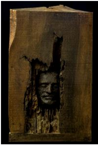
(14) شكل رقم

مصطفى علي، " حلم قاسى "، ٢٠٠٢، خشب وبرونز، ٤٧*٤٧*١٢٥ سم، معرض شخصى، سوريا