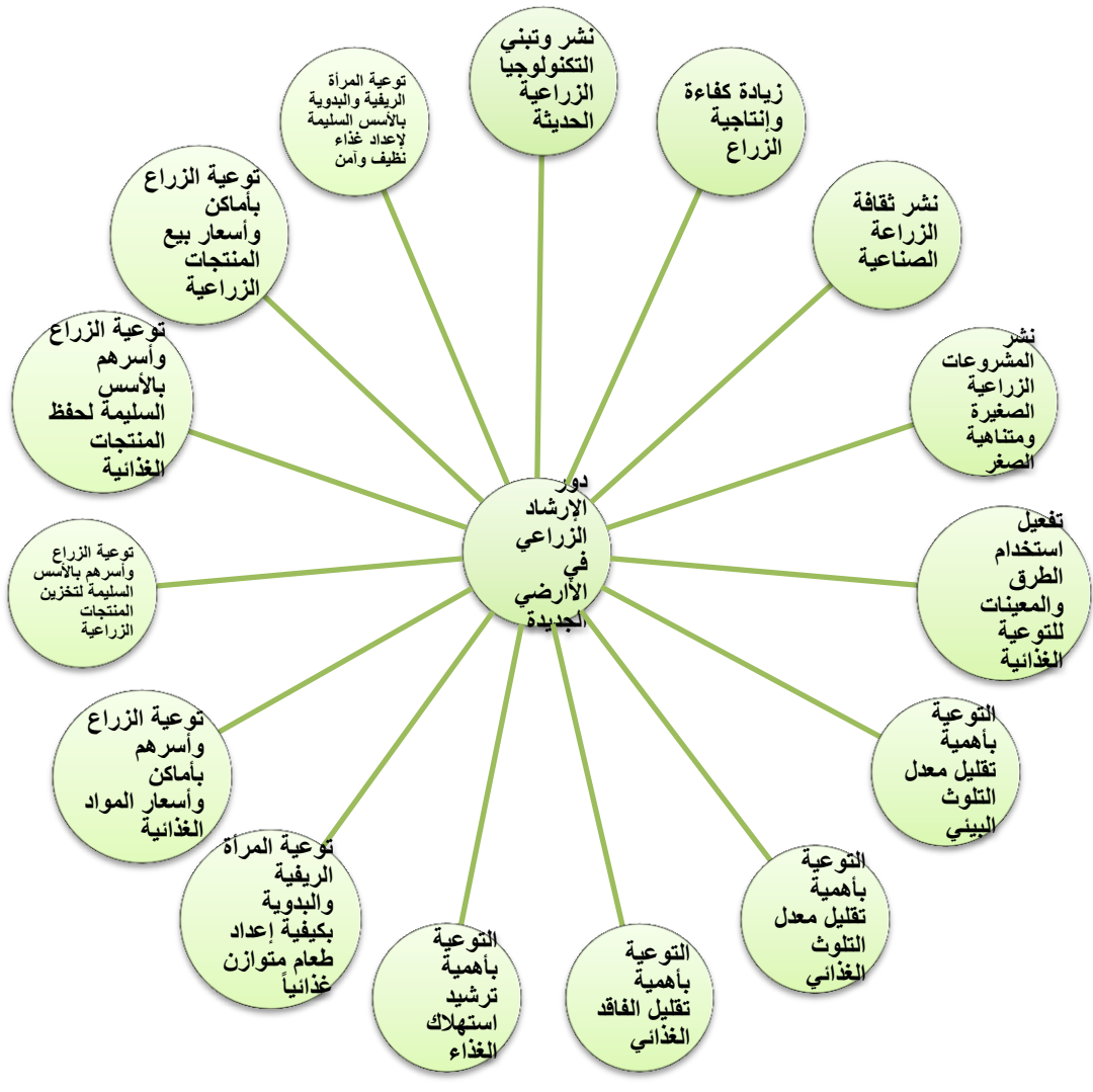
شكل (3) يوضح دور الإرشاد الزراعي في تحقيق الأمن الغذائي بالأراضي الجديدة