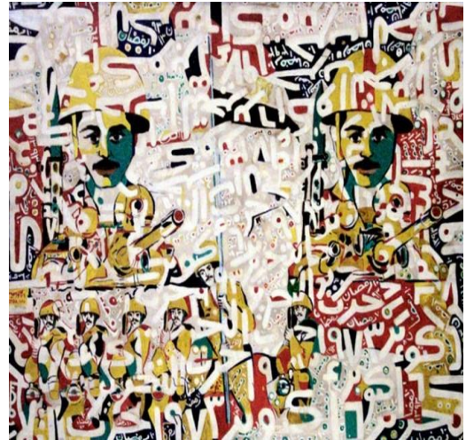
شكل رقم (٧)

لوحة "أكتوبر ٧٣" المتحف الفني الحديث بالقاهرة ٥٥ × ٨٤ سم - زيت على توال ١٩٧٣