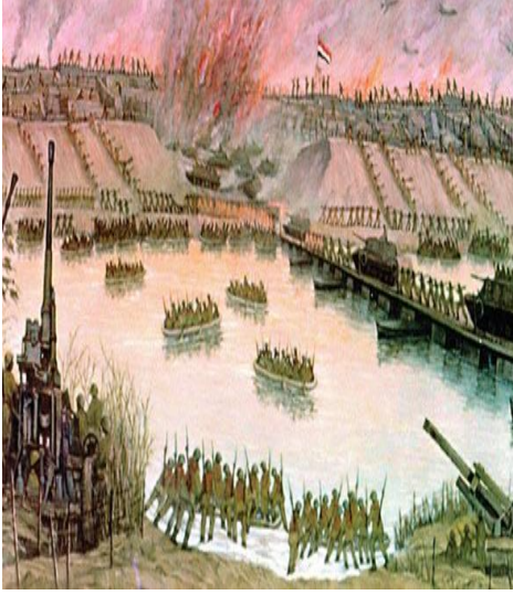
شكل رقم (٢)

لوحة "العبور" مقتنيات قصر عابدين ١٥٠ × ٢٥٠ سم - زيت على توال ١٩٨٣