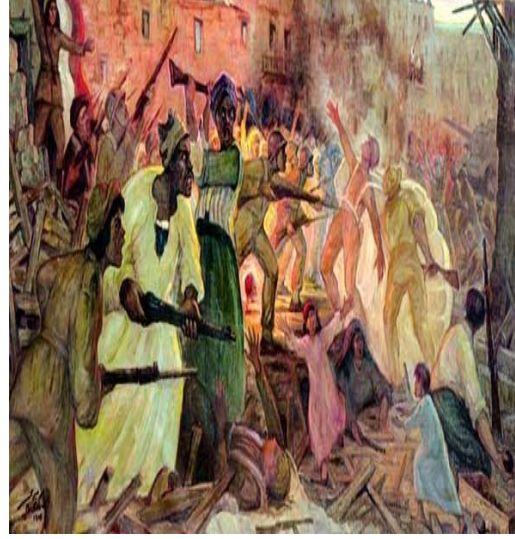
شكل رقم (١)

لوحة "العبور" مقتنيات قصر عابدين ١٥٠ × ٢٥٠ سم - زيت على توال ١٩٨٣