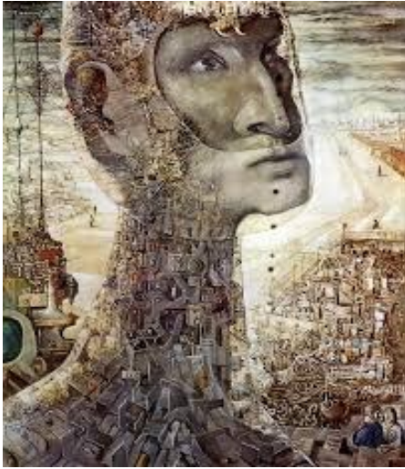
شكل رقم (٤)

لوحة "معركة بورسعيد" المتحف الفني الحديث بالقاهرة ٢١٥ × ١٨٥ سم - زيت على توال ١٩٥٧