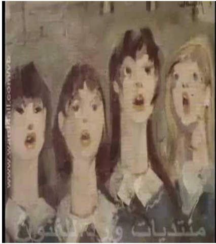
شكل رقم (٦)

لوحة "سنمضى سوياً الى المعركة" مجموعة معهد آدم وانلى ٦٥ × ٥٤ سم - زيت على سلوتكس ١٩٥٦