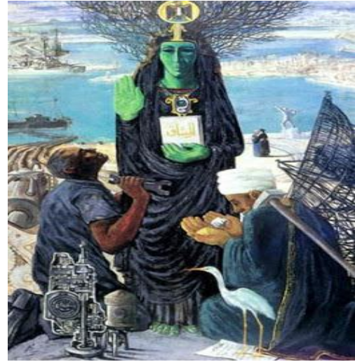
شكل رقم (٣)

لوحة "السد العالي" المتحف الفني الحديث بالقاهرة ١٠٠ × ٩٠ سم - زيت على سلوتكس ١٩٦٤