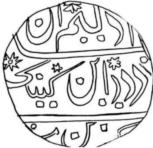
Horizon Auction, Auction1, 2 October 2016, Lot 107.