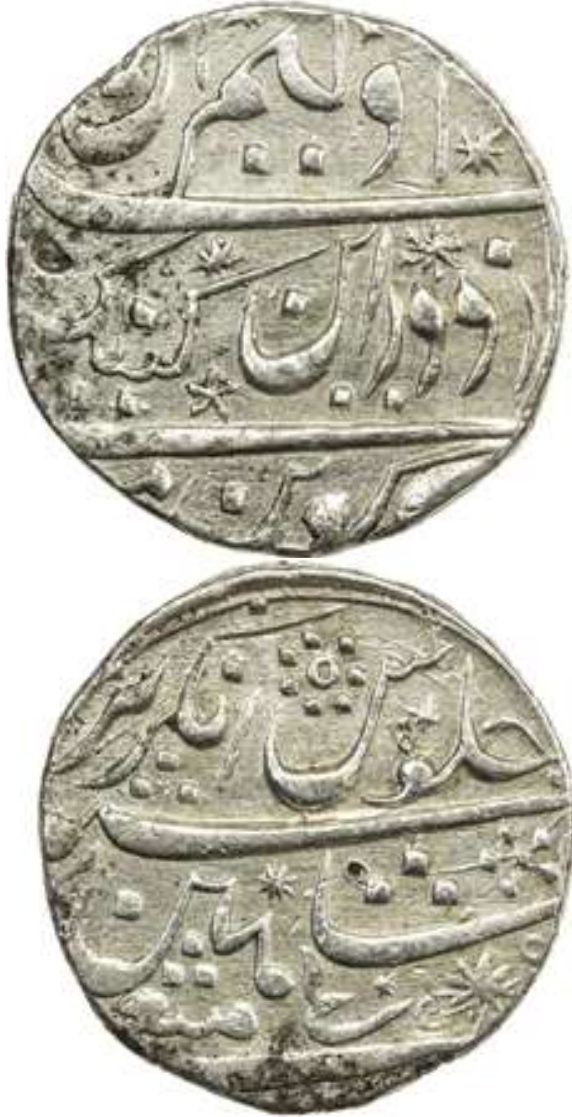
لوحة رقم: (2) روبية فضية، من إصدارات شركة الهند الشرقية عام (1104هـ/1692م)، دار ضرب بومباي، باسم الملكة ماري وملك ويليام، سنة الحكم الرابعة، الوزن 11,36 جرام، نقلا عن