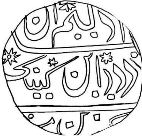
Bombay Auctions, Auction 1, 18 April 2014, Mumbai, P 58, Lot 472.