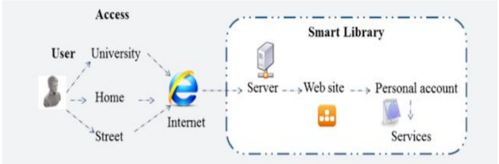
شكل رقم (1) للمكتبات الذكية بجامعة سيبيريا الفيدرالية

وظائفها فحسب بل أثر ذلك علي المنظمة ككل وبتطبيق الإنفتاح علي كل مستويات تطوير المنظمة ككل ( Kiviluoto, Johanna.2016 ) .