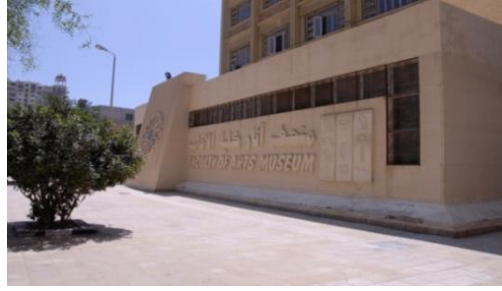
شكل (٢) متحف آثار كلية الآداب بجامعة الإسكندرية