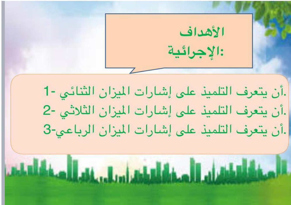
شكل (٤) شاشة توضح أهداف الدرس الأول.