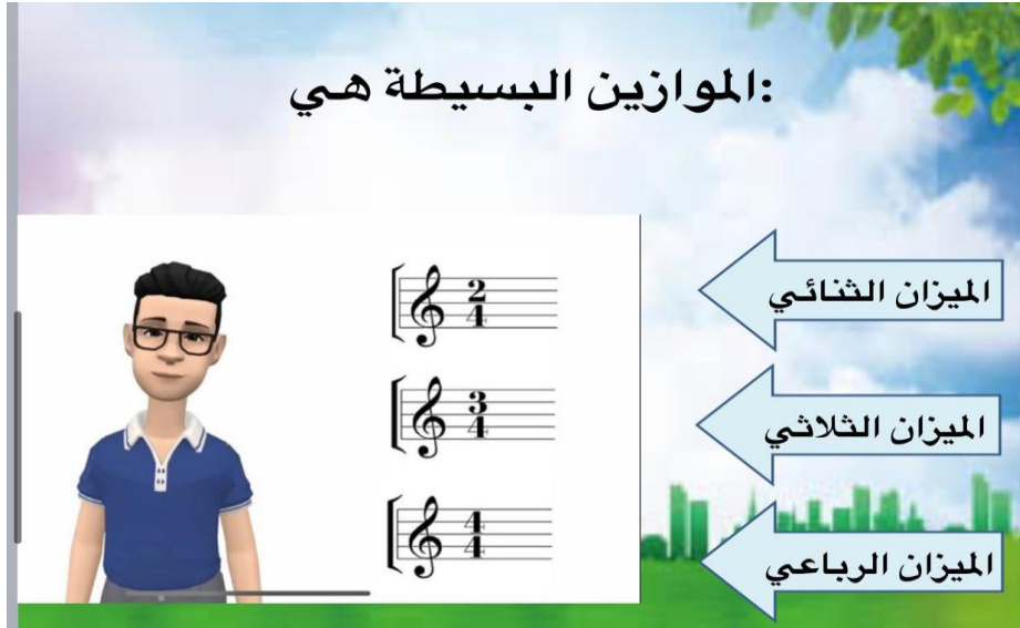
شكل (٧) شاشة توضح محتوى الدرس الأول.

٧- الأنشطة التعليمية: تشمل الحقيبة التعليمية على مجموعة من الأنشطة والبدايل التي تتيح للمتعلم فرصة اختيار النشاط الذي يناسبه.