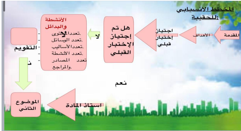
شكل (٣) شاشة توضح المخطط الإنسيابي للحقيبة.

٣- المخطط الانسيابي للحقيبة: وهو عبارة عن لوحة انسيابية (تتبعيه) توضح مسار التعلم الذي يتخذه المتعلم في أثناء دراسته للحقيبة التعليمية.