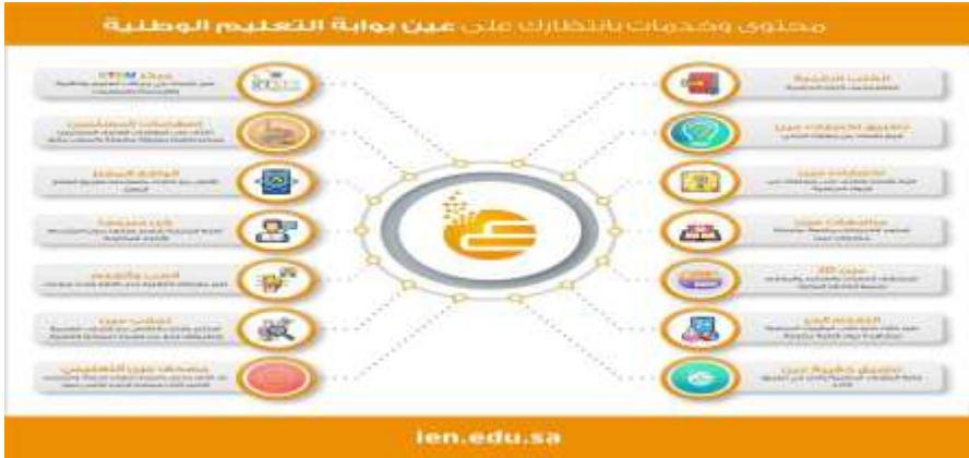
الصورة (٢) محتوى وخدمات بوابة التعليم الوطنية (عين)