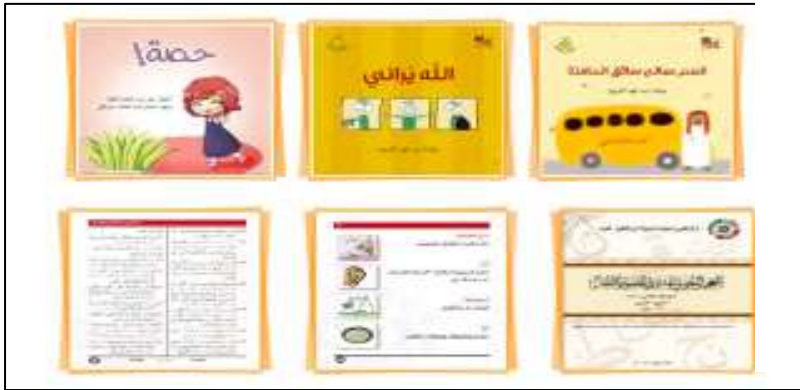
صورة (١١) من القصص التربوية والمعاجم اللغوية المدرسية المصورة

حرصاً على تأصيل اللغة لدى الطلاب وتنمية حصيلة المفردات، بما ينعكس على تنمية قدراتهم اللغوية، وبأساليب ممتعة، تم التعاون مع جهات عدة وإضافة مجموعة من القصص التربوية والمعاجم اللغوية المدرسية المصورة للبوابة كما في صورة رقم (١٠). ويرعى التعليم الحر المواهب الوطنية والأقلام الواعدة، حيث يعزز هذه الموهبة بنشر القصص المعتمدة.