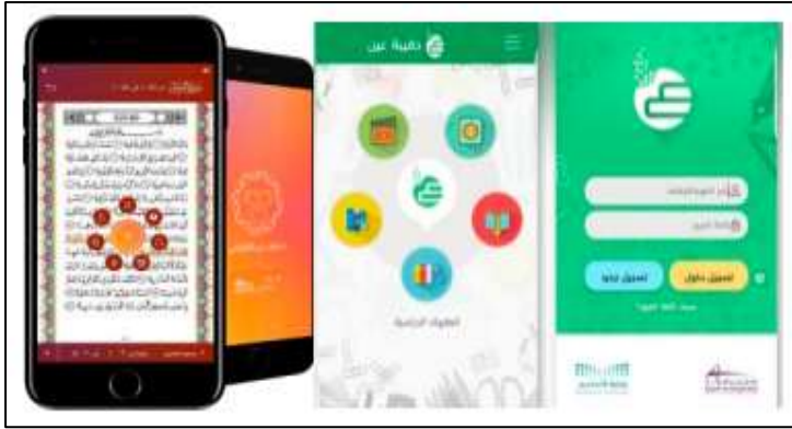
صورة (٧) واجهة تطبيق مصحف (عين) التعليمي

المستهدفون من هذا التطبيق (٥ مليون)، وعدد المقررات (١٥) مقرر، تشمل (١١٤) وهي سور القرآن الكريم، وأكثر من (٧٥) مهارة لغوية، وأكثر من (٢٠) إعجاز علمي.