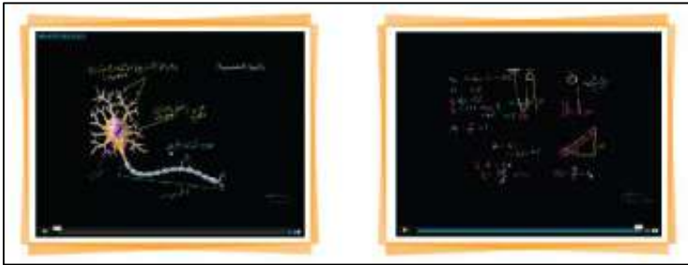
صورة (٩) فيديوهات التعلم الفردي في بوابة التعليم الوطنية (عين)

مجموعة من الفيديوهات التعليمية التي تهدف إلى شرح الدرس بشكل مباشر؛ ليكون موجهاً من المعلم للطالب؛ ليبي الفروق الفردية ويحقق التعلم الذاتي لدى المتعلم.