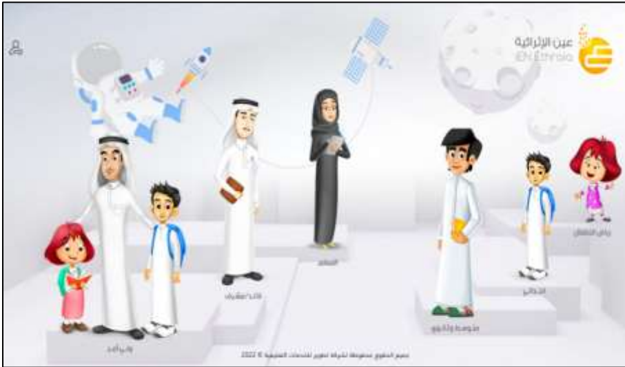
صورة (١) واجهة بوابة عين

وتوضح الصورة (١) واجهة بوابة (عين) التعليمية (عين بوابة التعليم الوطنية، ٢٠١٩).