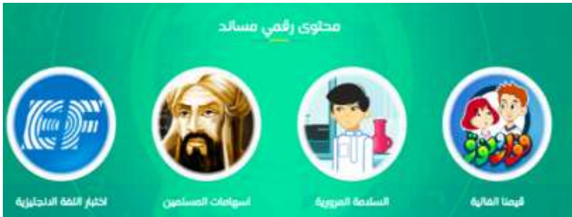
صورة (٦) محتوى رقمي مساند

لتعزيز القيم ودعم التعلم عن اسهامات العلماء المسلمين مرتبطة بالمنهج محتوى تعليمي يشرح الاسهامات العلمية التي قدمها المسلمون في العصور المختلفة، ويتناول حقبا زمنية متنوعة، تبدأ من عام (١٨٠) هجرية إلى عصرنا الحالي، وعلماء متعددين، وتم اختيارها بناءً على علاقتها بالمقررات الدراسية، ولتشمل علوم مختلفة في أكثر من ١٢ مجالاً، وذلك لتعزيز الإبداع وتشجيعاً للابتكار لدى الطلاب، ويقدم شرح الأثر بأكثر من استراتيجية تلبية التنوع لدى المتعلمين، وتراعي الفروق الفردية بين الطلاب، وقد تنوعت أساليب العرض في البوابة وتضمنت الفيديوهات المرئية والألعاب المشوقة، والتقويم الذاتي، والأنشطة المختلفة المطبقة حسب المراحل العمرية. حيث يشمل (٥٠) إسهام فيديو مرئي، (٥٠) لعبة، (٥٠) اختبار قصير، (١٠٠) تجربة كما في صورة (٦)