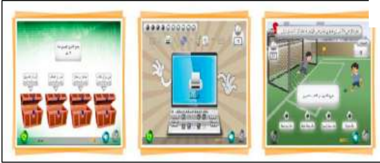
صورة (٨) الألعاب التعليمية في بوابة التعليم الوطنية (عين)

وهي مجموعة من الألعاب التعليمية الشيقة والمتنوعة، التي تهدف لإثارة اهتمام المتعلم للبحث عن المعلومة والاستمتاع بالتعلم.