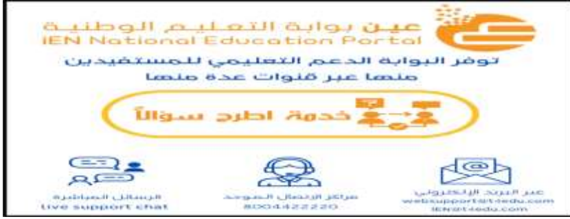
شكل (٣) الدعم التعليمي والتقني لبوابة التعليم الوطنية (عين)