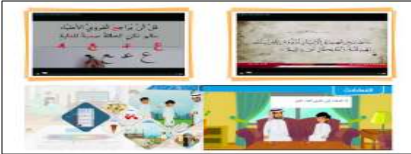
صورة (١٠) فديوهات شاهد وتعلم