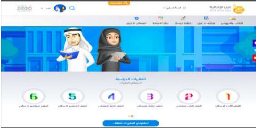
صورة (١٢) واجهة بوابة المعلم

تقدم بوابة التعليم الوطنية ( عين ) خدمات رقمية وأدوات تعليمية متنوعة وخاصة للمعلم، تساعد على نمو المعلم وتطويره المهني ، ومن هذه الخدمات ما يأتي :