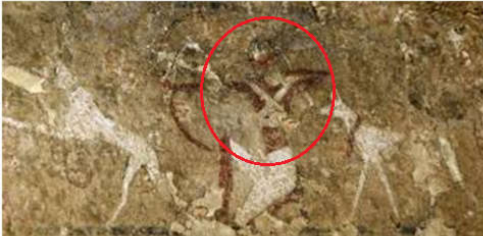
صورة رقم ٢ و صورة رقم ٣ : تمثّلان الشريطان المتقاطعان على الرسوم الصخرية بالتاسيلي Maitre(J.P),contribution a la prehistoire de l'ahaggar , Alger : CRAPE .1971,p123.