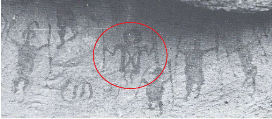
الصورة رقم ٢

ولقد حافظ التوارق على هذه القطعة ليومنا هذا ، و تسمى بالتمحاق ( لغة التخاطب عند التوارق )ب"المجدودن" وهو نفسه المعروف في المصرية القديمة باسم "الشت" الذي كان يرتديه الليبي القديم في مصر ٣ . ، ثم أطلق عليه المستكشفون والضباط الفرنسيون في القرن التاسع عشر اسم "أشرطة النبلاء" ٤ ، والتزم التوارق بارتدائه في مناسبات منها حفل السببية لأنه يمثل القيمة العسكرية للشخص.