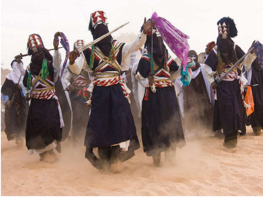
صورة رقم ١ ، الراقص الترقى و على صدره المجدودن