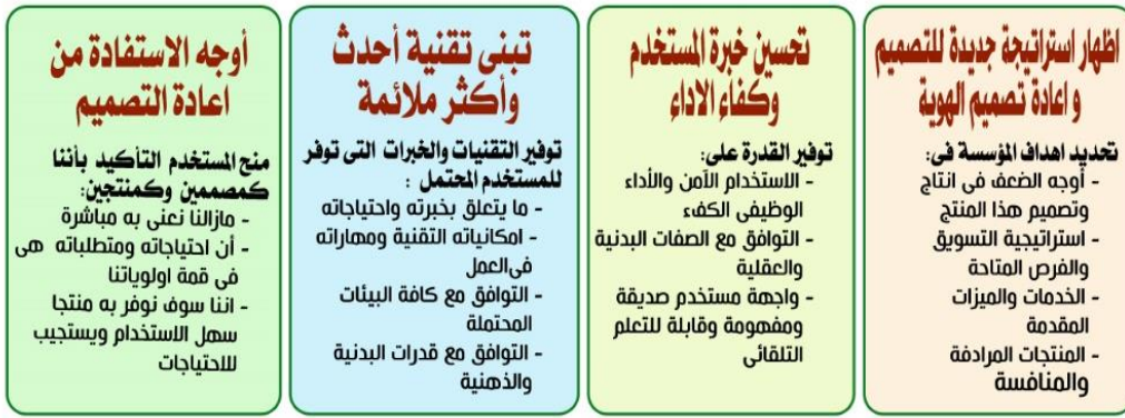
شكل (2) ماذا يمكن الاستفادة من إعادة التصميم

المنتج - من ترقية ميزة واحدة إلى تجديد الحل بالكامل. التغيير ليس حدثاً. إنها عملية. من وجهة نظر الأعمال، يجب أن تهدف إلى جعلها مرنة وسريعة التبني. سيكون نموذج عملية إعادة التصميم المزوج الماسي مناسباً تماماً: