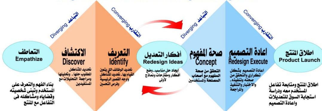
المخطط (2) نموذج دمج عمليتي الماسية المزدوجة والتفكير التصميمي في اعادة تصميم المنتجات