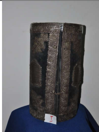
لوحة رقم (٧) تمثل شكل الصندوق الخشبي المغطى بالقطيفة الزرقاء الباهتة، لم يسبق نشرها.