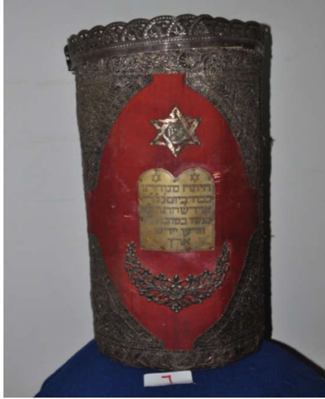
لوحة رقم (١٣) تمثل الصندوق الخشبي المغطى بالقטיפه الحمراء من الجانب وتظهر فيه شكل النجمة السداسية ، لم يسبق نشرها.