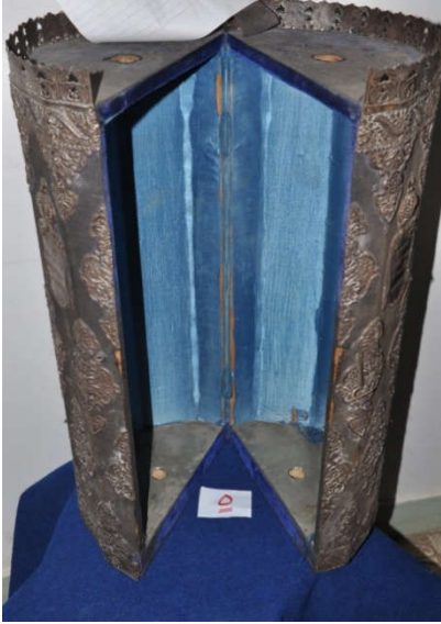
لوحة رقم (١٢) تمثل الصندوق الخشبي المغطى بالقطيفة ذات اللون الأزرق الداكن من الداخل ، لم يسبق نشرها.