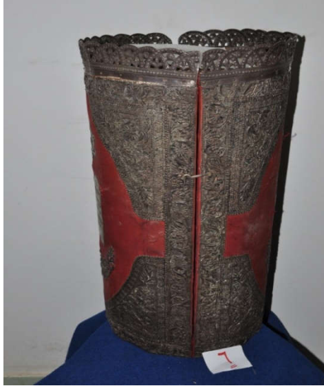
لوحة رقم (١٤) تمثل الصندوق الخشبي المغطى بالقטיפه الحمراء من الأمام ، لم يسبق نشرها.