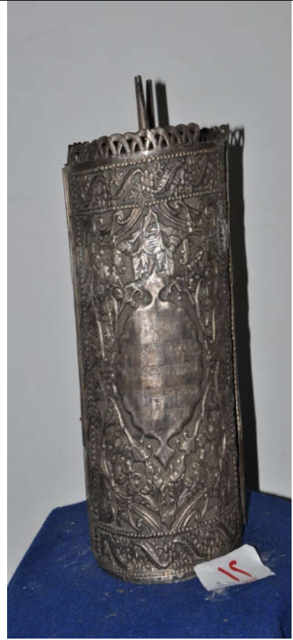
لوحة رقم (٢٥) تمثل الصندوق الخشبي المغطى بالكامل بصفائح الفضة من الجانب ، لم يسبق نشرها.