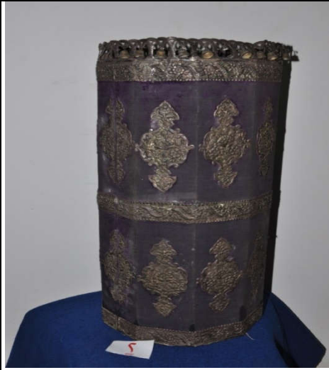
لوحة رقم (٦) تمثل شكل الصندوق الخشبي المغطى بالقطيفة البنفسجي من الخلف ، لم يسبق نشرها.