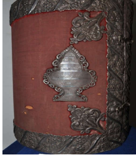
لوحة رقم (٩) تمثل الصندوق الخشبي المغطى بالقطيفة النبيتي من الجانب الأيمن ، لم يسبق نشرها.