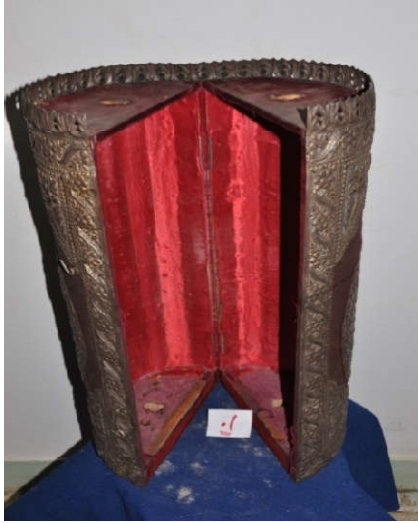
لوحة رقم (٢٢) تمثل الصندوق الخشبي المغطى بالقطيفة الحمراء من الداخل ، لم يسبق نشرها.