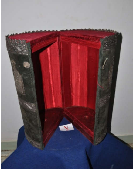
لوحة رقم (١٦) تمثل الصندوق الخشبي المغطى بالقטיפه ذات اللون الأخضر الزيتوني من الداخل، لم يسبق نشرها.