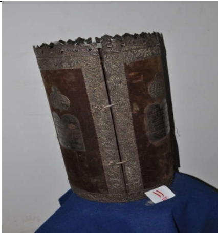
لوحة رقم (٢٤) تمثل الصندوق الخشبي المغطى بالقطيفة البنية اللون من الأمام ويظهر فيه شكل التاج ، لم يسبق نشرها.