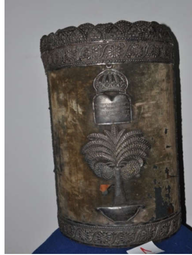
لوحة رقم (١٧) تمثل الصندوق الخشبي المغطى بالقطيفة ذات اللون الأخضر الزيتوني الداكن من الجانب الأيمن وتظهر فيه شكل شجرة الحياة ، لم يسبق نشرها.