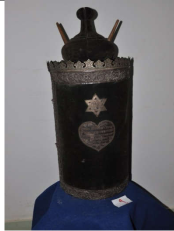
لوحة رقم (١٩) تمثل الصندوق الخشبي المغطى بالقطيفة ذات اللون الأخضر الزيتوني يعلوه الشكل الكمثرى ويظهر على الجانب الأيمن النجمة السداسية الشكل ، لم يسبق نشرها.