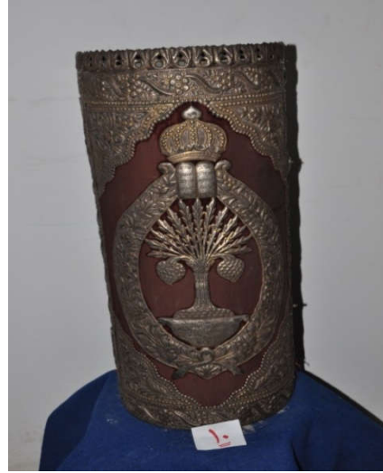
لوحة رقم (٢١) تمثل الصندوق الخشبي المغطى بالقطيفة الحمراء من الجانب الأيمن وتظهر فيه شجرة الحياة أعلاها التاج ، لم يسبق نشرها.