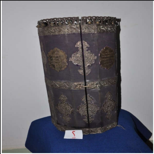
لوحة رقم (٥) تمثل شكل الصندوق الخشبي المغطى بالقطيفة البنفسجي من الأمام ، لم يسبق نشرها.