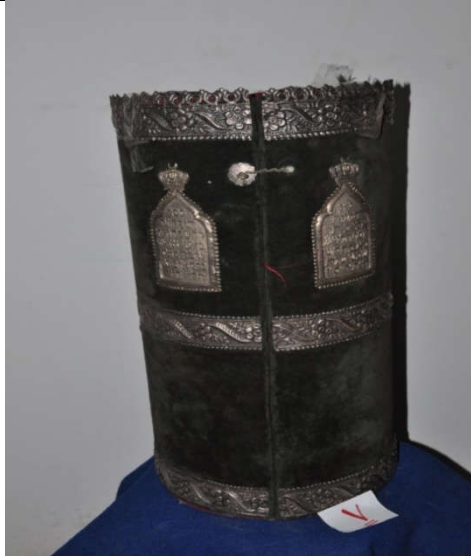
لوحة رقم (١٥) تمثل الصندوق الخشبي المغطى بالقטיפه ذات اللون الأخضر الزيتوني ويظهر فيه شكل التاج من الأمام، لم يسبق نشرها.