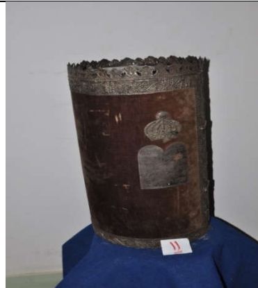
لوحة رقم (٢٣) تمثل الصندوق الخشبي المغطى بالقطيفة البنية اللون من الجانب ويظهر فيه شكل التاج ، لم يسبق نشرها.