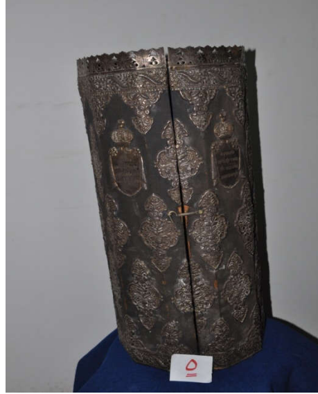
لوحة رقم (١١) تمثل الصندوق الخشبي المغطى بالقطيفة ذات اللون الأزرق الداكن من الأمام ، لم يسبق نشرها.