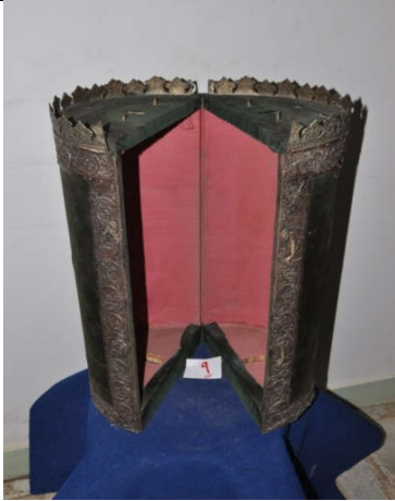
لوحة رقم (٢٠) تمثل الصندوق الخشبي المغطى بالقطيفة ذات اللون الأخضر الزيتوني من الداخل ، لم يسبق نشرها.