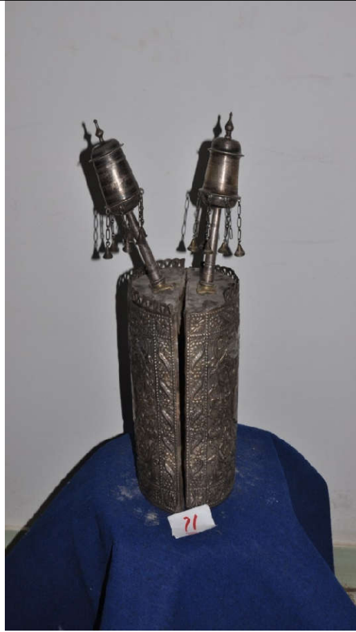
لوحة رقم (٢٦) تمثل الصندوق الخشبي المغطى بالكامل بصفائح الفضة ومعلق عليه الأجراس ، لم يسبق نشرها.