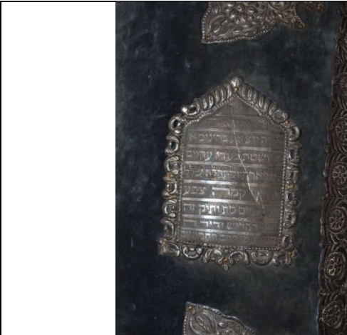
لوحة رقم (٨) توضح الكتابات التي تزين الصندوق الخشبي المغطى بالقطيفة الزرقاء الباهتة، لم يسبق نشرها.