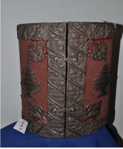
لوحة رقم (١٠) تمثل الصندوق الخشبي المغطى بالقطيفة النبيتي من الأمام ، لم يسبق نشرها.