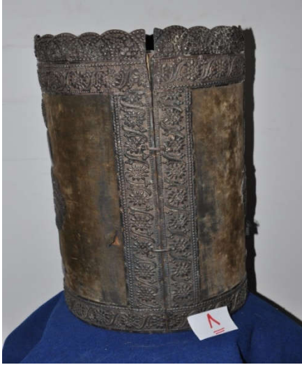
لوحة رقم (١٨) تمثل الصندوق الخشبي المغطى بالقطيفة ذات اللون الأخضر الزيتوني الداكن من الأمام ، لم يسبق نشرها.