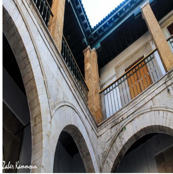
صورة رقم (٣)

اقواس المدرسة الشماعية - منشور على الموقع