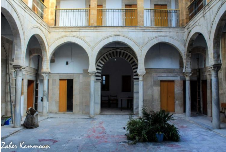
صورة رقم (٢)

للطابق السفلي للمدرسة الشماعية – منشور على الموقع