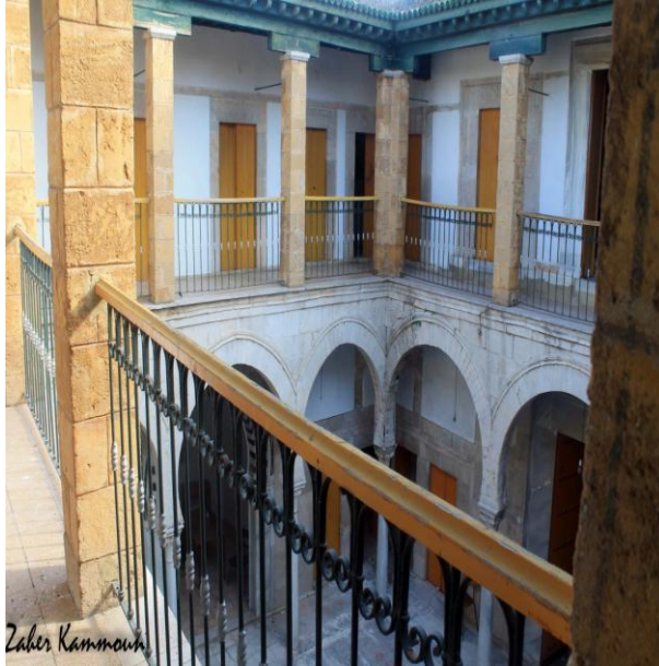
صورة رقم (٤)