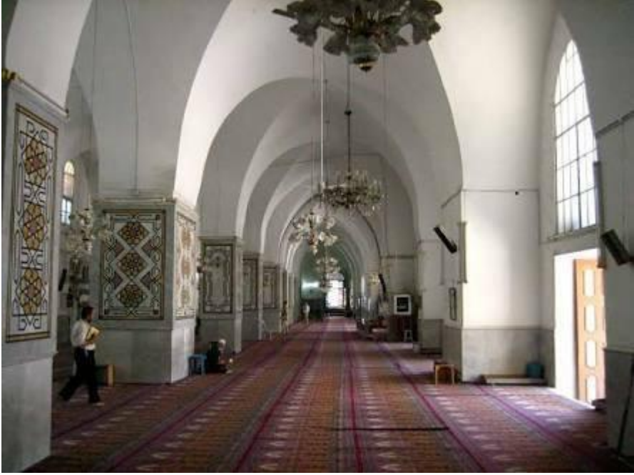
المُصلى الشتوي في الجامع النوري