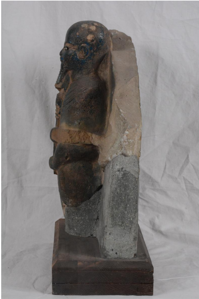
Fig.1(d): Fragment einer Gruppenstatue des Gottes Ptah TR 2.2.19.2- CG 38465bis