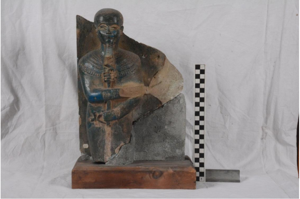
Fig.1(a) : Fragment einer Gruppenstatue des Gottes Ptah TR 2.2.19.2- CG 38465bis

Spitze. Die Oberlippe des Mundes verläuft waagrecht, die Unterlippe ist bogenförmig.