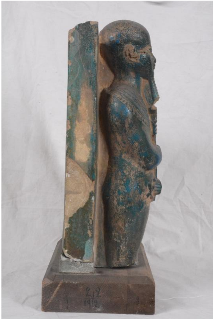
Fig.1(c): Fragment einer Gruppenstatue des Gottes Ptah TR 2.2.19.2- CG 38465bis