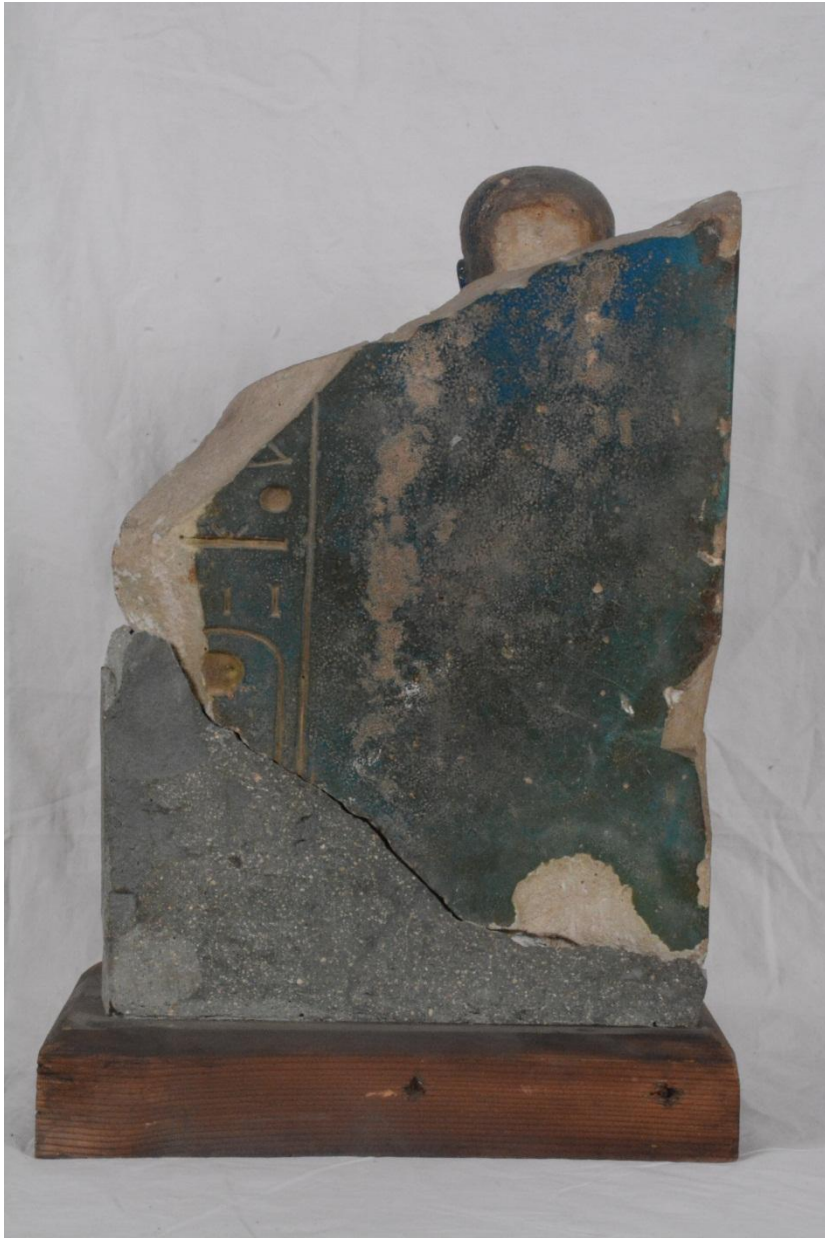
Fig.1(b): Fragment einer Gruppenstatue des Gottes Ptah TR 2.2.19.2- CG 38465bis