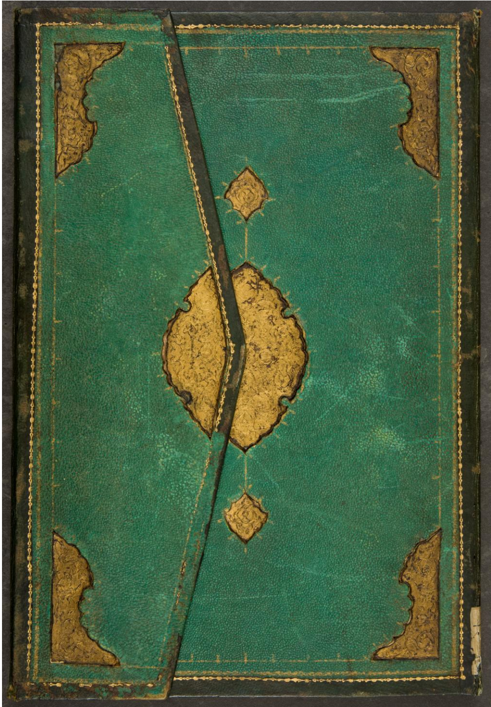
صورة ١ : غلاف المخطوط من الخارج