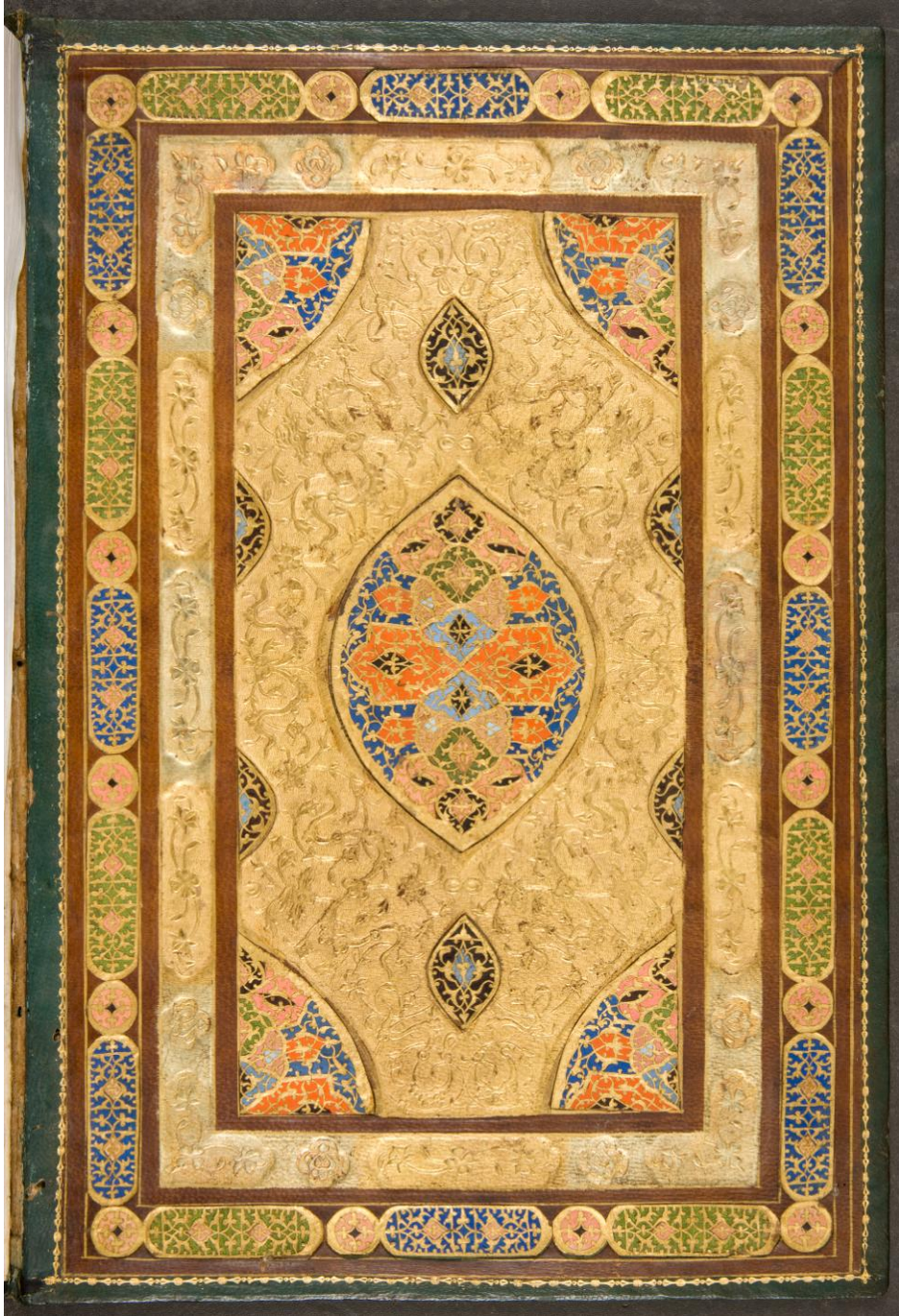
صورة ٢ : غلاف المخطوط من الداخل