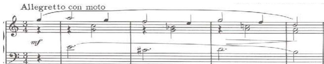
شكل رقم ( )