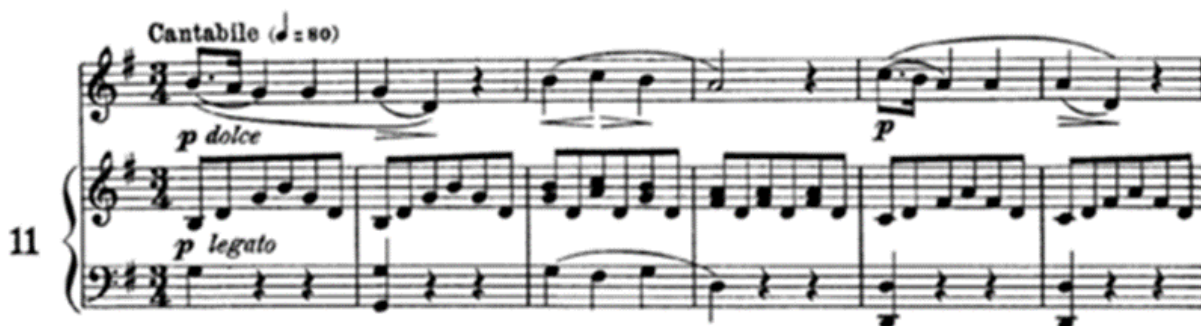
شكل رقم ( ) مثال من كتاب concor لتعلم العزف

Concorte — Fifty Lessons for High Voice, Op. 9 — Part 1