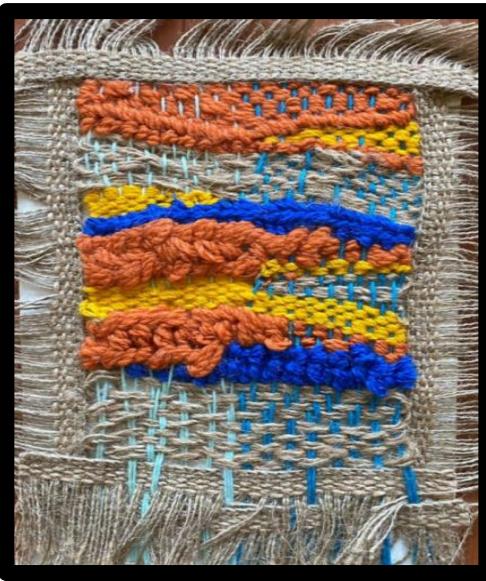
العمل النسجي رقم (٥)