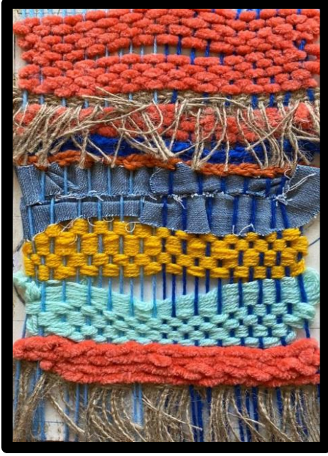
العمل النسجي رقم (٤)