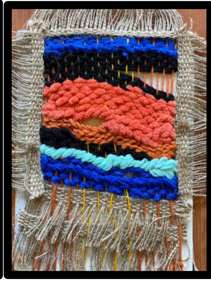
العمل النسجي رقم (٧)