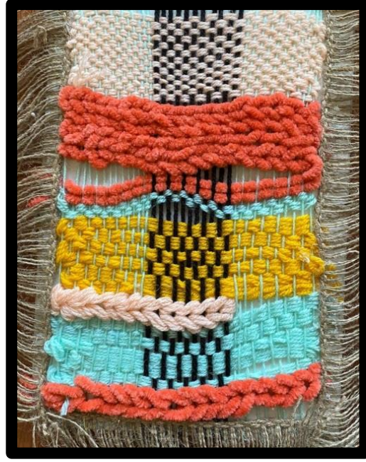
العمل النسجي رقم (٣)