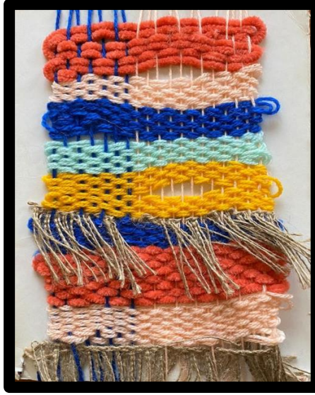
العمل النسجي رقم (٨)