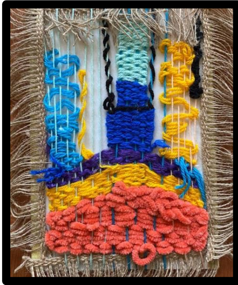
العمل النسجي رقم (٢)