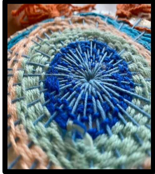
العمل النسجي رقم (١)