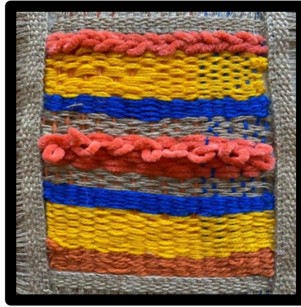
العمل النسجي رقم (٩)