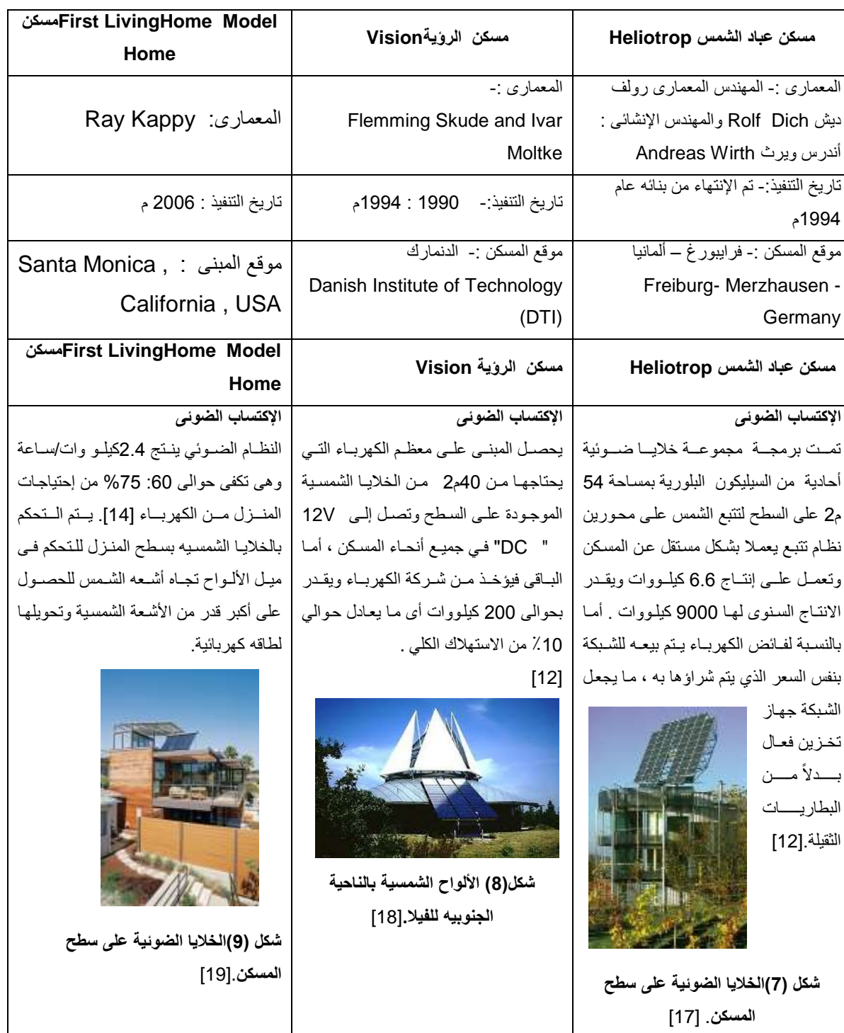
جدول ( 1 ) يوضح بعض الامثلة لمباني سكنية تحتوى على نظام الطاقة الشمسية