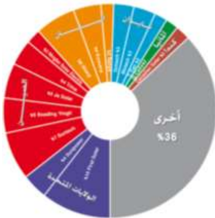
شكل (2) يوضح أكبر شركات إنتاج الخلايا الشمسية حسب جنسياتها وحصتها من السوق حسب تقرير العالمي الخاص بالطاقة المتجددة والصادر REN21 عام 2010 (المستقبل، 2011، صفحة 17).

28% منذ عام 2005، ما وضعها في مصاف الدول الرائدة في مجال تطوير الشبكة الكهربائية الذكية (Smart Grid). أكثر من 100 دولة أقرت، مؤخراً، استراتيجيات محلية تفرض الاعتماد على خيار الطاقة المتجددة، مقارنة بعام 2005، حين لم تكن سوى 55 دولة قد أقرت مثل هذه السياسات، أسهم ذلك في انخفاض تكلفة صناعة تلك المواد والمعدات والتي نتج عنه انخفاض تكلفة إنتاج الطاقة المتجددة وانتشار استخدامها على نحو أوسع كما بالشكل رقم (2). [13]