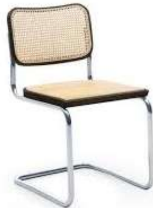
مقعد سيسكا للمصمم "مارسيل بروير" من رواد مدرسة الباوهاوس عام 1929 عبارة عن مواسير من النيكل والقاعدة والظهر من الكانيه