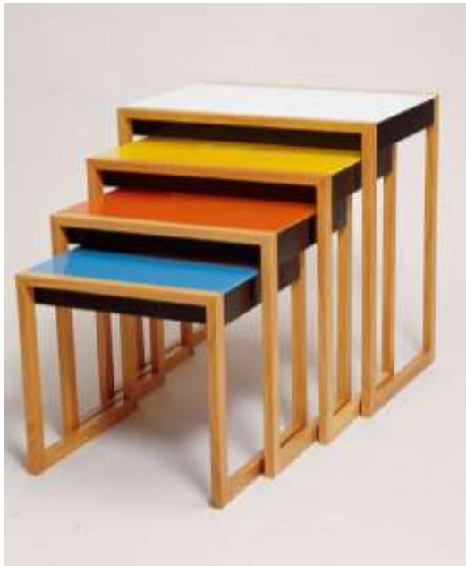
مجموعة مناخذ تمثل العصر الحديث بنفس المقاسات ونفس الفكر مع اختلاف الخامات والألوان حيث أنها مصنعة من الأخشاب الطبيعية والقرصة من الأخشاب المصنعة المطلية بالألوان الزاهية.