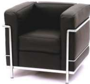
الفتيل المربع للمصمم "لوكوربوزيه" 1928