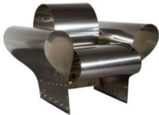
كرسي للمصمم رون اراد يظهر فيه استخدام خامة المعدن من أهم خامات التكنولوجيا المتقدمة