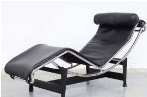
شيزلونج للمصمم "لوكوربوزيه" 1928