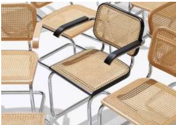
مقعد يمثل العصر الحديث بنفس المقاسات ونفس الفكر عبارة عن مواسير من النيكل والقاعدة والظهر من الكانيه