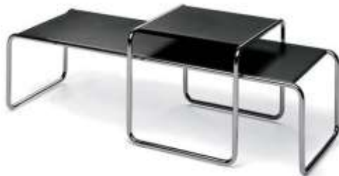
مناضد مختلفة المقاسات 1929م استخدام (مارسيل بروير) المواسير الصلب مع الجلد والخشب فى تصميم الأثاث (مدرسة الباوهاوس)

وكان آخر من ترأس مدرسة الباوهاوس المعماري "ميس فان دروه" لمدة عامين الى أن استولى هتلر على الحكم فى ألمانيا فاستقال ميس فان دروه وأغلقت المدرسة بعدها بأشهر قليلة.