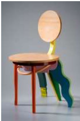
كرسي للمصمم جارى نوكس بينيت (Garry Knox Bennet) عام 2006 يظهر فيه استخدام الألوان البراقة المبهجة واستخدام الخامات المختلفة مثل المعادن بشتى أشكالها من أهم خامات التكنولوجيا المتقدمة

ومن أهم مقومات التكنولوجيا المتقدمة : الشفافية والحركة ،اللمعان والألوان البراقة المبهجة، واستخدام الخامات المختلفة مثل المعادن بشتى أشكالها.