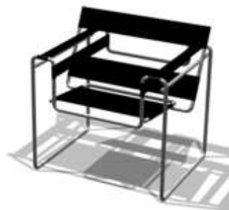
مقعد فاسيلي 1926 م

استخدام (مارسيل بروير) المواسير الصلب مع الجلد والخشب فى تصميم الأثاث (مدرسة الباوهاوس)