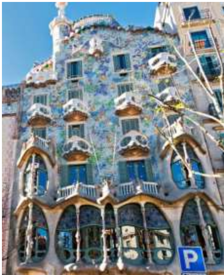
منزل كازا باتلو للمعماري جاودى 1877 (أرت نوفو)

تبنى مصممو الأرت نوفو الخط المنحني غير المتناظر الذي يعطي للأشكال ثنائية الابعاد الرشيقية والمتموجة احساسا بالحركة الديناميكية الشاملة لكل من الاثاث وأوراق تغليف الجدران والاعمال الحديدية وحتى تصاميم الزجاج الملون وذلك يشير الى خصائص الهيئة لعناصر التصميم الداخلي والتي ظهرت على صعيد الأثاث والتفاصيل الداخلية . (7) ونتيجة لذلك توجه مصممو التيار الى الطبيعة ، لحاجتهم الى الأشكال المعبرة عن النمو ووجدوا فى أشكال النباتات، وخاصة سيفان الأشجار واغصانها أستعارة مناسبة (1)