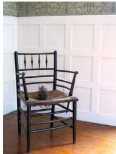
تصميم غرفة الطعام فى منزل Red House للمصمم وليم موريس و فيليب ويب (مذهب الاختزالية)

كان Red House هو المنزل الذي صممه وليم موريس في Bexleyheath وهي ضاحية جنوب شرق لندن إنجلترا ، لعائلته بمساعدة Philb Webb. أراد موريس أن يكون المنزل مكاناً يعكس مُثله والحرف اليدوية والمجتمع. تعاون كل من Webb و Morris في دمج تصميم العمارة والتصميم الداخلي في وحدة واحدة. كان أول منزل تم بناؤه وفقاً لمبادئ الفن الرفيع التي أصبحت السمة المميزة لشركة التصميم التي أسسها موريس مع Webb عام 1861. صمم موريس وويب المنزل على الطراز القوطي المبسط.