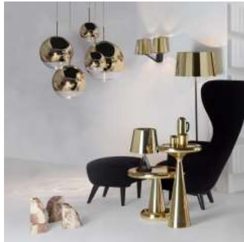
تصميمات لوحدات اضاءة للمصمم توم ديكسون الحدائثة المتأخرة