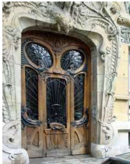
منزل فى باريس للمعماري جول لافروت 1901(أرت نوفو)