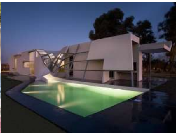
تصميمات لمباني سكنية للمعماري "تشارلز غواثمي" الحدائثة المتأخرة