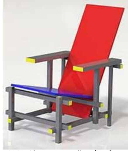
كرسى أحمر أزرق للمصمم جريت رينفيلد 1918م حركة (الديستيل)