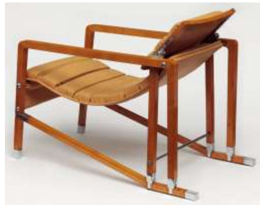
كرسي بذراعين تصميم ايلين جراى ، قبل عام 1929 (آرت ديكو).