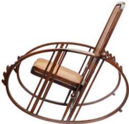
كرسى هزاز "جوزيف هوفمان" (أرت نوفو)

من أهم مصممي الأرت نوفو (جوزيف هوفمان) الذي درس الهندسة المعمارية في أكاديمية الفنون الجميلة في فيينا بالنمسا في إطار دراسته لفن الأرت نوفو