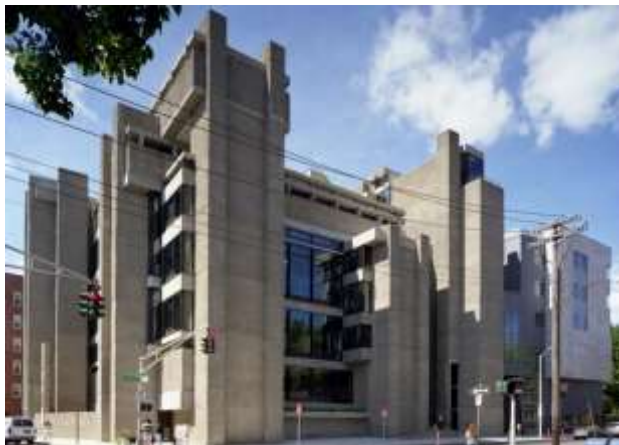
يضم مبنى Art & Architecture الذي أعيدت تسميته ( Rudolph Hall ) في عام 2008 (مدرسة Yale للعمارة وشقق سكنية) وهو واحد من أشهر أعمال المعماري (مارفين رودولف)(مذهب الوحشية)

وجميع هذه الاتجاهات لم تعود الى الكلاسيكيات والزخارف بل سعت الى تصميمات حديثة تبعاً للاتجاه الفكرى للمصمم.