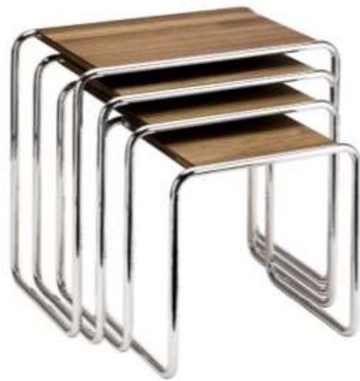
مجموعة مناخذ للمصمم "مارسيل بروير" من رواد مدرسة الباوهاوس عبارة عن مواسير من النيكل والقرصة من الخشب الرقائقى المطفى بالورنيش صنعت من خلال شركة "ستاندموبل" عام 1929م.