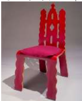
كرسي إحياء الطراز القوطي

كرسي الملكة أن تصميم "روبرت فينتورى" طباعة بواسطة ( Paola Navone) استغرقت خمس سنوات ونصف حتى يتم صقلها من المقدمة ، فإن المظهر الجانبي يعرض شرائح رقيقة من الخشب الرقائقي تذكرنا بقطع الأثاث التي تعود إلى القرن العشرين مثل أثاث "مارسيل بروير"