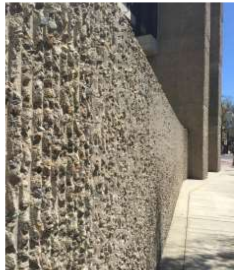
الوجه الخرساني لمبنى الهندسة المعمارية لجامعة (بول رودولف)