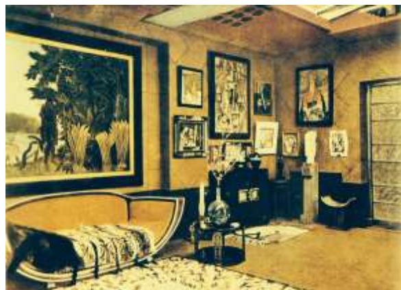
تصميم "ايلين جراى" (آرت ديكو)