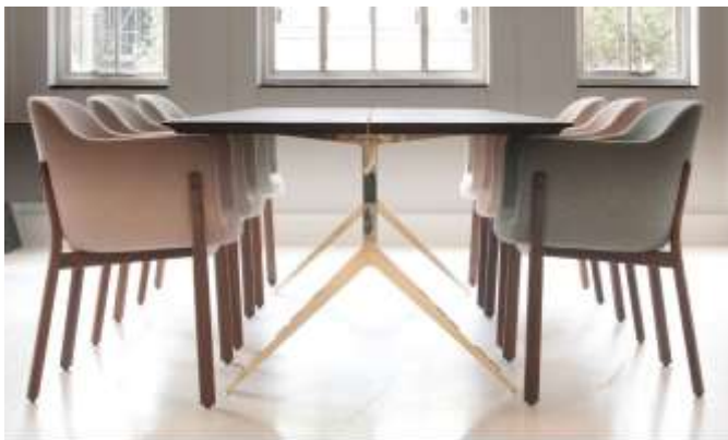
تصميم لمنضدة طعام للمصمم ماثيو هيلتون الحدائثة المتأخرة

والمعماري تشارلز غواثمي (19 يونيو 1938 - 3 أغسطس 2009) مهندساً معمارياً أمريكياً. كان مديرًا لشركة Gwathmey Siegel & Associates Architects ، شغل غواثمي منصب رئيس مجلس الأمناء في معهد الهندسة المعمارية والدراسات الحضرية وانتخب زميلا في المعهد الأمريكي للمهندسين المعماريين في عام 1981. ماثيو هيلتون