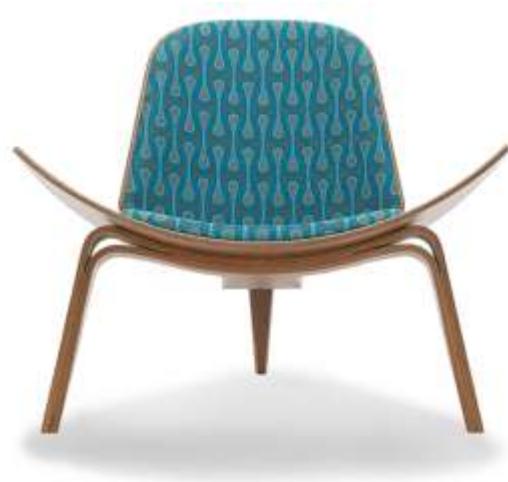
كرسى للمصمم "جوزيف هوفمان" (أرت نوفو)