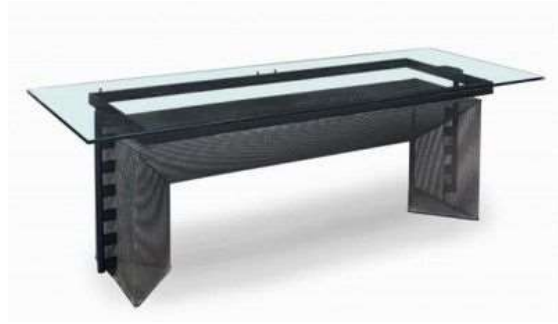
منضدة تيسي للمصمم ماريو بوتا (Mario Butte) عام 1985