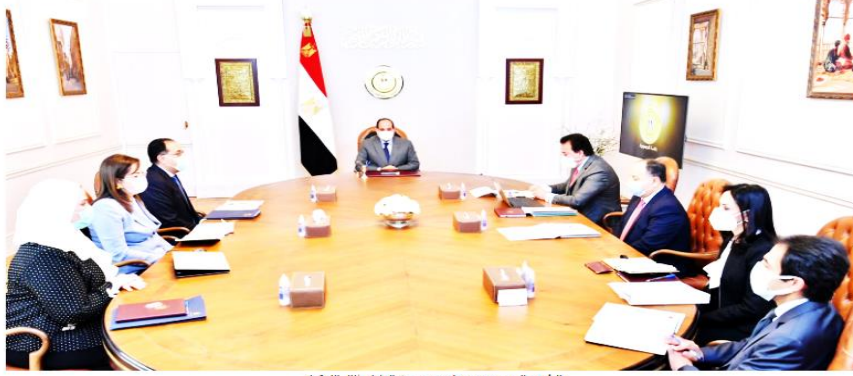
الرئيس السيسي ومدبولي وعدد من الوزراء خلال الاجتماع

• في متن الخبر: (وقد وجه الرئيس في هذا الإطار بتعزيز ودعم دور الجمعيات الأهلية وآليات التنسيق بينها وبين منظومة الرائدات نظراً لمردودها وأهميتها، وكذلك تشكيل مجموعات عمل متخصصة لدراسة كافة المشكلات المجتمعية الشائعة التي يكتشفها خلال عملهن على أرض الواقع لبلورة أفضل السبل لتدخل الدولة لتقديم الحلول المناسبة لها، مع تدقيق قواعد البيانات في هذا الصدد، وكذلك تقديم الدعم الأكاديمي لهذه الجهود من خلال الجامعات المتواجدة في النطاق الجغرافي لعمل مجموعات الرائدات، وذلك بالتنسيق والتناغم مع مبادرات الدولة في هذا الإطار مثل "تنمية الأسرة المصرية" و"حياة كريمة".