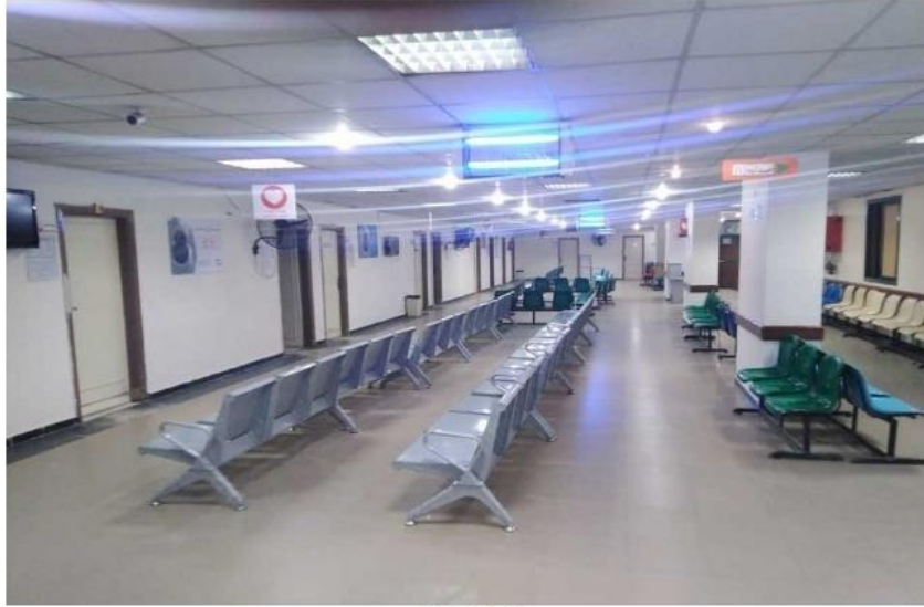
تأمين صحي الغربية