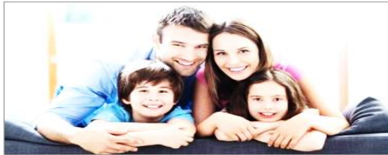
أسرة - أرشفة