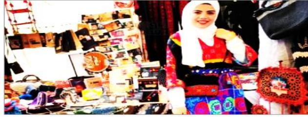
بنات من أرض الفيروز