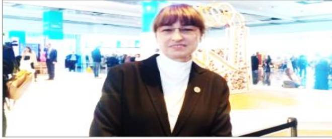
الينا بانوفا منسقة الأمم المتحدة فى يوم المرأة العالمى