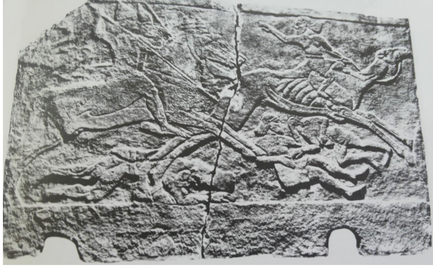
(شكل ٤) أحد العرب يطارده الآشوريون وقد أصيب بعيره- قصر تيجلات بلسير في نمروذ، نقلًا

عن Nadali , D . Assyrian Open Field Battles ,in Studies an war in Ancient Near East,fig.6