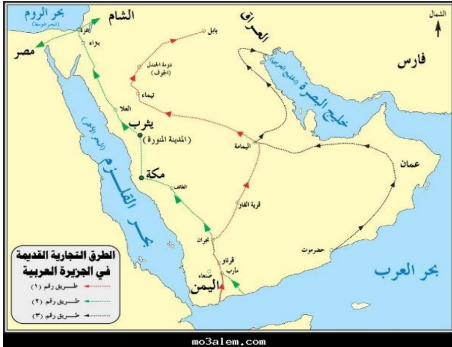
(خريطة ١) أهم الطرق البرية في شبه الجزيرة العربية ، نقلًا عن :