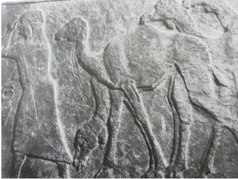
(شكل ٢) أسيرة عربية ، ربما الأميرة شمس في نقش من عهد الملك تيجلات بليسر الثالث نقلًا عن:

Reade, J . E . Assyrian Illustration of Arabs, in Arabia and its Neighbors, fig,2