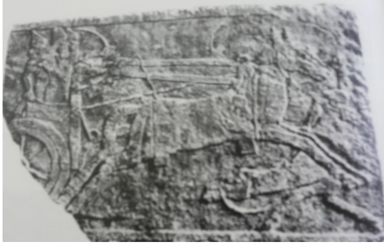
(شكل ٣) نقش يمثل الملك تيجلات بليسر الثالث فوق العجلة الحربية يسحق أعدائه - نمرود

Reade, J . E . Assyrian Illustration of Arabs, in Arabia and its Neighbors, fig,2