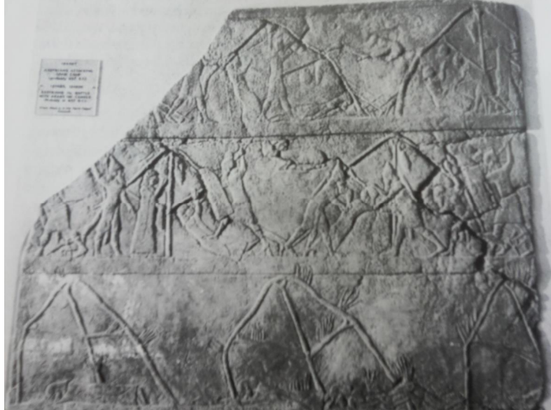
(شكل ٧) معسكر العرب يهاجمه الآشوريين - نقش من القصر الشمالي للملك آشور بانيبال ، نقلا عن :

Nadali , D . Assyrian Open Field Battles ,in Studies an war in Ancient Near East,fig.19