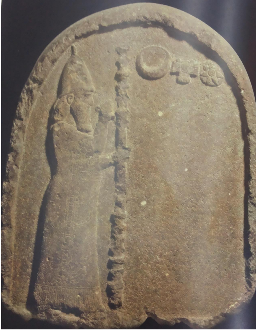
( شكل ٨ ) لوحة عثر عليها في تيماء تمثل الملك البابلي نابونيد متعبداً إلى رموز القمر والشمس

والزهرة André – Salvini , B . Babylone , p. 187,pl.108