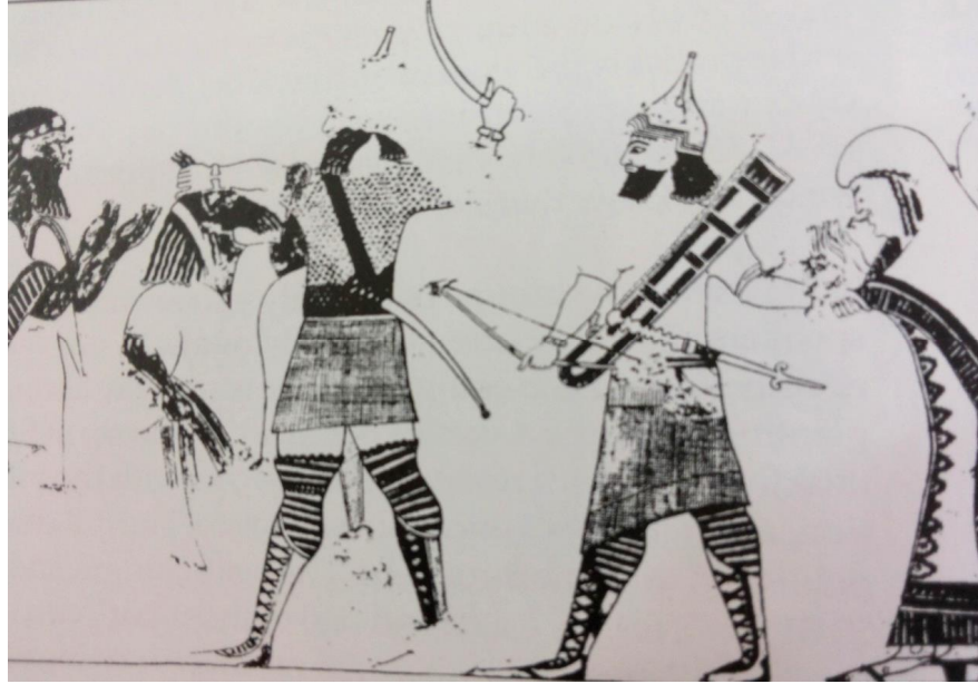
(شكل ٥) جندي يجر سيدة - ربما أميرة عربية - في قسوة غير مسبوقه في معاملة الأسيرات

عن Nadali , D . Assyrian Open Field Battles ,in Studies an war in Ancient Near East,fig.6