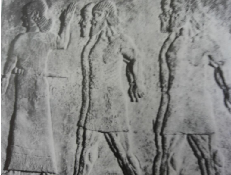
(شكل ١) أسرى عرب في نقش من عهد الملك تيجلات بليسر الثالث نقلًا عن

Reade, J. E . Assyrian Illustration of Arabs, in Arabia and its Neighbors, fig,1