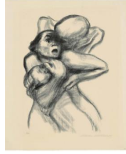
شكل (17) أم وطفل من مجموعة الموت، كاتيا كلودز ، ليثوجراف ،