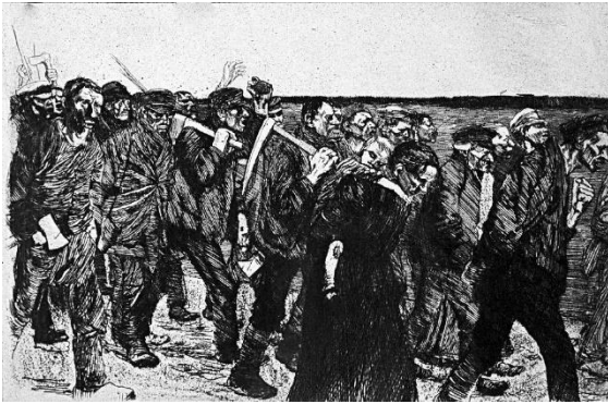
شكل (16) مسيرة الفلاحين من مجموعة حرب الفلاحين "لوحة 4" ، كاتيا كلودز ، حفر حمضي غانر ، 241×297ملم ، 1897 ، متحف برلين بألمانيا

أما لوحة "الموت" شكل (17) حفر على حجر - ليثوجراف – فقد مثلت كاتيا مثلث الموت بالهيكل العظمي الذي يحتضن ذلك الطفل البرئ من الخلف ، وقد يكون المقصود بالموت هنا الحرب أو الجوع ، وقد خلقت جواً لخلق الرهبة والغموض لخدمة موضوع اللوحة الدرامي .