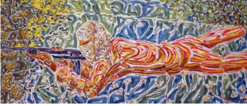
شكل (6) إنجي أفلاطون، تفصيلية من لوحة الجنود في ساحة المعركة، بتصوير زيتي على توال ، متحف الفن الحديث ، 1970