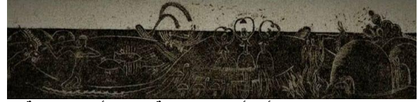
شكل (10) نحميا سعد ، أحد أعمال مجموعة "مصر أرض الرحالة"، المشاركة في "معرض باريس الدولي للفنون والتكنولوجيا"، حفر على الخشب عرضي المقطع.

أما الأداء التلخيصي الجريء الذي أتبعه في معالجة لوحاته وميله إلى تسطيح العناصر البصرية، وإظهارها على هيئة مساحاتٍ ظلّيةٍ تخترقها بعض من الخطوط بيضاء الرفيعة والتي يُظهر بها أشكاله ومفرداته إستطاع من خلالها أن يدمج الدلالات الرمزية لحقب مختلفة معاً في لوحه واحده متأثراً بالفنانين القدماء، وإعتمد عليها في أغلب تكويناته البانورامية، وإستطاع من بها تطوير أسلوبه ورؤيته خلال فترة وجيزة شكل (10).