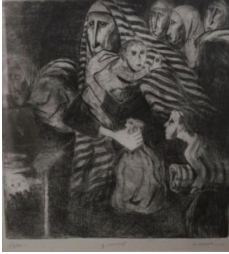
شكل (12) عبد الله جوهر ، تفصيلية من لوحة الهروب غير المقدر ، حفر وطباعه باستخدام الأحماض مع تأثير الألوان المائية ، 1975 ، 50×35 ، مقتنيات خاصة