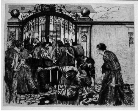
شكل (15) كاتيا كلودز ، مكافحة الشغب من مجموعة النساجون "لوحة 5" ، حفر حمضي غانر ، 241×304ملم ، 1879 ، متحف دالاس للفنون بأمریکا

(15) والتي رَوّت بعض من مشاهد الثورة الصناعية التي شهدتها البلاد واكتسحت أوروبا عام 1940م وموقف العمال النساجون اليائس وحياتهم التعيسة والتي كانت مهددة بأيدي وحشية ، ثم مجموعتها حرب الفلاحين شكل (16) والتي عبرت فيها عن الثورة العنيفة التي شهدتها عدة مقاطعات في ألمانيا الجنوبية والتي كانت من الفلاحين ضد طبقة النبلاء والكنيسة سنة 1525م ، والتي كان سببها المعاملة الغير إنسانية للفلاحين الذين كانوا عبيد للأرض بدون إمتلاك لتلك الفدادين ، فكان السادة الإقطاعيين يرغبون الفلاحين على تلك الخدمات الإجبارية مع فرض الضرائب المفرطة عليهم والتي تنهك قواهم .