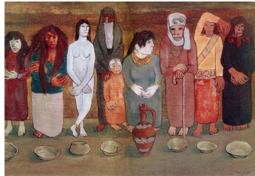
شكل (5) عيد الهادي الجزار ، الكورس الشعبي ، تصوير زيتي على خشب ، 1949

1948 في معرض لجماعة الفن المعاصر فتم مصادرتها ، فاللوحة تنتقد الموقف السياسي للنظام ،وقد تدخل كلاً من الفنانين محمد ناجي ومحمود سعيد فأفرج عنه ، وقد أعاد الجزار رسمها مرة أخرى عام 1951 بعد إختفاء اللوحة الأصليه لتوضع في متحف الفن الحديث بعد ثورة يوليو عام 1952 ولا تزال موجودة حتى الآن ، وتمثل اللوحة فئات الشعب المختلفة المنقبة والمحجبة والعارية وذات الشعر الأشعث يصطفون واقفين حُفاة القدمين بملابسهم البالية وبينهم رجال يرتدون ملابس النساء كدليل على ضعفهم وتفاوت أعمارهم وأمامهم أطباق فارغة كأنهم في إنتظار أحد يأتي ليضع الطعام في تلك الأطباق الفارغة كما يظهر على وجوههم البؤس والشقاء مستسلمين لقدرهم وتعكس اللوحة حالة الفقر والجوع التي وصل إليها المجتمع في ذلك الوقت فاللوحة تحمل إسقاطاً سياسياً دلالة على فساد الحكم ، أما الفنانة إنجي أفلاطون فقد إستلهمت أعمالها الفنية من واقع الطبقات المصرية الكادحة مثل الحرفين والعمال والجنود في ساحات المعركة وكان أغلب تركيزها على النساء أشكال (6 ، 7) .