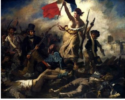
شكل (1) ديلاكروا ، تصوير زيتي ، الحرية ، 260×325 ، 1830 ، متحف اللوفر بباريس

ترجع الفنانين في سبعينات القرن العشرين عن الأسلوب التجريدي وكان ذلك تربة خصبة لفتح الباب لموضوعات تهتم بالتشخيص والمضمون ، فاتجه الفنانين إلي تناول القضايا السياسية والاجتماعية في أعمالهم الفنية ، فبدأوا يبحثون عن أساليب جديدة لتوصيل أفكارهم للجمهور تتناسب مع التقاليد الفنية الحديثة ، فمثلاً رسم ديلاكروا Eugène Delacroix (1798- 1863) لوحته الحرية شكل (1) والأسباني فرانشيسكو جويبا الذي كانت له سلسلة كاملة من الأعمال الجرافيكية التي تناول فيها كوارث الحرب ومأساة والتي كانت ضد الغزو الفرنسي لبلدة أسبانيا أشكال (2) ، (3) وبابلو بيكاسو ولوحته الجرنیکا 1937 شكل (4) والتي رُسمت بعد قصف الطيران النازي الألماني لقريّة جورنيكا في شمال إسبانيا فأصبحت لوحة الجورنيكا رمزاً عالمياً لتصوير وتجسيد أهوال الحروب ، وتجسد تلك اللوحة ثورة بيكاسو على الحيل الفنية وإستخدامه للألوان حيث إقتصرت إستخدامه فيها على اللونين الأسود والأبيض مع درجات متفاوتة من اللون الرمادي لإظهار بشاعة الحرب والقتل والدمار بمفهوماً فلسفياً ، وبرغم ذلك لم تسلم اللوحة من هجوم النقاد الذين إعتبروها مجرد إسكتشات لا تحمل قيمة فنية ، ويرى النقاد أن الثور رمزاً لوحشية النازية والحصان يرمز لبلده أسبانيا الجريحة التي تتألم من آثار العدوان، أما الرأس التي تصيح والزراع التي تحمل المصباح فيشيران إلى إستنارة الضمير البشري بعد تلك المأساة ، فهي لوحة تكعيبية مبنية على منهج هندسي رسمها بيكاسو في أعلى درجة من