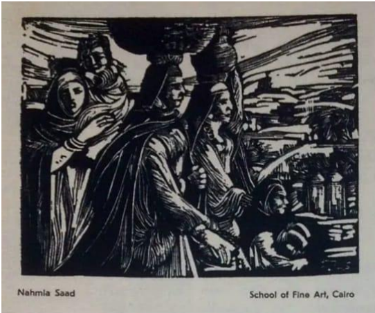
شكل (8) نحميا سعد ، العودة من الحقل، حفر على الخشب عرضي المقطع ، المقاس غير محدد.

Nahmia Saad (1912-1945) فنان مصري إمتازت لوحاته بقوة في التعبير وإحكام للتكوين وبرغم إلتحاقه بقسم التصوير الزيتي وتَمَرُّسِه فيه كتخصصٍ دقيقٍ ، ولكنه برز في فنون الحفر والطباعة ليذيع صيته في هذا المجال، بإعتباره حَقَّاراً ليصير أحد أهم رواد فن الجرافيك المصري، وسرعان ما تعلم على أيدي أستاذه الإنجليزي تشارلز برنارد رايس، فأبدع أعمال فاقته مستواه العُمري، وأهلته لتمثيل مصر في محافل دولية ، بعد سنواتٍ قليلة من بداية ممارسته ، فمثلاً شكل ( 8 ) تناول فيها نحميا موضوع عودة الفلاحات من الحقل بصحبة أطفالهن حاملات حصاد الأرض ولقد زَوَّج "نحميا" بين رسوخ العمل البنائي الذي يشبه الهرم وبين الليونة الخطية بالخلفية وقد لَخَّصَ بها المشهد القروي ، أما شكل (9) تناول في تلك اللوحة مجموعة من الجنود يحتفلون بالنصر ، فالطفل في أقصى يسار العمل المُسميًّا بكتابه الصغير يربطنا بفكرة نضال الطبقات بكافة فئاتها العُمريَّة وحين نننَّبه إلى تلك البنديَّة المحمولة بيدي الشخص الثالث من جهة اليسار، وإلى تلك الراية المائلة بيد زميله المجاور له والتي تظهر الحركة في العمل والتي تشير إلى النضال الفكري والمقاومة المستمرة .