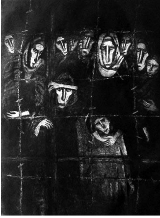
شكل (11) عبد الله جوهر ، نظرة إلى الوطن المسلوب ، حفر غانر على المعدن ، 1980 ، مقتنيات الكونجرس الأمريكي.

وظفلة تجر جر قدميها الصغيرتين وتمسك أطراف ثوب أمها فصور النساء المشردات الذين يعانون القهر والفرار من الوطن المسلوب أمام وحشية الإستعمار .