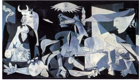
شكل (4) بيكاسو، جرنیکا ، تصوير زيتي على كانفس ، 349,3 x 1937,776,6 cm ، متحف الفن الحديث ، مدريد أسبانيا

وفي مطلع القرن الثامن عشر كان هناك إهتمام بأول ميثاق حقوق للإنسان والذي أتى لنشر الديموقراطية ، فلم يتخل يوماً الفن التشكيلي عن المشاركة في الحياة السياسية ومقاومة المستعمر والتشهير بالظلم والعدوان ضد أي ديكتاتور ، وقد كان لكثير من الفنانين على المستويين العالمي والمحلي مواقف مشرفة في دفع الظلم ومقاومته من خلال أساليبهم التعبيرية التي جسدها في أعمالهم الفنية والتي كان لها قوة التأثير عن استخدام الكلمة أو اللفظ ، فحينما سيطر هتلر على ألمانيا النازية إستبعد لوحات لفنانين كُثر منهم على سبيل المثال لا الحصر مائة وإثنين لوحة من