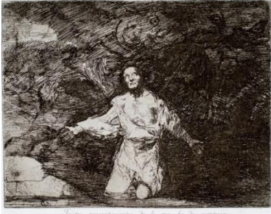
شكل (2) جويبا ، أحاديث داخلية حزينة بما لا يد أن يحدث " من مجموعة مآسى الحرب " ، حفر حمضي ، 220 × 178 ملم ، الطبعة الأولى 1810 ، متحف المتروبوليتان