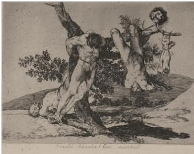
شكل (3) جويبا ، عمل بطولي مع رجل ميت ! " من مجموعة مآسى الحرب " ، حفر حمضي مع إستخدام تأثير الألوان المانية ، 13.8 × 18.7 سم ، 1812 ، متحف الفن بشيكاغو