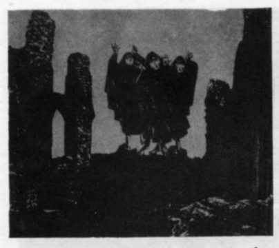
شكل (14) فاروق شحاته، فلسطينيات تبكي الشهداء، حفر وطباعه باستخدام الأحماض مع تأثير الألوان المائية