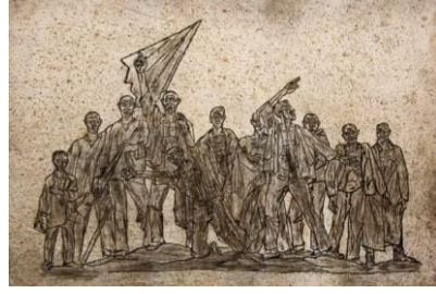
شكل (9) نحميا سعد ، بدون عنوان ، رسم بالحبر الشيني على ورق ، تاريخ الإنتاج غير محدد ، مجموعة مقتنيات المهندس "عمر عبد المعز".

أما الفنان المصري فاروق شحاته Farouk Shehata (1938 – 2017) عاصر القضايا الوطنية والقومية ونضالات الشعوب العربيّة كقضية فلسطين فأصبح مؤمناً بكل القضايا الوطنية المصرية كجيل الثورة ، فنرى أعماله الفنيّة الأولى قد أثرت الفن بقضايا المجتمع مثل الطائر الجريح شكل (13) ، فلسطينيات تبكي الشهيد شكل (14) ، فعبّرت لوحاته عن المأساة بكل عنفوانها وآلام ذلك الشعب المجروح وقد تكونت شخصيته الفنيّة في تلك المرحلة وإصطبغت بالشكل المأساوي الذي لازمه طوال مراحل إنتاجه الفني ، فأصبح موضوع الإنسان المتألم هو الجزء المشترك في أعماله الجرافيكية فمن خلال عيون شخصه نرى الفجيعة وعلى وجوههم إرتمت الكآبة ،