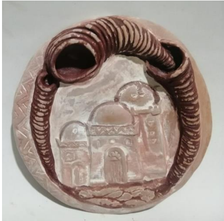
شكل (13) طبق خزفي مقاس قطر 16 سم - اسم العمل " البيوت النوبية"

ومن نفس منطلق فكره الخوف جاء هذا العمل ايضا الذي يعبر عن خوف الام على طفلتها والذي يرتبط بغريزة الامومة والقلق الذي ينتاب الام على ابنائها مما يواجههم في مجالات الحياة بشكل عام. حيث ان حب الام لابنائها هو الاساس فهو اول شعور تحسه الام تجاههم لانه شعور فطري يولد من داخلها تلقائيا لذلك تقني الام نفسها في حماية ابنائها فخوف الام وقلقها وتقانيها في حماية ابنائها شيء طبيعي وبدونه لا يصبح لدينا حافز لحماية انفسنا ومن حولنا ، لذلك جعلت الباحثة الام تحضن أبنيتها الصغيرة التي تنظر اليها بحنان وحب بينما الام تنظر للامام بامتعاض وخوف مما قد تخبئة لهما الايام القادمة ، ونستشعر ذلك التوتر من حركة الطرحة التي يحركها الهواء نتيجة للاعاصير التي تحيط بهم وتطوقهم من جميع الجهات و بشكل دائري يتماشى مع شكل الطبق و تأكيدا لفكرة التوتر نجد تكرارا لشكل الدوامات التي تظهر في فستان الطفلة ، وقد شكل الباحث الاعاصير بطريقة الحبال.