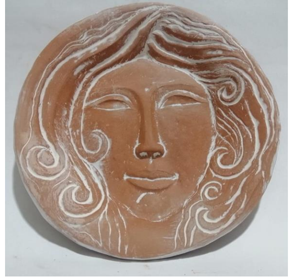
شكل (17) طبق خزفي قطر 15سم – اسم العمل " بورتريه امرأة رومانسية "

هناك العديد من الصفات التي تميز الشخصية الانطوائية ومن اهمها الرغبة في البقاء وحيدا والانعزال حيث يحتاج الانطوائيون غالبا الى مساحة شخصية أكبر، ويميلون لقضاء الوقت مع أنفسهم، مما يجعلهم عرضة للاحكام من قبل الاخرين اللذين يكونون عنهم صورة خاطئة غير حقيقية. اذ ينظر الى الانطوائى فى معظم الاحيان على انه غير اجتماعى، وضح الباحث هذه الفكرة بان جعل العنصر الرئيسى فى هذا العمل وهو الانسان الانطوائى يجلس مطاطا الراس ويخبئها في ملابسة ويضم يديه على ركبتيه منغلقة على ذاته داخل دائرة ويحيط به الاعصار من الخارج واثنين اخرين من الاعاصير التي تشبه شكل القوقعة لتأكيد فكرة الانغلاق، و الناس تحيط به من الخارج وتتنظر اليه وذلك لتأكيد الفكرة واحداث التوازن في التصميم .