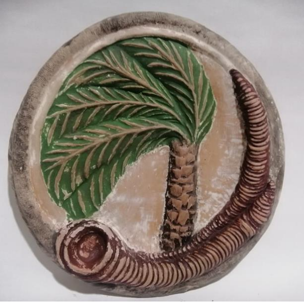
شكل (15) طبق خزفي قطر 23سم - اسم العمل " النخلة "

حاول الباحث في هذا العمل ان للنخلة،سة نحتية واقعية في صورة مبسطة تخدم العمل وتؤكد على قيمة العنصر الرئيسي ( النخلة ) وما تعنيه من قيمة معنوية تدل على الشموخ والرسوخ ، ويطلق عليها فاكهة الصحراء حيث تعتبر النخلة اعظم شجره منتجة للغذاء في المناطق الصحراوية لقدرتها على النمو والانتاج والتاقلم مع تلك البيئات وبالرغم من كل هذه المميزات الا ان الاعصار بامكانه ان يجعلها تتحنى ويتاثر تاجها المتمثل في السعف والذي بمثابة الراس للنخلة ، وجعلت الباحثة الاعصار يتجه نحو تاج النخلة كما لو انه يحاول ابتلاعه ، وجسدت النخلة كما لو انها تستغيث من شعورها بالخطر الذي يهددها.