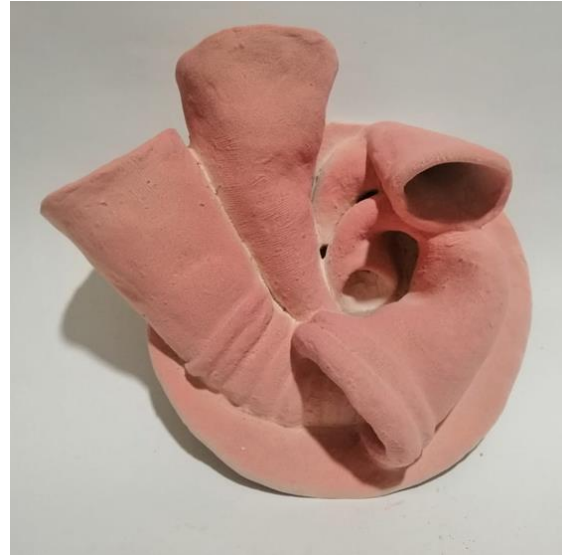
شکل ( 8 ) اسم العمل " اعاصير تتصارع "

ومنتصف الساعة 12، 6 في الاعلى والاسفل في منتصف الطبق الخزفي والدوامات الكبيرة التي تربط بين الرقمين والدومات الصغيرة على جانبي الطبق والتي تنتهي كل منها بايدي بشرية تشير الى راس ومنتصف الساعة وتريد اللحاق بالوقت قبل ان يضيع . وقد اختارت الباحثة شكل الدوامة لتأكيد استمرارية الوقت والحياة، و " ذلك لما يمثله العمل النحتي من كونه خطابا سرديا مفتوحا من الرموز والدلالات لا تنفك عن حركة القراءة والنقد والتواصل الفكري والمعرفي وتداول المفاهيم بين المرسل والمتلقى ويمثل الزمن عنصرا أساسيا في السرد باعتباره الهيكل العام الذي يشيد قوامه البناء السردى للتكوين النحتي وينقسم الى (اللحظة - الديمومة - التعاقب - التوالى - التغيير) (5). "