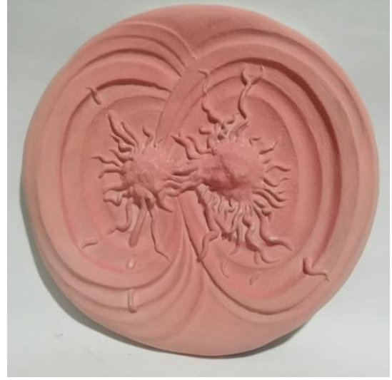
شكل (5) طبق خزفي قطر 26 سم - اسم العمل " اختراق "

في هذا العمل نري نوع اخر من انواع المخاوف والصراعات التي يعيشها الانسان في حياته. فكثيرا ما نسمع يوميا عن اصابة شخص ما قريبا او صديق بمرض السرطان وفي هذا العمل سلطت الباحثة الضوء علي الشكل التقريبي للورم وسرعه انتشاره وتشعبه وذلك من خلال جعل الخلية الكبيره في منتصف الطبق الخزفي وبشكل نصف كروي غير منتظم تنبثق منها شعيرات مختلفة الاحجام والاطوال تتشابه مع خلايا اخري بشكل مشابه للخلية الام الكبيرة، ولكن بحجم اصغر والشكل الدائري الغير منتظم، والطبق منفذ بالضغط اليدوي في طبق اخر جاهز لناخذ منه فورمة الشكل العام للطبق دون الاستعانة بالدولاب.