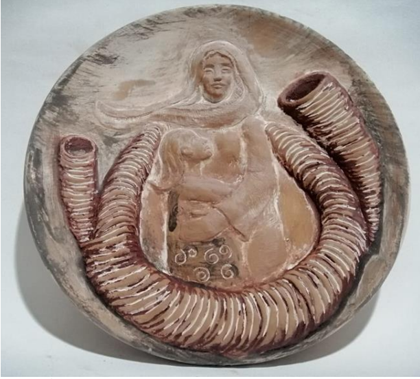
شكل (12) طبق خزفي قطر 15 سم - اسم العمل " امومة"

الماته منفذه بأسلوب الحبال بأشكال مختلفة تخرج منها الدوامه لتعمل على ربط التصميم وعمل شكل دائري لتأكيد الحركة والاستمرارية لمثل هذه الاحداث التي تجعله يعاني من الخوف وخاصة ان الغراب واقفا على راس خيال الماته مما يعني ان الطيور لم تعد تخاف منه ، فالأمر ببساطة ان الطيور اصبحت ذكية واصبحت على دراية بهذه الشخصية في الحقل والذي لا يبدو انه يتحرك فعندما يزول الخوف تعود الطيور الى اماكن تغذيتها.