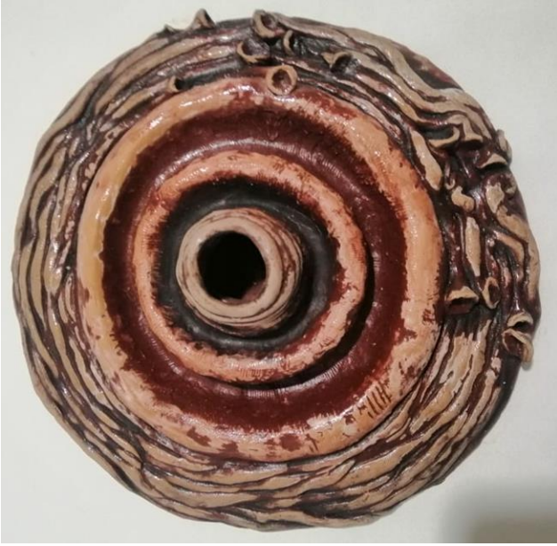
شكل (7) اسم العمل " صراع النفس " مقاس - قطر 35 سم

نرى في هذا العمل حاله من التلاحم والانتشار بين الفيروسات واتحادها ومحاولاتها إختراق الحواجز مما يترتب عليه إحداث حالة من الخوف والصراع الداخلي للانسان ومخاوفه من هذه الفيروسات التي لا ترى بالعين المجردة ورغم ذلك تمثل كثير من الخطر على الانسان والبشرية كلها. فمن الناحية التشكيلية اعتمد الباحث على الشكل الهندسي المتمثل في الحركة الدائرية للخطوط التي تؤكد الشكل الدائري للطبق الخزفي، وتعمل على تأكيد الحركة المستمرة والديناميكية والشكل العضوي المتمثل في شكل الفيروس والشعيرات التي تنبثق منه وتتلاحم في اجزاء مؤكده فكرة الترابط بين العنصرين في وسط التصميم لاهميتهم ولتأكيد البطولة وكذلك الاختلاف والتباين في احجامهم واطوالهم ووجود ملمس خشن لاحداث نوع من التنوع والحركة واثراء التصميم.