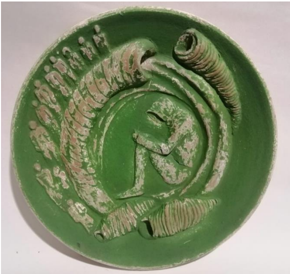
شكل (16) طبق خزفي قطر 50سم اسم العمل " الانطواء "

حاول الباحث في هذا العمل ان للنخلة،سة نحتية واقعية في صورة مبسطة تخدم العمل وتؤكد على قيمة العنصر الرئيسي ( النخلة ) وما تعنيه من قيمة معنوية تدل على الشموخ والرسوخ ، ويطلق عليها فاكهة الصحراء حيث تعتبر النخلة اعظم شجره منتجة للغذاء في المناطق الصحراوية لقدرتها على النمو والانتاج والتاقلم مع تلك البيئات وبالرغم من كل هذه المميزات الا ان الاعصار بامكانه ان يجعلها تتحنى ويتاثر تاجها المتمثل في السعف والذي بمثابة الراس للنخلة ، وجعلت الباحثة الاعصار يتجه نحو تاج النخلة كما لو انه يحاول ابتلاعه ، وجسدت النخلة كما لو انها تستغيث من شعورها بالخطر الذي يهددها.