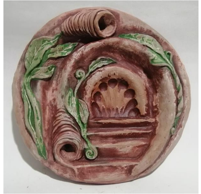
شكل (14) طبق خزفي - مقاس قطر 26سم - اسم العمل

نرى في هذا العمل ثلاثة اعاصير مشكلة بالحبال تحيط بثلاثة بيوت باحجام متباينة تنتمي للطراز النوبي حيث تعتبر البيوت النوبية من أجمل البيوت في مصر لها معمار مختلف ولها سمات خاصة وتتميز بالوانها الزاهية والمعمار الهندسي القديم البسيط جدا ، والرسومات ترجع لعصور قديمة ، فالنوبي يعيش بيته وتفاصيله لذلك جعل منه عمل فني جذاب فكل البيوت النوبية متميزة بالالوان الزاهية وملائمة للبيئة اهم ميزه له فقد هبىء البيت ليتناسب مع المناخ ففي الصيف يكون البيت باردا قليلا بسبب القباب المرتفعة ، وقد رجعت القباب الى النوبة التي علمتنا كيف يبنى البيت بدون خشب يحمى من حر الصيف وبقي من برد الشتاء ، وفي هذا العمل تتضح فكرة الخوف من اندثار التراث الجميل بسبب اتجاه الناس للبناء الحديث