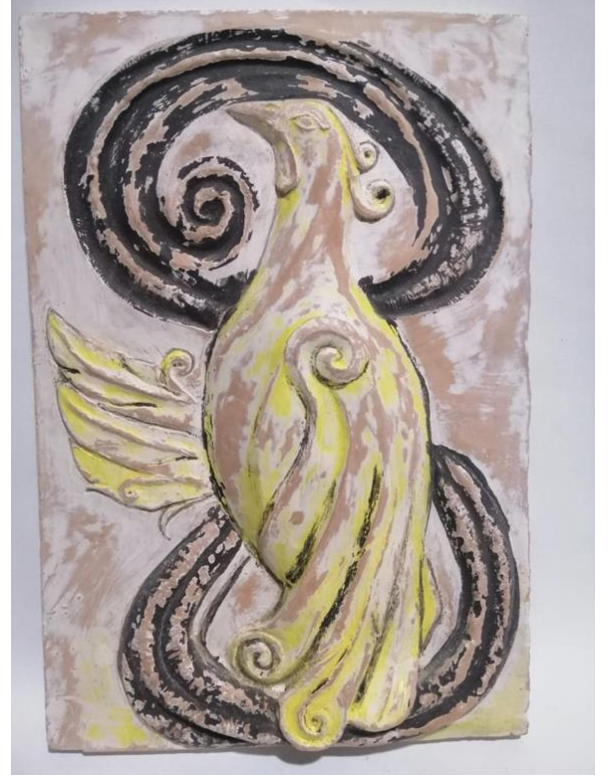
شكل (11) بلاطة خزفية مقاس 30x20 سم العمل " مخاوف طائر"

الخوف هو الشعور الناجم عن الخطر او التهديد المتصور ويحدث الخوف في البشر وانواع معينة من الكائنات الحية ردا على تحفيز معين يحدث في الوقت الحاضر، أو تحسبا كتوقع وجود تهديد محتمل في المستقبل كوجود خطر على الجسم أو الحياة عموما. وتنشأ استجابة الخوف من تصور لوجود خطر ما مما يؤدي الى المواجهة معه او الهروب منه وتجنبه استجابة لغريزة البقاء على قيد الحياة، ونرى في هذا العمل طائر محاط بدوامة الاعصار من اعلى وأسفل التصميم لتأكيد الفكرة وعمل نوع من التردد وعمل ائزان للكتل وتوزيع العناصر وجعلت الباحثة معالجة ريش الطائر بشكل الدوامه لاحداث الوحدة والتوحد والانسجام بين عناصر التصميم .