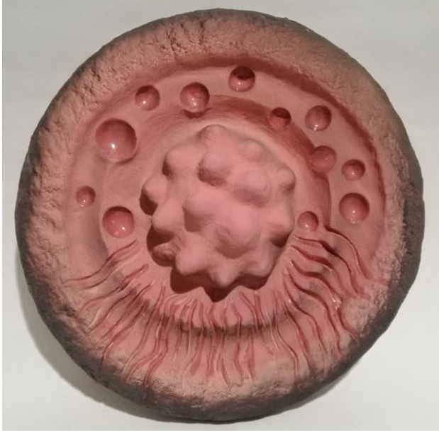
شكل (4) طبق خزفي قطر 23سم اسم العمل " فيروس كورونا2"

حتى خلفية الطبق بها اعاصير ودومات دلالة على سرعة انتشار هذا المرض.