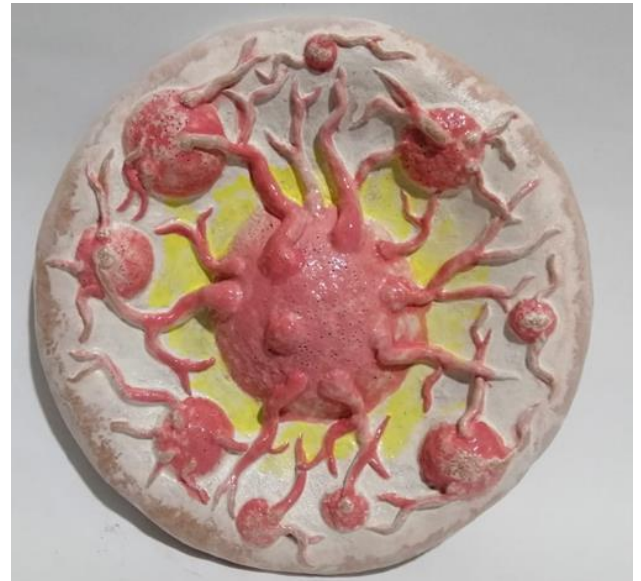
شكل (6) طبق خزفي - اسم العمل " الانتشار " - مقاس - قطر 20 سم

في هذا العمل نري حاله من الحركة والديومومية للتلاحم المستمر الذي عبر عنه الباحث بالشكل المخروطي الصغير للتعبير عن الصراعات الداخلية التي تدور في النفس البشرية من ضغوطات الحياه والتفكير الزائد. فجعلتها باحجام واتجاهات مختلفه لاحداث تنوع وتباين من شأنه اضافة الحيويه والتأكيد على حاله الحركة والاستمرارية، والتي قد ينتهي بها الحال الى الوصول لفوهه البركان من كثرة ما يحدث من ثورة وغلجان لهذه المشاعر والصراعات الداخلية، هذا وقد استفادت الباحثة من تقنية التشكيل بالحبال في اتمام العمل بالشكل المطلوب والتعبير عن مضمونه .