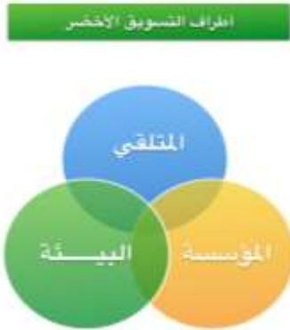
(أطراف التسويق الأخضر، شكل 2 تصميم الباحثة)

إنتاج منتجات خضراء بهدف المحافظة على البيئة المادية والإحتفاظ بالموارد الطبيعية وإستخدامها الإستخدام الأمثل لإشباع إحتياجات كل أنواع الكائنات الحية وتقديم لهم حياة صحية ونظيفة وأمنه حالياً ومستقبلاً". (حشمت، 2010 ص19) ومفهوم التسويق الأخضر يتضمن ثلاثة أطراف محورية وهي : المؤسسة والمتلقي والبيئة. (سامي، 2013 ص63،64 بتصرف)