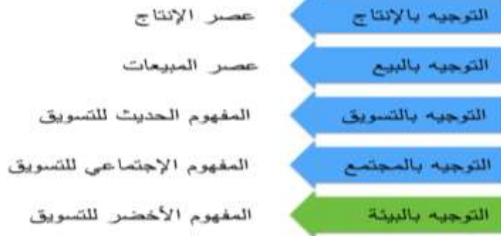
(مراحل تطور الفكر التسويقي. شكل 1 تصميم الباحثة)

عرف التسويق تغيرات كثيرة نلخصها في المراحل التالية: