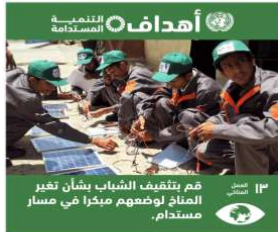
إعلان عن هدف العمل المناخي شكل (13)

-ويوضح شكل (13) ملصق إعلاني تم تصميمه من خلال حملة إعلانية لهيئة الأمم المتحدة لدعم الهدف الثالث عشر (العمل المناخي) من أهداف التنمية المستدامة، وإستخدام اللون الأخضر يرتبط رمزياً بثلاثة عناصر أساسية هي: "الطبيعة، الحيوية، الحياة"، وهذا يحقق الإيجابية والتفاؤل لمستقبل أفضل في ظل الإستدامة، وإستخدام صورة تحتوي على مصادر طاقة نظيفة، والعنصر البشري ينتمي لفئة عمرية تتميز بالشباب في وضع إستعداد للمساهمة في حل مشكلة تغير المناخ، وجاء الرمز على شكل عين بداخلها الكرة الأرضية للدلالة على أهمية كوكب الأرض، ووضعه في بؤرة الإهتمام الرئيسية للفكر الإنساني.