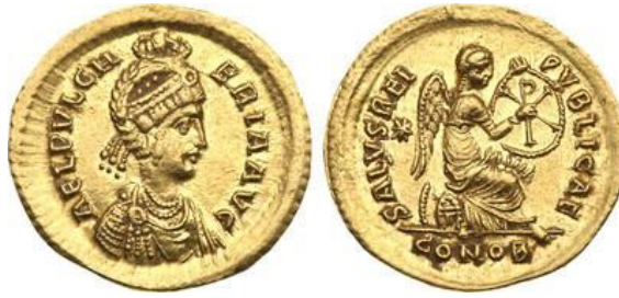
صورة رقم ١٢

عملة رومانية متأخرة تؤرخ بعهد الإمبراطورة جاللا بلاكيديا GallaPlacidia