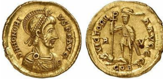
صورة رقم ١٠

عملة رومانية متأخرة تؤرخ بعهد الإمبراطور هونوريوس Honorius وتصاحبه يد الرب