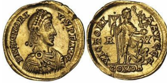
صورة رقم ٨