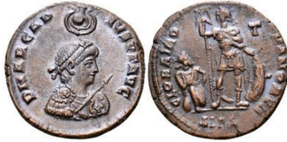
صورة رقم ٩