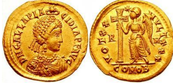
صورة رقم ١١

عملة رومانية متأخرة تؤرخ بعهد الإمبراطور هونوريوس Honorius وتصاحبه يد الرب