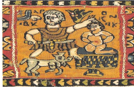
صورة رقم ٢

مشهد على جدران كنيسة صغيرة بالبجوات يؤرخ بالقرن السادس الميلادي، ويصوّر إبراهيم وهو يذبح ابنه إسحق