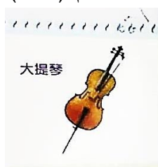
شكل رقم (٤) تعريف موسيقي عن آلة التشيللو للطالب المبتدئ