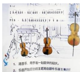
شكل رقم (٥) تعريف موسيقي لعائلة الوترية للطالب المبتدئ