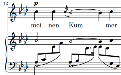
شكل رقم ( ٣ )