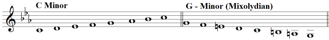
شكل رقم (٦)

وبعد تطبيق أسلوب الهارمونية السلبية على اللحن والمصاحبة الهارمونية باستخدام الدرجة الخامسة (صول) كمحور مركزي، أصبحت في سلم صول السلبي الصغير (G- minor) وهو ما يُعادل مقام ميكسوليديان (Mixolydian) كما يلي: