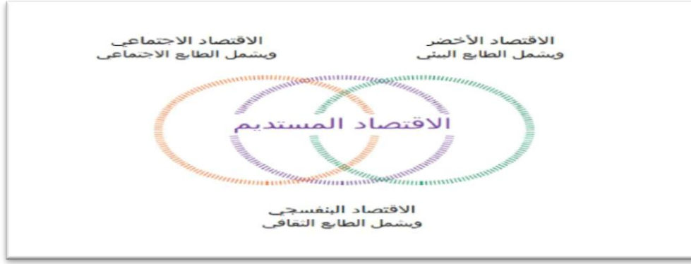
شكل رقم (٣) يوضح أبعاد الاقتصاد المستدام