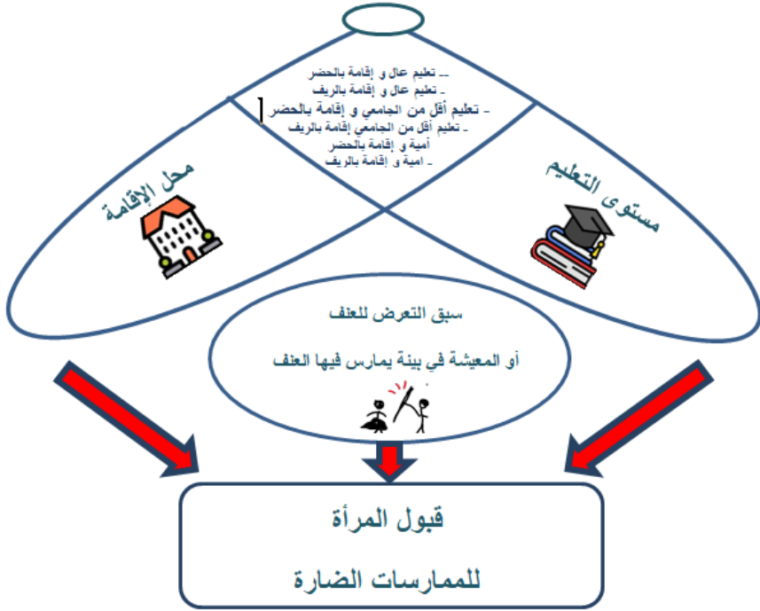
شكل 1: الإطار العلاقي للمتغيرات محل الدراسة