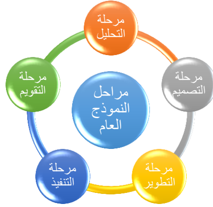
شكل (٢) يوضح النموذج العام لتوظيف استخدام تطبيقات الجوال في التدريب ع بعد