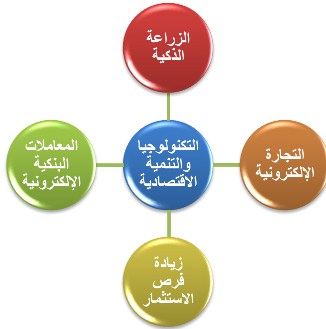
شكل (5) التكنولوجيا والتنمية الاقتصادية