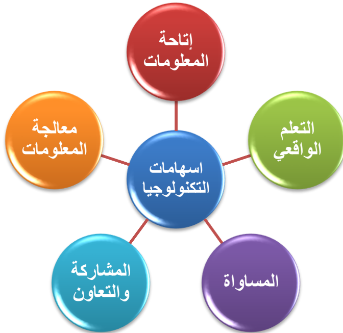
شكل (3) علاقة التكنولوجيا بالتنمية المستدامة

ويعرض الشكل التالي علاقة التكنولوجيا بالتنمية المستدامة (الشاعر، 2017):