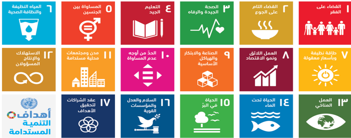
شكل (1) أهداف التنمية المستدامة