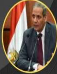
رئيس المؤتمر أ.د الهلالي الشربيني الهلالي وزير التربية والتعليم الأسبق جمهورية مصر العربية