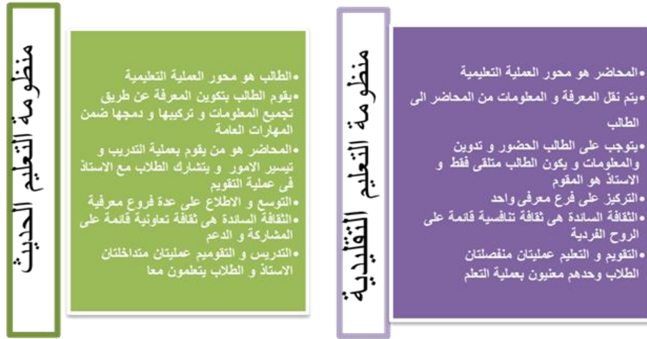
شكل (2) يوضح الفرق بين منظمة التعليم التقليدية و الحديثة عمل الباحثة

1- أساليب التعليم الهندسي : تعددت مفاهيم و أساليب التعليم الهندسي في مصر إلى ان صنفت إلى مفهومين :-