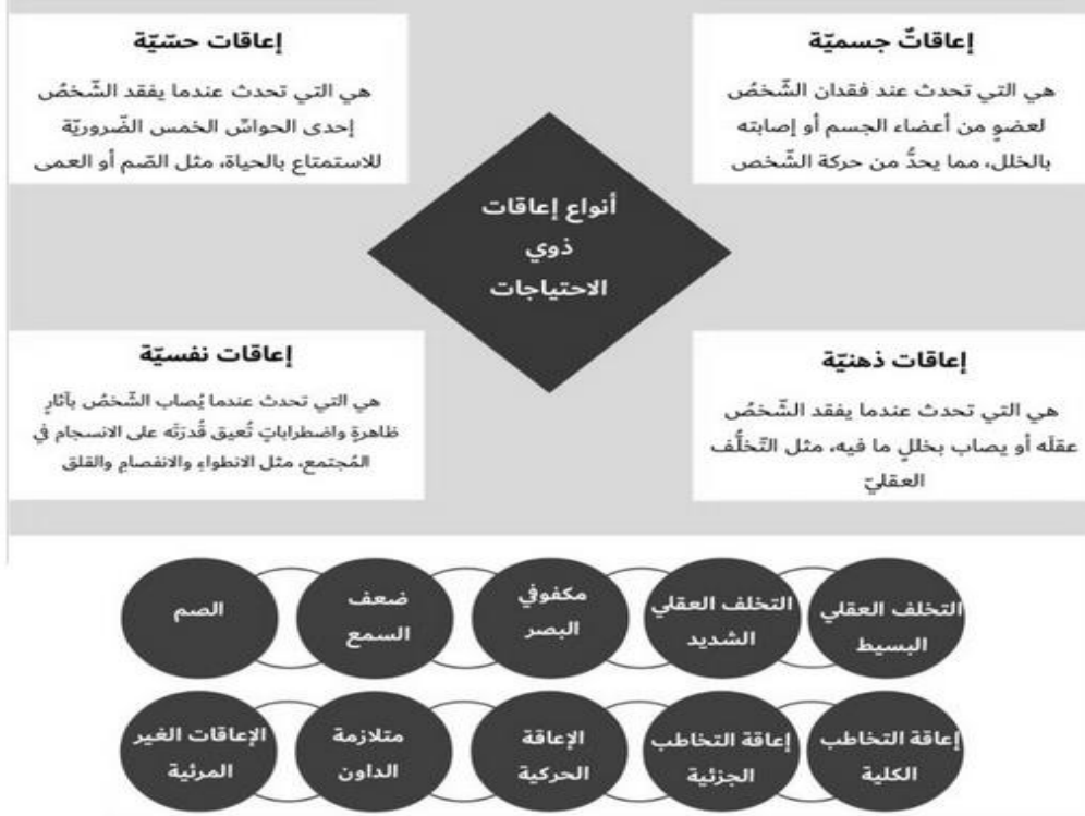
شكل (1) أنواع اعاقات ذوي الأحتياجات الخاصه