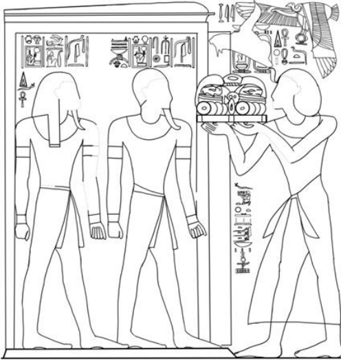
شكل رقم 1 (ب)

فاكسميلي يصور الملك سيتي الأول يقدم القرابين عرق سب إف وونتي (عمل الباحث)