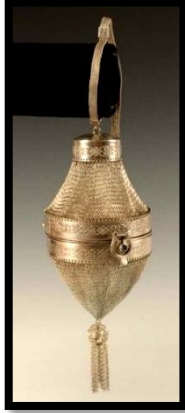
شكل (6) "حقيبة يد شبكية صغيرة (مينودير بودرييس) ، مصنوعة من الفضة ، صُنعت بواسطة (وايتينج آند ديفيس) ، ترجع إلى الفن الزخرفى لعام 1926م

شكل تصميمي ، وفى بعض الأحيان يكون الإطار مطلى بالمينا فقط ، وأحياناً أخرى الهيئة الشبكية والإطار مطليان معاً .