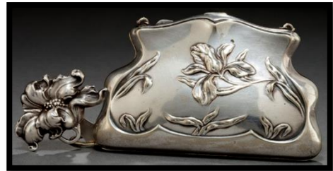
شكل (3) حافظة مطلية بالفضة بتصميم منفذ بالتشكيل البارز، صُنعت فى نيوارك، نيوجيرسى ( newgersy Newark)، ترجع إلى 1900م، للفنان : الأخوه أنغر (Unger brothers) نقلاً عن : https://fineart.ha.com (تاريخ زيارة الموقع: 2019/10/17)

شكل (3) وهى عبارة عن حافظة معدنية مطلية بالفضة مع تصميم من التشكيل البارز، أما(الفن الزخرفى Art Deco) فكانت بعض تصميمات تميز بأنها مستوحاه من فنون الحضارات القديمة مثل الفنون الأزيكية ، البدائية ، المصرى القديم ، والتكعيبية إلى جانب الفنون الصينية واليابانية