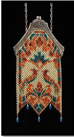
شكل (4) "حافظة مسائية مصنوعة من المعدن، ترجع لعام 1915-1930م، المكان: أمريكا، بواسطة شركة منداليان للتصنيع، إحدى محفوظات متحف المتروبوليتان محفوظة برقم: 2009.300.2220 نقلا عن: ( الموقع الرسمي لمتحف المتروبوليتان) https://www.metmuseum.org (تاريخ زيارة الموقع: 2020/11/10م)

فتشعبت حقائب اليد المعدنية وتنوعت إستخداماتها وأحجامها ومُسمياتها وأيضاً طُرق حملها ، فظهرت حقائب يد معدنية مثل: (الحقيبة العادية- حقيبة التجميل - محفظة النقود وغيرها) ، "فُضنت معظمها فى فرنسا والولايات المتحدة ، كذلك فى ألمانيا و شرق أوروبا وأسيا . كما تنقسم حقائب اليد المعروفة بأسم (الجيب) أو (المحفظة) فى الولايات المتحدة الى أربع فئات رئيسية وهى : ( الحقائب أو الأكياس الشبكية - حقائب من الجلد أو القماش - حقائب مطرزة - حيث كانت الحقائب المصنوعة من الجلد أو أكثر شيوعاً ونادراً ما تكون محتفظة بمظهرها وجودتها ونادراً عندما توجد بجودة جيدة - وصُنعت حقائب شبكية من المعدن بكميات كبيرة فى فرنسا وعادة ماتكون بجودة معتدلة)" (3) ومن ثم أخذت تطور حقيبة اليد المعدنية بعد ذلك وبدأت تُصنع بعد ذلك من خامات أخرى متطورة بجانب المعدن مثل: البلاستيك ، والزجاج ، كما كان يتم توليف خامة المعدن مع البلاستيك، ومن هذا المنطلق سوف يقوم البحث الحالى على إستحداث حقائب يد معدنية مستوحاه من (الفن الجديد) و(الفن الزخرفى) وذلك من خلال دراسة مفهوم مكملات الزي والزينة خاصة المتصلة والمنفصلة ومدى إرتباطها بحقيبة اليد المعدنية ومدى أهمية هذه الحقيبة وأثرها فى إبراز جماليات الزي الخارجى للمرأة ، إلى جانب تبيان مراحل وبدايات ظهور حقيبة اليد وإستخداماتها فى الفنون القديمة وتطورها إلى أن تطورت