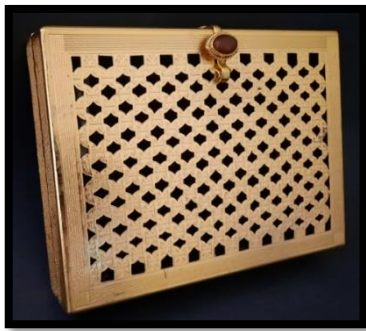
شكل (8) العمل الفنى الأول يوضح حقيبة كلاتش معدنية مستحدثة بواسطة الدارسة مستوحاة من الفن الزخرفى ، وحداتها الزخرفية قائمة على التكرار المنتظم والتفرع