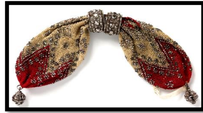
شكل(2) يوضح "حقيبة (miser's purse) حقيبة شبكية مصنوعة من خيوط الحريرية الملونة الاحمر، مع حلقتين معدنية من الفضة مرصعة بالماس ، مُنعت فى أوروبا، ترجع للفترة من 1810-1830م مكان الحفظ : متحف كوبرهيويت ، متحف سميثسونيان للتصميم ، بنيويورك رقم الحفظ : chndm_1953-106-59 نقلنا عن https://www.si.edu/object/misers-purse:chndm_1953-106-59 (تاريخ زيارة الموقع : 2020/4/6)