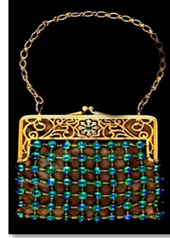
شكل (5) حقيبة شبكية مطرزة، مع إطار من المعدن ومرصعة من المتصنف بحجر، للفنان تيفانى، صُنعت بنيويورك، ترجع الفن الجديد لعام 1910م نقلاً عن : http://luxury-handbags.info تاريخ زيارة الموقع (2020/11/15)

تماما، حتى المرأة الميسورة كان لديها العديد من الحافظات كى تتماشى مع مختلف الملابس " (9) وعلى الرغم من صغرها إلا أنها كانت تتمتع بقيمة جمالية، وأساليب تشكيلية مختلفة فى غاية الجمال والدقة، إلى جانب أن معظمها مُقسم من الداخل لعدة أجزاء، كى توضع بها المرأة أغراضها البسيطة.