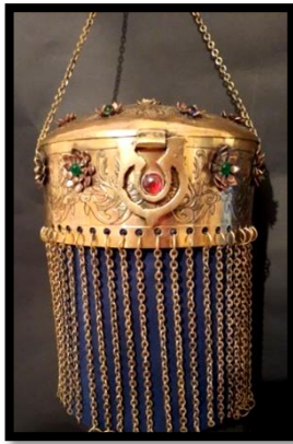
شكل (9) العمل الفنى الثانى يوضح حقيبة يد معدنية مستحدثة بواسطة الدارسة مستوحاة من الفن الجديد، قائمة على الحركة