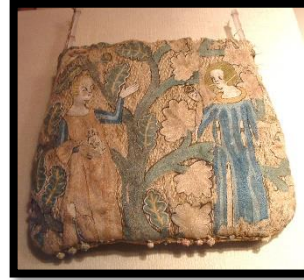
شكل(1) "حقيبة صدقات فرنسية french alms purse ) ، مصنوعة من الكتان ، خيوط حرير ملونه ، خيوط معدنية، ترجع الى منتصف القرن ال14م مكان الحفظ : معروضة فى أحد الأديرة فى نيويورك" نقلنا عن http://cottesimple.com/articles/aumonieres/ (تاريخ زيارة الموقع : 2020/4/9 )

تميزت المرأه بحبها للزينة وإهتمامها بمظهرها وتأنقها من خلال الملابس ومكملات الزى وأدوات الزينة التي أختلفت أشكالها من عصر لآخر، حيث كانت المرأه تترزين لإظهار جمالها وأنوئتها، فكانت تهتم بكل ماله علاقة بمكملات الزى سواء كانت مكملات متصلة أو منفصلة ولاسيما حقائق اليد التي بدأت بكيس نقود صغير مصنوع من جلد او قماش يتدلى من الحزام التي يرتديها كل من المرأه على وسطها مثل الرجل ، الى حقائق متعددة الإستخدامات ومصنوعة من مواد متنوعة بعضها قد يكون غريب والبعض يشبه حقائق اليوم، ومن خلال البحث لتطور حقيبة اليد ، لوحظ بأن الحقيبة purse ظهرت فى الأزياء الأوروبية كمكمل للملابس لكلاً من الرجال والسيدات حيث كان مُسمى الحقيبة لم يكن معروف أو مستخدم بالمعنى الحرفى للحقيبة ، فهى كانت كيس يشبه الحقيبة، وكانت فى البداية عبارة عن أكياس تُصنع من خامات بسيطة مثل القماش، أو من الجلود ، وكان بعضها يُزخرف.