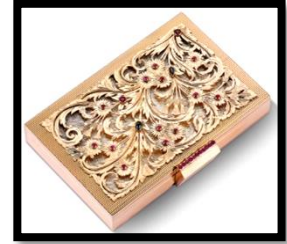
شكل(7) حافطة تجميل مصنوعة من الذهب عيار 18 والفضة، مرصعة بالياقوت والأحجار الكريمة، ومصحوبة بحقيبة من الجلد تُحمل منها، صُنعت ف باريس لعام 1940م، بواسطة(لاكوش فريرير Lacroche Frères)، أبعادها: 13.5×8.5×2.0سم نقلًا عن (Jewels & Jadeite: catalogue),28 November, PHILLIPS publisher,Hong Kong, p.37