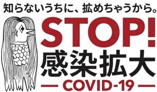
السُّكُل (1) وزارة الصحة والعمل والرعاية الصحية، Ministry of Health and Welfare، منشور بالموقع STOP! The spread of COVID-19، أوقفوا انتشار العدوى!، (2020) الرسمي لوزارة الصحة والعمل والرعاية الصحية اليابانية، (2020)

وفي حقبة (ريوا) Reiwa Period، أعلن رئيس الوزراء الياباني (شينزو آبي) Shinzo Abe عن حالة الطوارئ في سبع محافظات بسبب فيروس (كورونا) Covid-19، وتأجيل (أولمبياد طوكيو 2020) والانخفاض المفاجئ في السياحة، كل ذلك أثر على الشركات اليابانية مع استمرار ارتفاع حالات الإصابة في البلاد. وكان رد فعل اليابانيين هو إيجاد طرق إبداعية للتعبير عن معركتهم ضد تفشي الوباء، فظهر رمز (أمابي) Amabie، وهو وحش ياباني أو (يوكاي*) Yokai على شكل نصف سمكة ونصف بشري، ظهر أول مرة في حقبة (إيدو) على مطبوعة خشبية، وتقول الأسطورة أنه إذا تم رسم الصورة وعرضها على الناس، فإن الكوارث الطبيعية ستنتهي. 16 لذا استخدم سُكُل (أمابي) مع جملة (أوقفوا انتشار العدوى!) في بداية أبريل من قبل وزارة الصحة والعمل والرعاية الاجتماعية (رقم 1). وتم نشر سُكُل (أمابي) رسميًا من قبل الوكالة الحكومية، وتم السماح باستخدام السُّكُل بحرية، وتحفيز التسويق له من قبل الفنانين والشركات المختلفة. 17