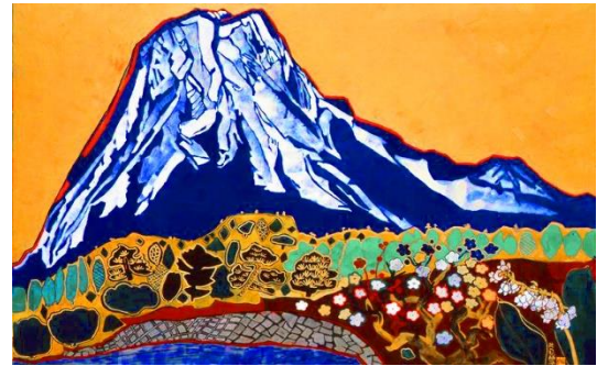
الشكل (2) تاموكو كاتاوكا Tamako Kataoka, جبل فوجي المبشر Auspicious Mt. Fuji, صَبَاغُ ملونه وأوراق الذهب على حرير، 38.3 × 60.2 سم، نادي طوكيو للفنون Tokyo Art Club، اليابان، (1991) كومي ايتو Kumi Ito * (1942 - )

تناولت الفنانة (تاموكو كاتاوكا) Tamako Kataoka موضوعات مرتبطة بالطبيعة، واشتهرت بتصوير سلسلة من الأعمال لجبل (فوجي) Mt. Fuji، التي تميزت بألوانها الزاهية وخطوطها القوية والجريئة. ومثال على ذلك لوحة (جبل فوجي المبشر) Auspicious Mt. Fuji عام (1991)، فقد حلت الشكل إلى مساحات لونية، وأضافت مجموعة من النباتات والأشجار المختلفة بشكل زخرفي، واستخدمت الصَّبَاغُ الملونة على الحرير، وأوراق الذهب للخلفية كما في الشكل (2). رأت الفنانة أن الرسم الجميل ليس كل شيء، واستمرت في الإبداع وفقاً لمعتقداتها الخاصة، ورفضت الامتثال لحدود الفن التقليدي. 18 فجمعت بين الأسلوب الياباني التقليدي مع جمالية النمط الغربي لفن البوب، وساعدت في إدخال لوحات (نيهونجا) التقليدية في العصر الحديث. 19