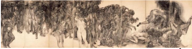
الشكل (4) توشي ماروكي Toshi Maruki، أشباح Ghosts، ألوان زيت وحبر على شاشة قابلة للطي ورقية، 1.8 × 7.2 مترًا، معرض هيروشيما Hiroshima Gallery، سايتاما، اليابان، (1950)