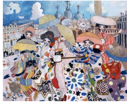
الشكل (5) أية تاكانو Aya Takano، كل يوم هو كارنفال Every day is a carnival، ألوان زيت على لوحة قماشية، 160 × 130 سم، Galerie Perrotin، هولج كونج، 2012

والمعقدة. فصورت مجموعة من الفتيات مشوقات القوام، بأعين كبيرة، يرتدين (الكيونو) Kimono المزخرف بألوان زاهية بينما يرقصن في ساحة واسعة، وتظهر في الأرضية خلفهم زخارف الأطباق النجمية متعددة الألوان، مما يخلق إحساسًا بمنظور مسطح كما لو كانت الفتيات تطفو فوق الأشكال. وتتشابه النساء في مطبوعات (أوكيو-إي) Ukiyo-e مع الفتيات في هذا العمل، حيث يرتدين الزي الياباني التقليدي، وتحمل كل واحدة ملحقاتًا مميزة؛ مثل المراوح المزينة بالزهور المرسومة أو فن الخط، بينما تعزف كل من الفتيات الأخرى على آلة موسيقية.