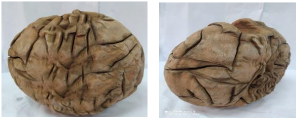
صورة رقم (8) توضح شكل خزفى منفذ داخل نموذج القصة بعد أن تم إعادة صياغته

والتي أعتاد الطلاب استخدامه كثيراً... حيث يمكن إعادة صياغته بأساليب متعدده تبعاً لفكر الفنان الذي يستخدمه.