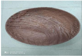
صورة رقم (7) توضح إعادة صياغة نموذج القصة

والتي أعتاد الطلاب استخدامه كثيراً... حيث يمكن إعادة صياغته بأساليب متعدده تبعاً لفكر الفنان الذي يستخدمه.