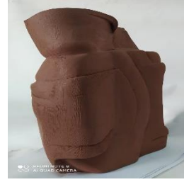
صورة رقم (3) توضح شكل خزفى منفذ بقالب الفوم

هناك نماذج أيضاً مستحدثه بحياتنا اليوميه وهى لعب الفوم والبلاستيك المستخدمه بالمطاعم.. فهى تتميز بتنوع أشكالها التي يمكن أن تستخدم كنماذج للتشكيل مع مراعاة طبيعة الخامه ، حيث أنها فى الغالب تكون ضعيفه ولايد لكى يمكن استخدامها مضاعفتها مره أو اثنتين حتى تصبح قوية ويمكن أن تتحمل خامة الطين.. وتضح بالصورة رقم ( 4 ) نموذج من هذه العلب .