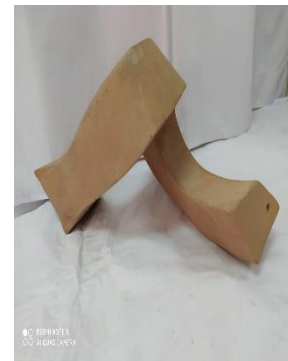
صورة رقم (10)