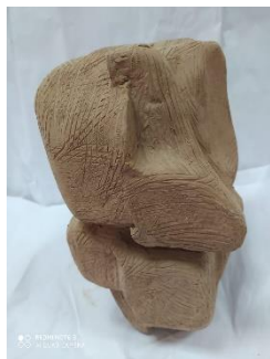
ارتفاع : 15سم عرض : 32 سم عمق: 17 سم طين اسوانلى - حريق على 0950م