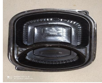
صورة رقم (4) توضح نموذج من شكل علب الأكل المستخدمة فى المطاعم

هناك نماذج أيضاً مستحدثه بحياتنا اليوميه وهى لعب الفوم والبلاستيك المستخدمه بالمطاعم.. فهى تتميز بتنوع أشكالها التي يمكن أن تستخدم كنماذج للتشكيل مع مراعاة طبيعة الخامه ، حيث أنها فى الغالب تكون ضعيفه ولايد لكى يمكن استخدامها مضاعفتها مره أو اثنتين حتى تصبح قوية ويمكن أن تتحمل خامة الطين.. وتضح بالصورة رقم ( 4 ) نموذج من هذه العلب .