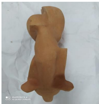
أبعاد الشكل: ارتفاع: 27 سم عرض: 20 سم

ارتفاع: 24 سم عرض: 26 سم عمق: 11 سم طين اسوانلى - حريق على 950 درجة مئوية يتضح بالشكل بعد تعبيرى من خلال التعبير عن الصخور من الطبيعة بألوانها وتشققاتها .