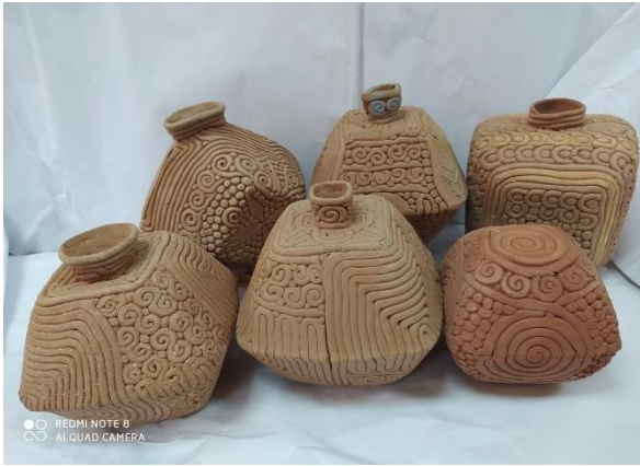
صورة رقم (1) توضح تكرار استخدام قوالب متشابهه للطلاب فرغم جودة التشكيل بالحبال داخل القالب إلا أن تكرار شكل القالب أدى إلى محدودية الاشكال المنتجة وافتقارها للثراء والتنوع الشكلي

وعلى هذا ترى الباحثة أنه يمكن إيجاد مدخل لأستحداث هياآت خزفية غير تقليديه من خلال الصياغات الشكلية للقالب (غير التقليدي)، حيث يتناول البحث الحالي أتجاه لمحاولة الابتكار فى مجال الخزف من خلال أمكانية التجديد بتقنية القالب لأنتاج هياآت خزفية جديدة تحمل قيم جماليه وتتميز بكونها مختلفه عن تلك التى من المعتاد أنتاجها بنفس التقنيه مما يمكن أن يشكل أتجاه جديد للطلاب ممارسى فن الخزف للأفادة من تلك التقنيه بفكر متجدد وفتح مجال للتجريب فى أطار المحاولات المتعدده لأستحداث هياآت خزفيه.