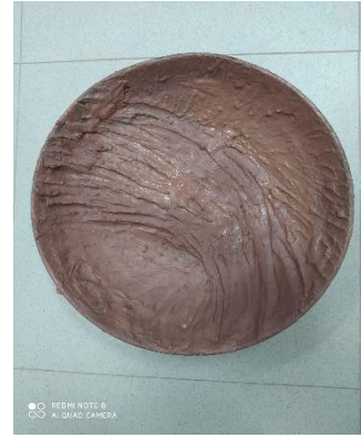
صورة رقم (13 ب) معالجة النموذج السابق بالصورة (13أ) حتى يتم إعادة صياغته

وفيما يلي عرض لصور العديد من الأعمال للطلاب...منها أعمال تحتوى على بعد تعبيرى كالأتى: