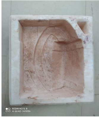
صورة رقم (10) توضح شكل القالب المستخدم بالعملان