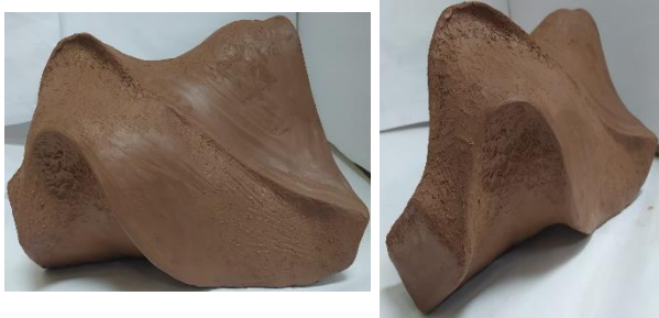
صورة رقم ( 12 ب ) توضح الشكل المنفذ داخل القالب السابق حيث يتضح به القيم الجمالية الخاصة نتيجة تميز هيئته المستحدثة والتي تتميز بالانساييه والمرونه .