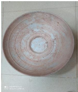
صورة رقم ( 13 أ ) توضح نموذج القالب

يتضح من صورته رقم ( 13 أ ) شكل لنموذج اعتاد الطلاب استخدامه وهو شكل "لقصه" والمستخدمه فى أعمال البناء لوضع الأسمنت بها.. كما نلاحظ بالصورة رقم ( 13 ب ) قد تم معالجة هذا النموذج حتى يتم إعادة صياغته وبالتالي قد تم من خلال التشكيل بهذا القالب هيئته خزفيه غير تقليديه وقد استخدم الطالب بطانه من أكسيد المنجنيز للتأكيد على بعض الخطوط مما أدى إلى تحقق قيم جماليه بالهيئته الخزفيه التى أصبحت غير تقليديه وتتميز بالابتكار من خلال إعادة صياغة القالب التقليدى.