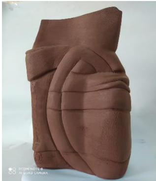
صورة رقم (11 أ) توضح العمل الأول

حيث يؤكد العملان على فكرة انالوجيا أستخدام ذلك النوع من القوالب (فوم من المستهلكات) والقوالب التقليديه .. بل على العكس فقد نتج عن هذا القالب هيئة خزفيه مستحدثه مما يؤكد على صحة فروض البحث.