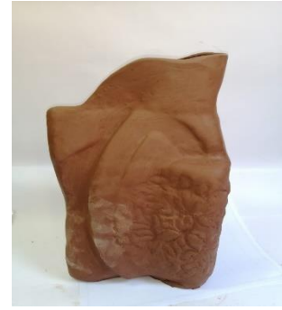
صورة رقم ( 11 ب ) توضح العمل الثانى والذى يتشابه