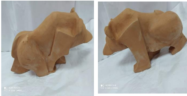
أبعاد الشكل: ارتفاع: 21 سم عرض: 38 سم

وفيما يلي عرض لصور العديد من الأعمال للطلاب...منها أعمال تحتوى على بعد تعبيرى كالأتى: