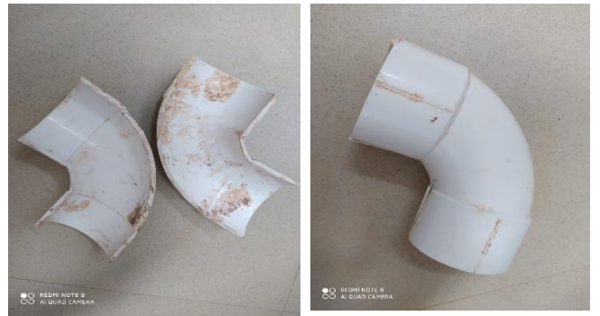
صورة رقم (9)

أستخدامه مع الغاء بعض التفاصيل المبالغ فيها وذلك بسدها بالطين قبل البدء فى استخدامه . ومن أمثله على أمكانية تخيله لأبتكار هيئة خزفية بالاستعانة بقالب غير تقليدى أستخدم ماسورة مياه على شكل أقرب لحرف ال C ، يتم قصها إلى نصفين متساويين كما بالصورة رقم (9) وتستخدم كقالب بحيث يمكن من خلاله انتاج هيئة خزفية كما بالصورة رقم (10) حيث تمكن الطالب من تكملة العمل برؤيته الخاصه بأمتداده من الجانبين بأسلوب أدى إلى أبتكار هيئة خزفية غير تقليدية.