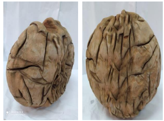
الصورة رقم (13 ب) توضح نموذج القالب ثم إعادة صياغته ثم شكل الهيئة الخزفية المستحدثه المنفذه به

عمق: 10 سم طين اسوانلى - حريق على 950 درجة مئوية يتضح بالشكل بعد تعبيرى حيث أنه يعبر عن تجريد لحيوان.