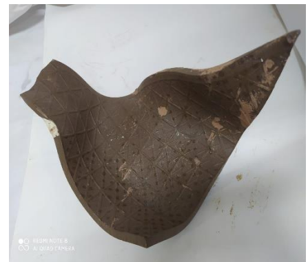
صورة رقم ( 12 أ ) توضح شكل قالب غير تقليدى