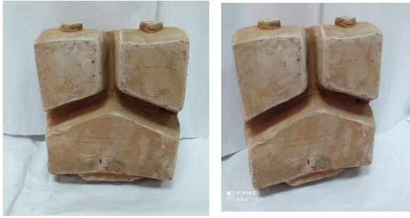
صورة رقم (14) توضح هيئته الخزفية مستحدثته منفذه بعلبه طعام ارتفاع: 17 سم عرض: 15 سم عمق: 8 سم طين اسوانلى - حريق على 950 درجة مئوية