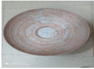
صورة رقم (6) لنموذج يمكن استخدامه كقالب

هناك العديد من القوالب أو النماذج التي أعتاد الطلاب استخدامها لأنجاز أعمالهم ، والتي ذكرنا سابقاً أنها فى كثير من الأحيان تؤدي إلى تشابه أعمالهم ووجود نسخ مكرره من بعضهم البعض. ولذلك ترى الباحثه أنه يمكن إعادة صياغة أى من تلك النماذج المعتاده برؤيه خاصه للخزاف وذلك بالتغيير فى شكل القالب بالإضافة أو الحذف تبعاً لخامة القالب وامكانية التعامل معها ، وبالتالي تكون النتيجة أستحداث هيئات خزفيه غير تقليديه من خلال أستغلال هذا القالب... حيث يستمد الشكل الخزفى كيانه على أساس مدى ترابط أجزائه المتمثله فى العناصر التي يستخدمها الفنان بصياغات تشكيليه تتميز بخصوصية التقنيه الأدائيه كمحاولة لأستحداث هيئه خزفيه بمعالجات شكلية غير تقليديه .