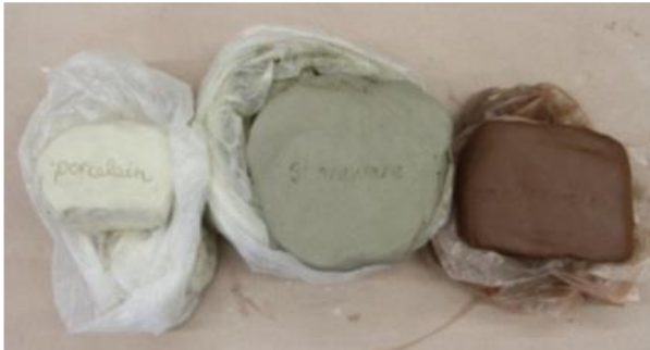
شكل (1) يوضح الإختلاف بين الطين الأسوانلي بلونه البني

- مرحلة الحريق الأول (فخار): ويتم فيها رص قطع الحلي الجافة فوق بعضها بحذر حتى لا يتم كسر بعض القطع في أفران الحريق الخاصة بالخزف, مع رفع درجة حرارة الفرن تدريجياً ببطء إلى الوصول لدرجة الحرارة المطلوبة بحسب نوع الطينة المستخدمة. وبعد خروج قطع الحلي من الفرن يظهر بها التأثير الشكلي الناتج عن الثمار والبذور المستخدمة في كل قطعة كما تترك بعضها تأثيراً لونياً في مكانها ناتجاً عن نسبة العناصر المعدنية الملونة الموجودة بها.