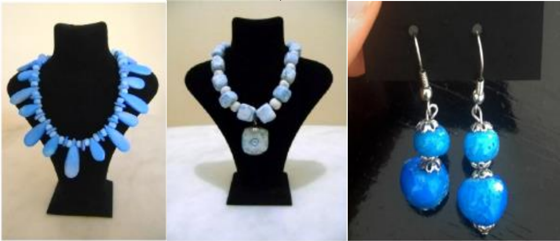
شكل (2) تنفيذ تطبيقات الحلي وإنتاج تشكيلات الحلي باستخدام تقنية العجينة المصرية

الرفيع، يمكن للحلي الخزفية تحقيق تنمية طويلة الأجل. وسوف تندمج تدريجياً في السوق الشامل وتحقيق مساحة أكبر للتنمية. طريقة الدمج وإضافة للخامات المعدنية: يعد الدمج وإضافة المواد المعدنية الثمينة على الحلي الخزفية عن طريق تقنيات التجميع والترصيع والتطعيم. وهي الجمع بين المواد المعدنية الثمينة والمواد الخزفية في شكل إكسسوارات وفقاً للتصميم بغرض تشكيل حلي خزفية كاملة. وقد تم استخدام هذه الطريقة لأول مرة لحماية وتزيين الخزف قديماً. في وقت لاحق، طبق المصممون هذه الطريقة في تصميم الحلي الخزفية. من ناحية، يمكن لهذه الطريقة التغلب على أوجه القصور في الحلي الخزفية الهشة ولعب دور حماية. من ناحية أخرى، يمكن أن ينطلق الشكل واللون والملبس والنمط للعب دور زخرفي. كما أن ثراء وتطور الحلي المعدنية الثمينة يكمل بساطة وأناقة الحلي الخزفية، من ناحية خصائص الدمج الكيميائي باستخدام مجموعات متعددة من الخامات المختلفة والمعادن الثمينة أظهرت الدراسات أن حل التطبيق الكهروكيميائي للمواد المعدنية الثمينة في