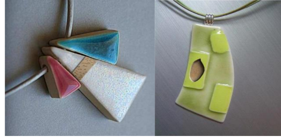
شكل (5) نماذج من الحلي الخزفية في مصر (زهيرة توفيق وربهم عمران : 2019)

في دراسة مشتركة استهدفت الاستفادة من الإمكانيات الخزفية والمعدنية كمواد خام لها دور وظيفي وجمالي لإنتاج مصنوعات حلي خزفية مبتكرة في إطارها الوظيفي المعروف ومستوحاة من التراث الإسلامي بالاعتماد على مفردات الزخرفة الإسلامية كنقطة انطلاق لتشكيل والتعبير عن محتواها الفكري ودلالاتها التعبيرية. وفي هذا السياق، يعد إنتاج تصميمات مبتكرة للحلي الخزفية المعدنية ذات الرؤية المعاصرة مع الحفاظ على الطابع الإسلامي من خلال توظيف مفردات الزخرفة الإسلامية، فضلاً عن تعزيز مبدأ التوليف بين المواد المختلفة الخزفية والمعدنية وتعدد المجالات كنقطة دخول للابتكار في الفن التشكيلي، ومن أهم النتائج أنه يمكن الحفاظ على الهوية الإسلامية من خلال صنع الحلي الخزفية المعدنية ذات الطابع الجمالي والسمات الرسمية المستوحاة من المفردات الخزفية للفن الإسلامي. (Moneim, D.A., & Ali, A.F. : 2020)