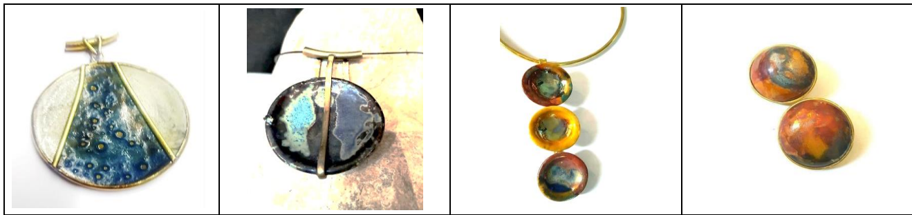
شكل (6) بعض نماذج الحلي الخزفية من تصميم وتنفيذ الباحثة

مختلفة باستخدام اكاسيد وملونات معدنية منها اللامع والمطفى والبريق المعدني تعطى التأثيرات اللونية المتنوعة بالإضافة الى استخدام معدن النحاس لاستكمال تصميم قطعة الحلي واطافة معايير جمالية ووظيفية للقطع.