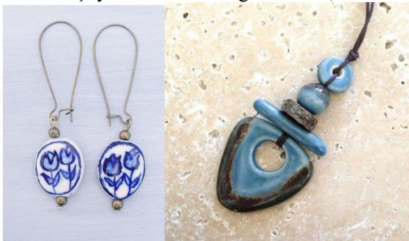
شكل (4) نماذج من الحلي الخزفية في تركيا