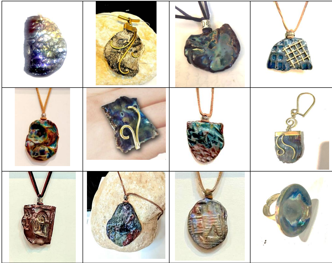
شكل (8) نماذج أخرى من الحلي الخزفية من تصميم وتنفيذ الباحثة

وعناصر أخرى مثل الذهب أو الفضة أو البزموت أو النحاس.