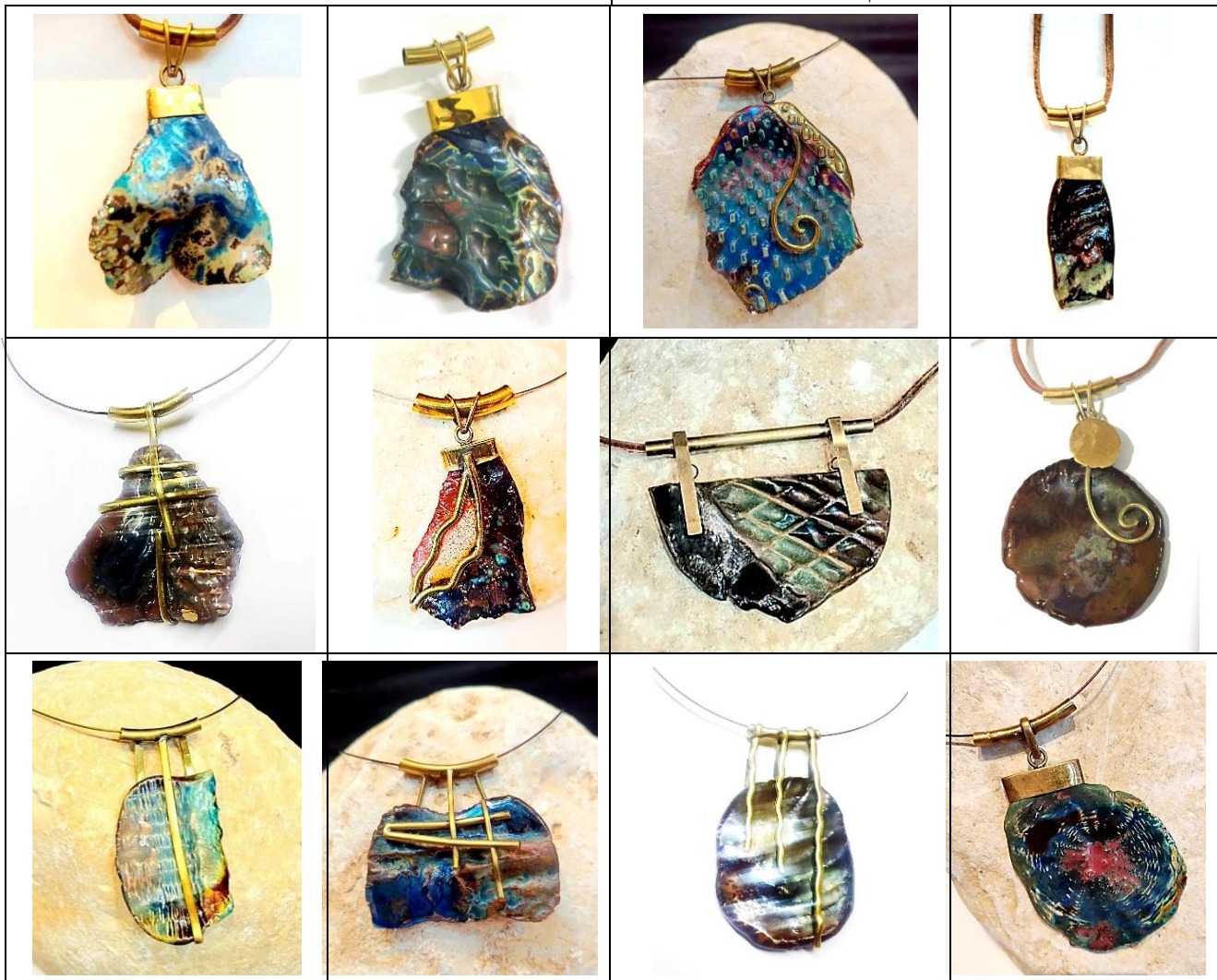
شكل (7) بعض نماذج الحلي الخزفية من تصميم وتنفيذ الباحثة

مجموعة من القلادات والخواتم وحلق واسورة حلى خزفية تشكيل يدوى من خامة البورسلين حريق درجة حرارة مرتفعة 1350 مصدر التصميم هندسى باستخدام الشكل الدائرى مع مراعاة التنوع والتفرد فى التصميم لقطعة الحلى من خلال معالجات السطح المتنوعة من خلال الملابس واستخدام طلاءات زجاجية بتقنيات