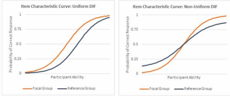
شكل (١) : الأداء التفاضلي المنتظم وغير المنتظم

الفقرة على طول فترة القدرة ، وهذا يعني حدوث تفاعل بين مستوى أداء الفرد وانتمائه للمجموعة ، والشكل التالي يوضح الأداء التفاضلي المنتظم وغير المنتظم.