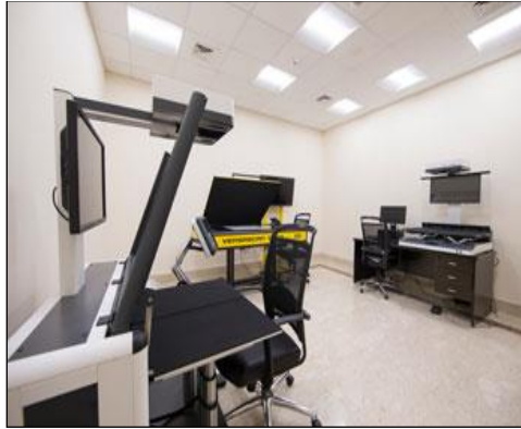
شكل رقم (٦) يوضح جهاز التصوير الضوئي للمخطوطات - دار المخطوطات الإسلامية - الجامعة القاسمية - إمارة الشارقة.

- المرحلة الخامسة: مرحلة التصوير الضوئي للمخطوطات: تكرر هذه الخطوة مرتين خلال رحلة المخطوط، حيث يقوم المختص بتصوير صفحات المخطوط بعد التنظيف الجاف، ليتم أرشفة المخطوط بحالته الأصلية، وللرجوع لهذه النسخة في حال حدوث أي ضرر بالمخطوط خلال عمليات الترميم والتي قد تحدث اعتماداً على مدى سوء حالة المخطوط المادية، كما يتم تصويره مجدداً بعد عمليات الترميم والمعالجة. ويكون التصوير عن طريق أجهزة عالمية مصممة لأرشفة المخطوطات (والموضحة في الشكل التالي رقم "٦")، بحيث تكون أشعتها مناسبة وغير ضارة بالورق، كما أنها مزودة بمسند توازن يسمح بتعديله حسب حجم المخطوط وسُمكِهِ، بحيث يسمح بأن تكون الصورة المأخوذة بزاوية عمودية وواضحة، وتُخزَّن الصور على الخوادم الخاصة بالدار.