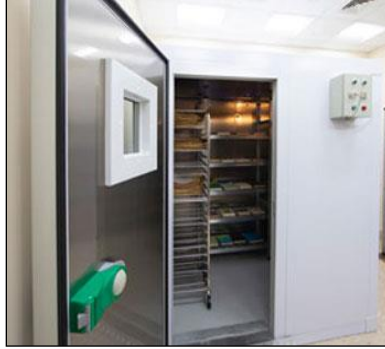
شكل رقم (٤) يوضح غرفة تعقيم المخطوطات - دار المخطوطات الإسلامية - الجامعة القاسمية - إمارة الشارقة.

عملية التعقيم لمدة ٢٤ ساعة. مع العلم أن هذا الإجراء، يتم بصفة دورية (مرة كل سنة) لكامل مخطوطات الدار، لضمان وقايتها الدائمة من أي نشاط بيولوجي وميكروبيولوجي.