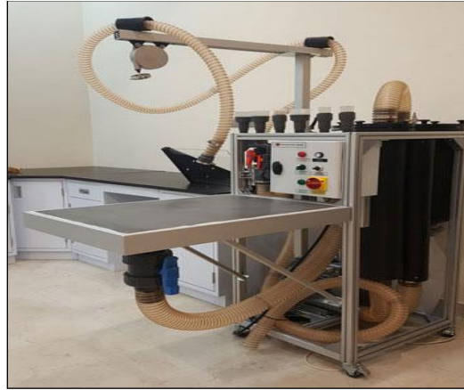
شكل رقم (٥) يوضح جهاز التنظيف الجاف للمخطوطات - دار المخطوطات الإسلامية - الجامعة القاسمية - إمارة الشارقة.

- المرحلة الثالثة: مرحلة التنظيف الجاف: والتي تجرى بغية إزالة أي شوائب أو آثار لحشرات أو نباتات أو غبار أو غيره من المواد التي يمكن أن تلحق ضرراً بالمخطوطات، ويجري تنظيف المخطوط صفحة صفحة عن طريق استخدام جهاز متطور (الموضح في الشكل التالي رقم "٥")، مزود بطاولة خاصة للعمل ترشح من خلالها الشوائب، ويعمل بأسفله آلة شفط يمكن التحكم بقوتها، كما تُمسح الورقة، وتستبعد الشوائب باستخدام فرش مختلفة من حيث الحجم والقوة أو النعومة. وفي بعض الحالات، يتم اللجوء إلى استخدام المذيبات العضوية إذا لزم الأمر.